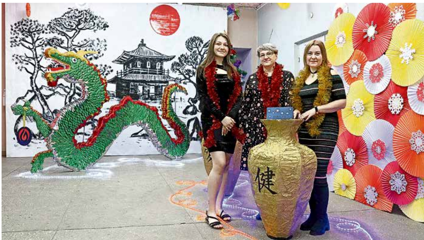
▲ Самый «китайский» Новый год получился у работников управления по производству запасных частей