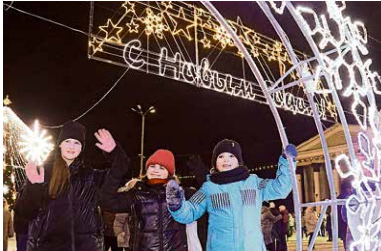
▲ Все, кто пришёл в предновогодний вечер на площадь Metallurgov, благодарили Уральскую Сталь за сказочный по красоте ледовый городок

Вслед за доменщиками поздравления принимали коксохимики КХП, сталевары ЭСПЦ, листопрокатчики ЛПЦ-1. По мнению управляющего директора, каж-