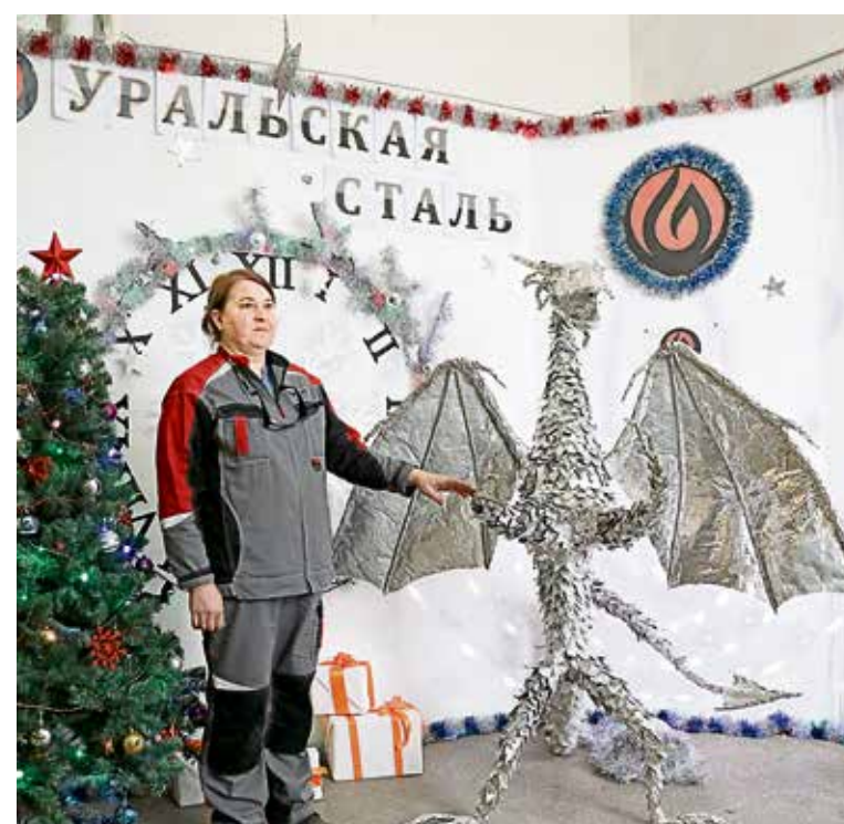
▲ Подруга Ночной Фурии, серебристая Дневная дракониха поселилась в ЭЭРЦ