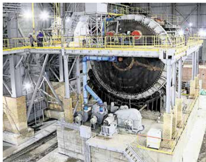
▲ Новый агрегат позволит Уральской Стали быть более устойчивой к рыночным колебаниям цен на сырьё

— Очень хочу верить, что он будет лучше уходящего! А ещё я верю в наших людей, в их профессионализм, в их трудолюбие: это помогает идти вперёд. Пусть в новом году нам везёт, а здоровье будет крепким, как наша сталь!