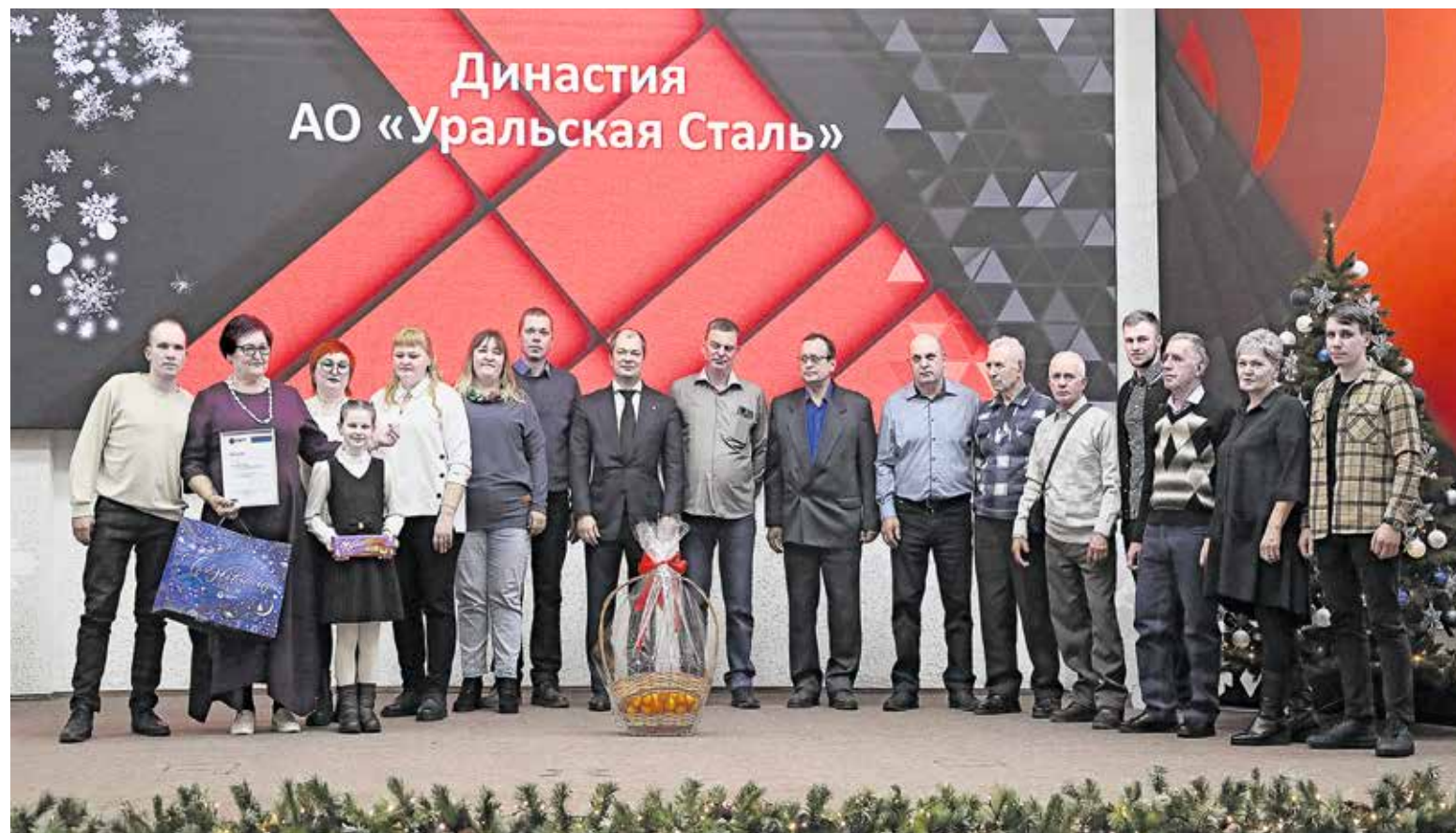
▲ Общий трудовой стаж на комбинате рода Ясаковых — 682 года. Не у всякой монархической династии столь солидный возраст

Металлурги завершают уходящий год чередой праздничных событий