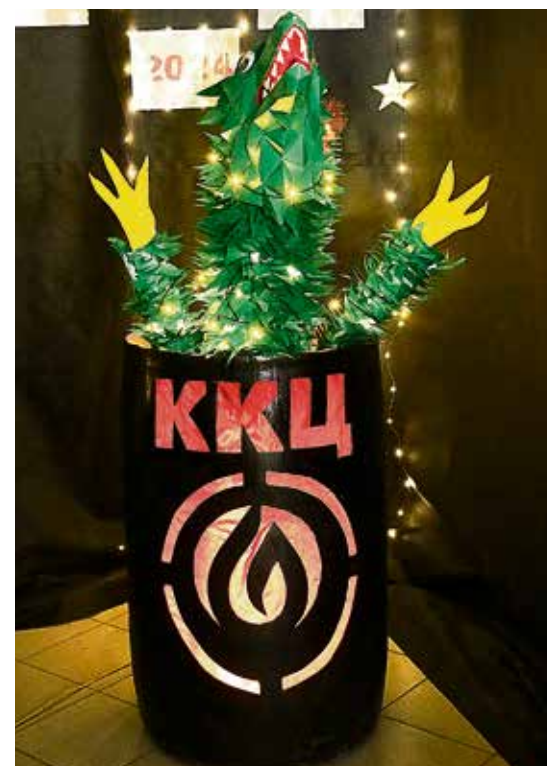
▲ Для светящегося дракона из ККЦ соорудили печь