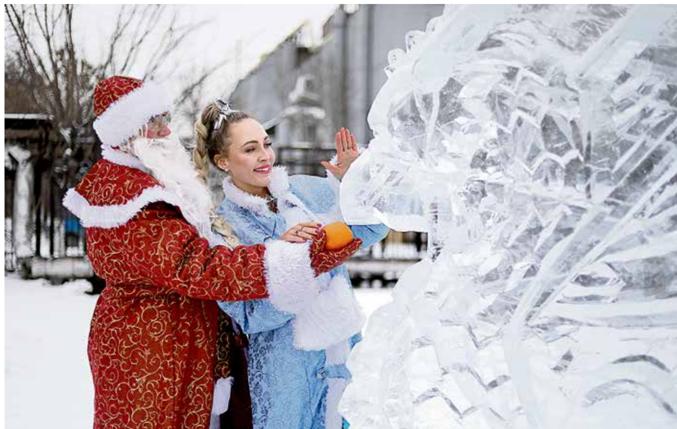
▲ Редкий случай, когда Дед Мороз со Снегурочкой и журналисты «Металлурга» — одни и те же лица. Как не воспользоваться этой возможностью. Любимые читатели, поздравляем с Новым годом!