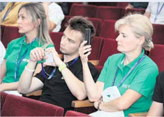
◀ Ценную информацию участники слёта фиксировали разными способами: конспектировали, снимали, записывали на диктофон