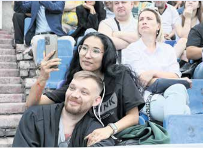
◀ Торжества в честь Дня металлурга на протяжении десятилетий — самый массовый праздник в Новотроицке