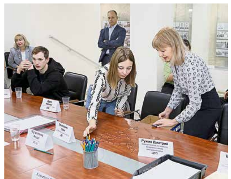
▲ В работе центра оценки и развития применяют необычные способы проверки гибкости мышления — например, создание изображений с помощью... обычных спичек

На этом активная фаза программы будет завершена. Но ещё в течение двух лет специалисты по персоналу продолжат отслеживать служебно-должностное продвижение подопечных, по мере необходимости привлекая их к тренингам, предусмотренным для кадрового резерва.