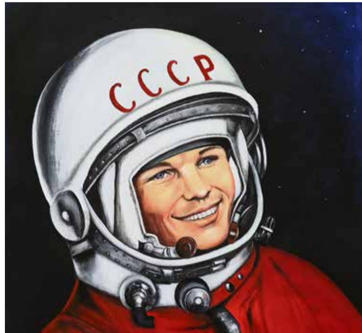
◀ Елена Ромашкина давно окончила студию, но до 2023 года не решилась заняться самым трудным — портретом. Первый «полёт» в новый жанр ей удался

Последний день работы выставки — суббота, 20 января, экспозиция доступна до 17 часов. Если вы думали, где провести выходные, музей даст отличную возможность для культурного досуга. Для юных поклонников живописи доступен вход по «Пушкинской карте».