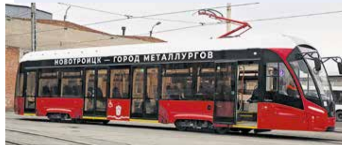
◀ Сразу после оформления документов и проверки технической готовности на линию выйдут первый «Львёнок» из 13 закупленных

► Пока металлурги оценивают новую продукцию кулинаров, «Уральский Сервис» следит за спросом. И готов вносить коррективы в рецептуру выпечки