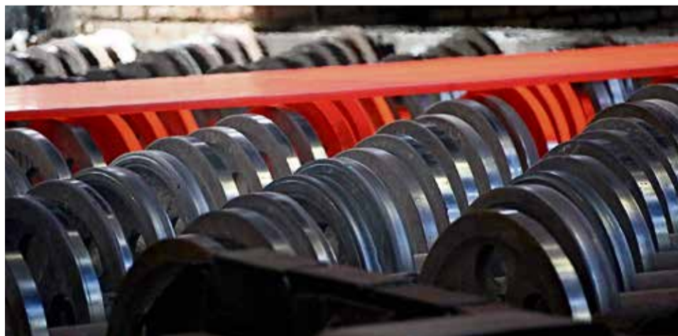
▲ Прочности лезвий должно хватать на порезку листов толщиной до пяти сантиметров — максимальной толщины проката на стане 2 800 ЛПЦ-1

— Победу в этом негласном конкурсе одержал образец высокопрочной стали с увеличенной долей никеля в химсоставе, усиленный другими легирующими элементами, устойчивый к повышенным (до 600°C) температурам. К тому же, он оказался хорош при ударных нагрузках, не-