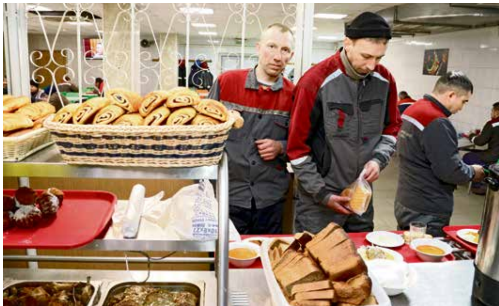
▲ Пока металлурги оценивают новую продукцию кулинаров, «Уральский Сервис» следит за спросом. И готов вносить коррективы в рецептуру выпечки