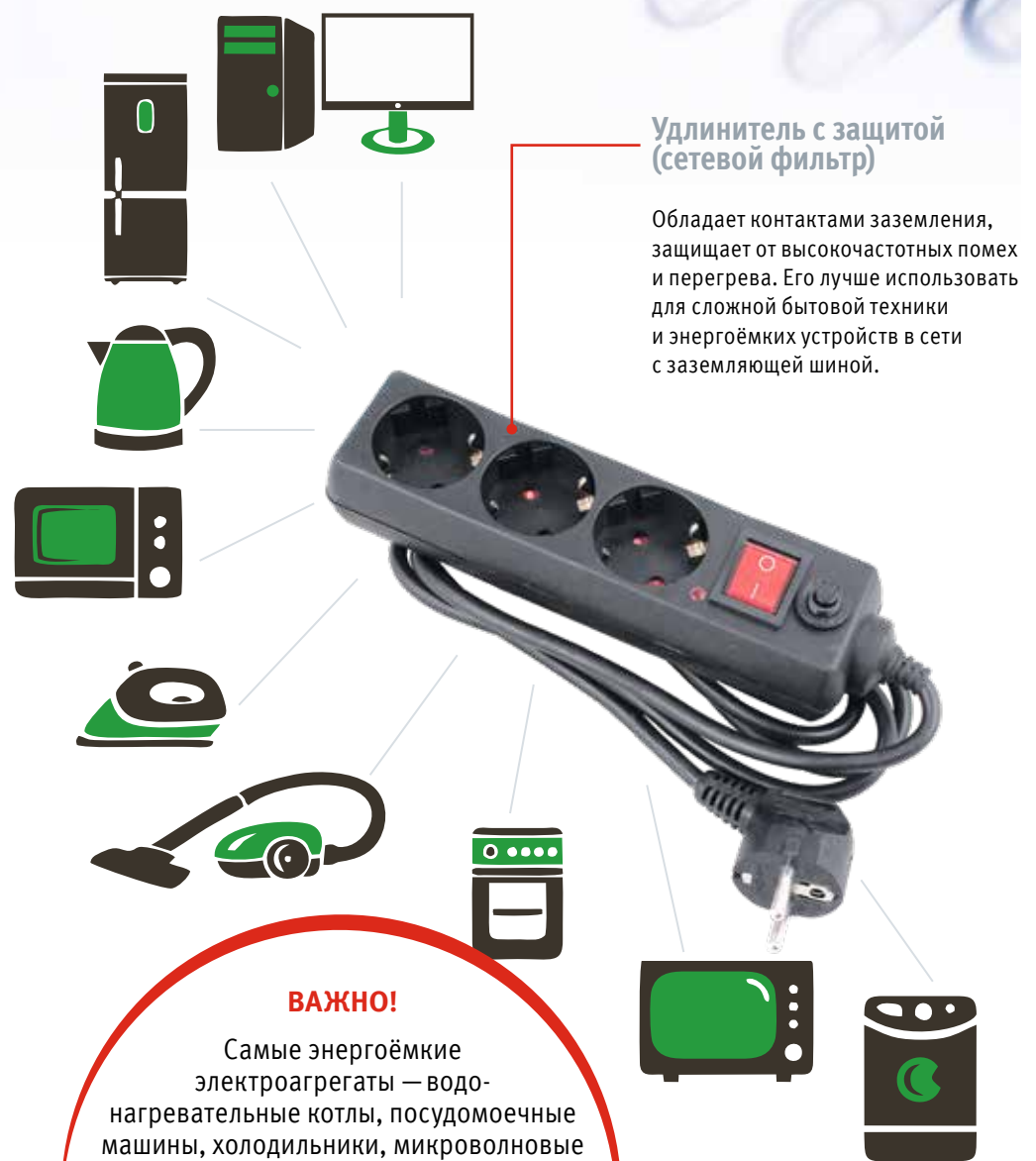
Удлинитель с защитой (сетевой фильтр)

Подойдёт для электроприборов с низким энергопотреблением.