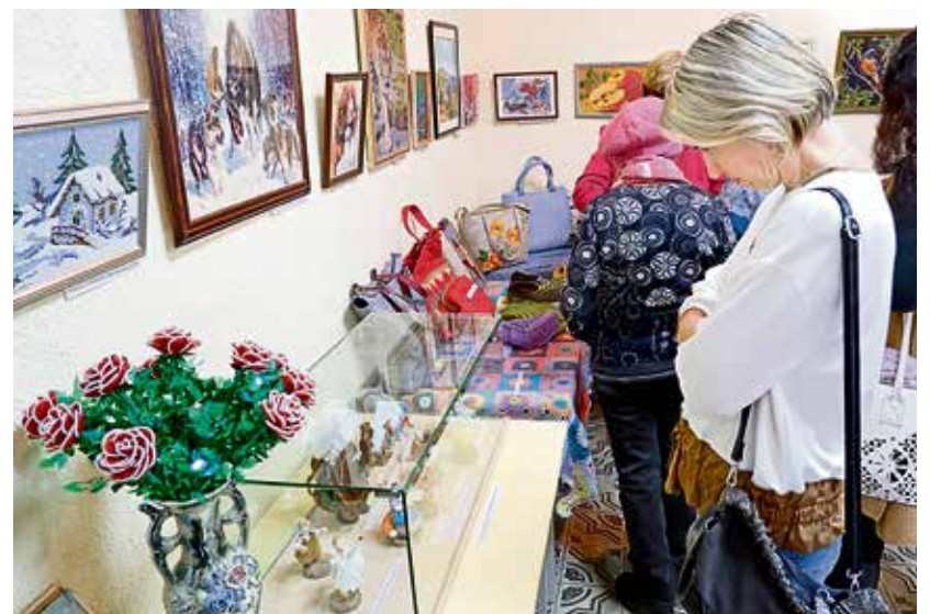
▲ Декоративные изделия ручной работы тем и хороши, что существуют в единственном экземпляре. И попытка их повторить рождает новую вещь