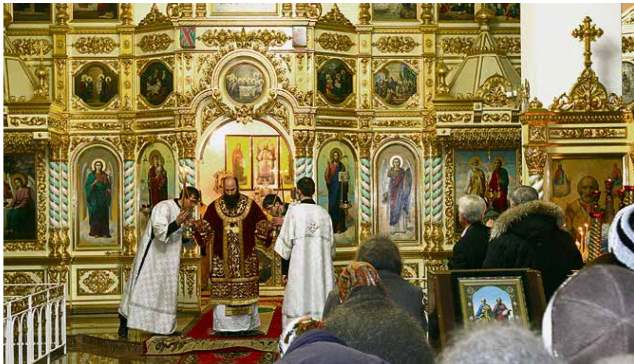
▲ С вечера Прощёного воскресенья церковь живёт напряжённой жизнью: к молитвам суточного круга священники добавляют особые каноны и акафисты

Великий пост в этом году будет идти с 18 марта до 4 мая — то есть 48 дней вместе со Страстной седмицей.