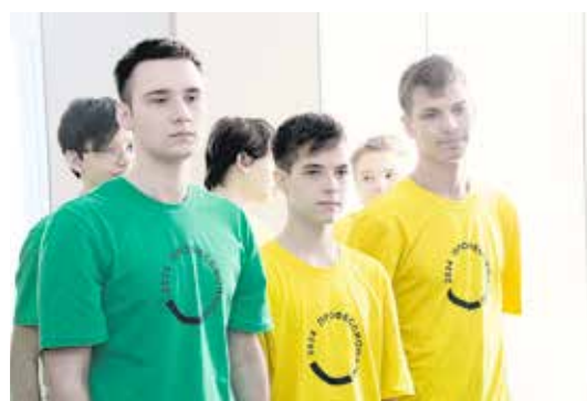
▲ Возможно, кто-то из этих ребят в ближайшие дни примерит на себя лавры победителя в одной из дисциплин нового чемпионата