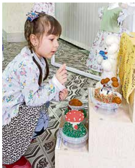
▲ На всякую «Грибную полянку» рано или поздно обязательно найдётся свой зайчик