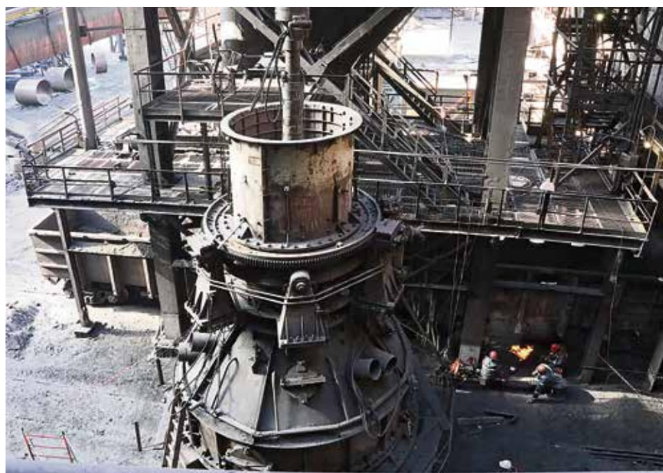
▲ Через двухконусное загрузочное устройство шихта начинает свой путь в домне, финал которого — выпуск очередной партии металла в чугуновозный ковш

Чтобы всё было сделано в срок, на объект вышли пять подрядных организаций и несколько цехов дирекции по техническому обслуживанию и ремонту. Наиболее ответственную задачу — замену