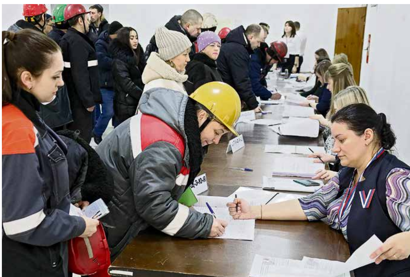
▲ В АТК Уральской Стали один из временных участков для голосования был развёрнут в просторном холле конференц-зала, который позволил вместить всех желающих