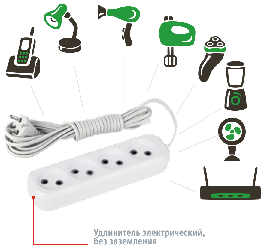
Удлинитель электрический, без заземления

Подойдёт для электроприборов с низким энергопотреблением.