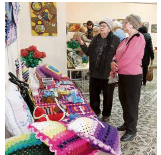
▲ Сумки с ручной отделкой, подушки-думки, мягкие игрушки и настенные панно — сюда стоит прийти, чтоб присмотреться и после закрытия экспозиции приобрести запавший в душу экспонат