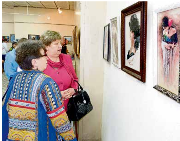
▲ Работа в технике алмазной мозаики требует кропотливости и терпения. Но результат стоит потраченных усилий

Выставка «Творческий калейдоскоп» будет работать до девятого апреля. Для школьников и студентов действует вход по Пушкинской карте.