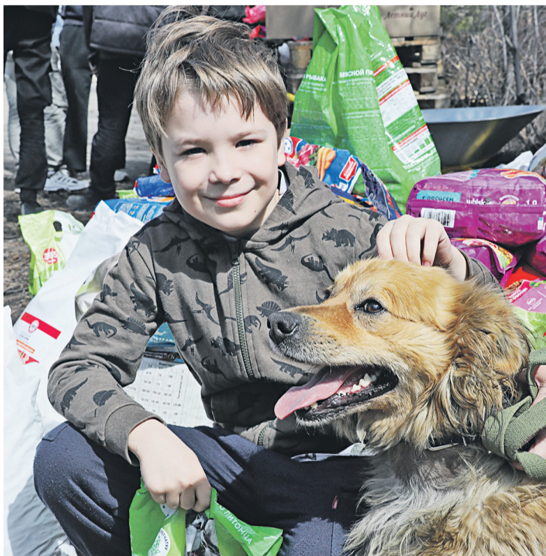
▲ В пункте временного размещения домашних животных на ул. Лысова, дом 11, вы обязательно найдёте друзей!

Поступивших в ПВР животных обязательно осматривают ветеринары. По словам специалистов, чем позже поступает питомец, тем хуже его состояние: сказываются длительное пребывание в ледяной воде и голод. Многие животные — с отравлениями и признаками клещевой инфекции. Есть собаки с тяжёлыми травмами и переломами.