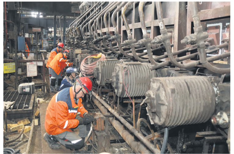
▲ Надёжность роликовой термической печи № 4 ЛПЦ-1 гарантирована на два года вперёд

Цеха дирекции по техническому обслуживанию и ремонтам Уральской Стали накопили