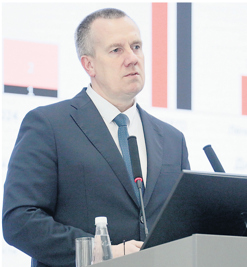
▲ Разбирая итоги первого квартала, управляющий директор рассмотрел работу комбината комплексно: охрана труда, производственные показатели, социальная политика

— Мы своевременно платим налоги в бюджеты всех уровней. И продолжаем реализацию намеченных социальных программ — уже направили на них порядка 55 миллионов рублей. Улучшаем состояние рабочих мест, помещений производственного назначения, — отметил управляющий директор