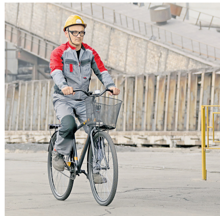
▲ С приходом весны открылся сезон для велосипедного транспорта. Скоро металлургов верхом на железном коне можно будет встретить не только на дорожках КХП

рублей составляет средняя зарплата работников Уральской Стали.