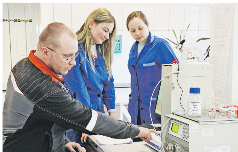
▲ На новом хроматографе идёт анализ пробы газовоздушной смеси на содержание бензоапирина

Экологические требования Росаккредитации ужесточаются с каждым годом. Чтобы им соответствовать, экологи Уральской Стали постоянно обновляют своё оборудование.