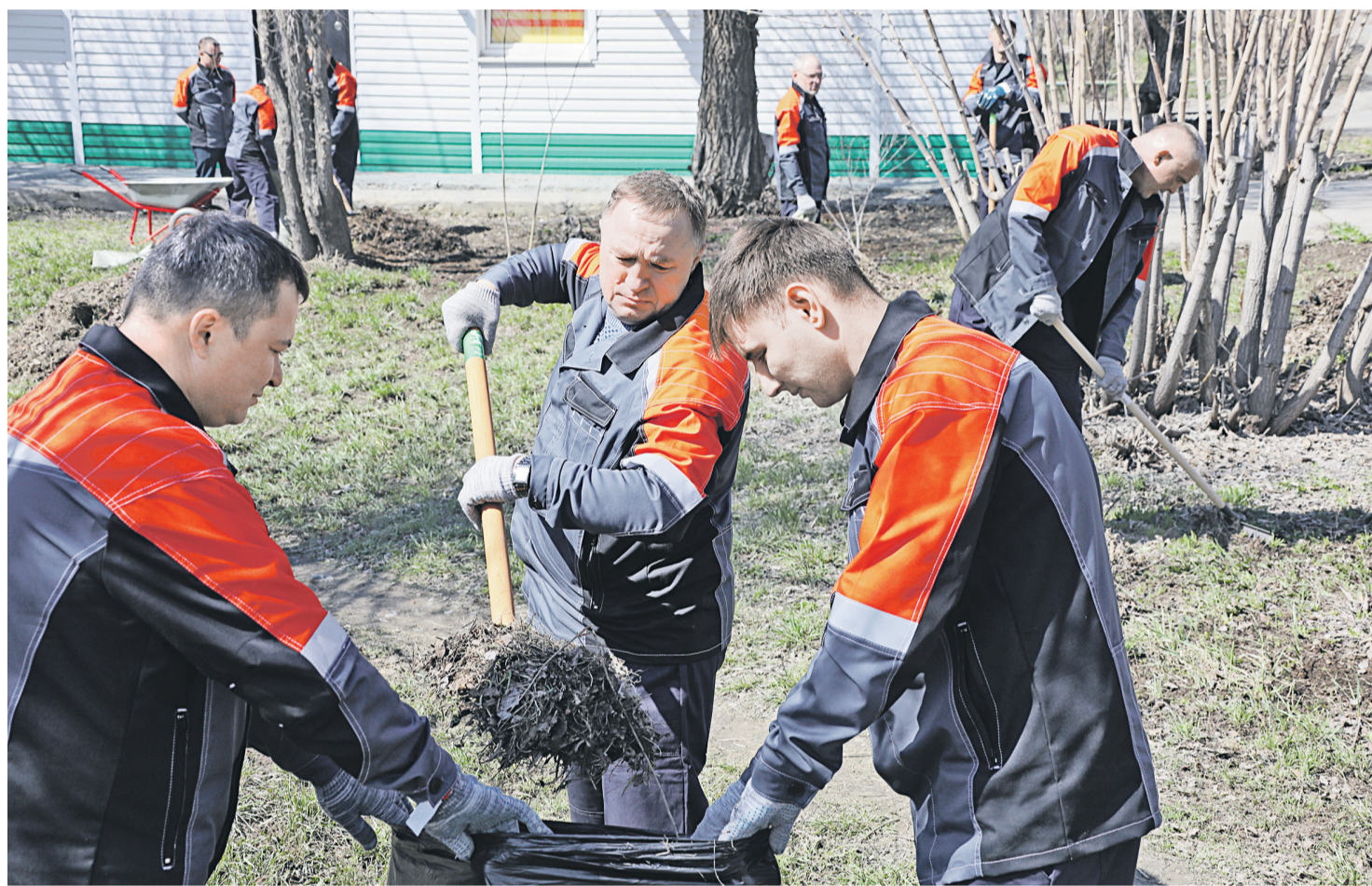
▲ Когда в наши края приходит беда, металлурги всегда оказывают поддержку землякам. Восточное Оренбуржье — наш общий дом