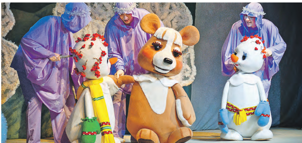
В спектакле «Солнышко и снежные человечки» используются планшетные (или паркетные) куклы