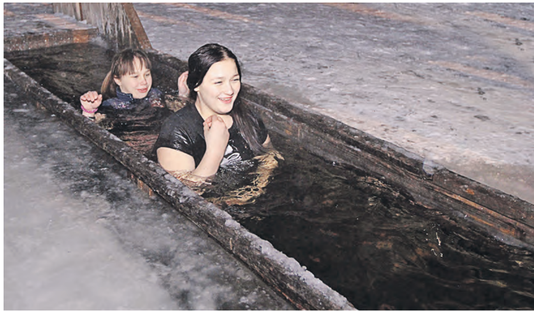
Сотни новотройчан в эту ночь прошли через купель у храма равноапостольных Петра и Павла

Крещение Господне – издавна считался одним из самых любимых и почитаемых праздников у православных христиан. По многовековой традиции, на Крещение освящалась вода в природных источниках, расположенных поблизости от населенных пунктов. Над вырубленной (часто в виде креста) полыней, так называемой «Иорданью», устраивалась выносная часовня, где и совершался чин водосвятия.