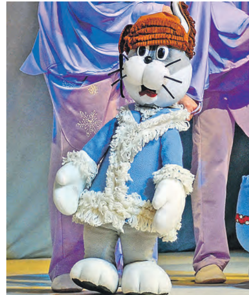
Труслявый заяц из «Солнышка...» полюбился зрителям