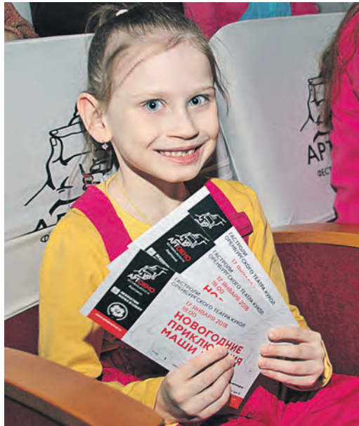
Театр кукол продлил новогоднее настроение детворе

В рамках фестиваля искусств АРТ-ОКНО при поддержке благотворительного фонда Алишера Усманова в Новотроицке прошли гастроли Оренбургского театра кукол.