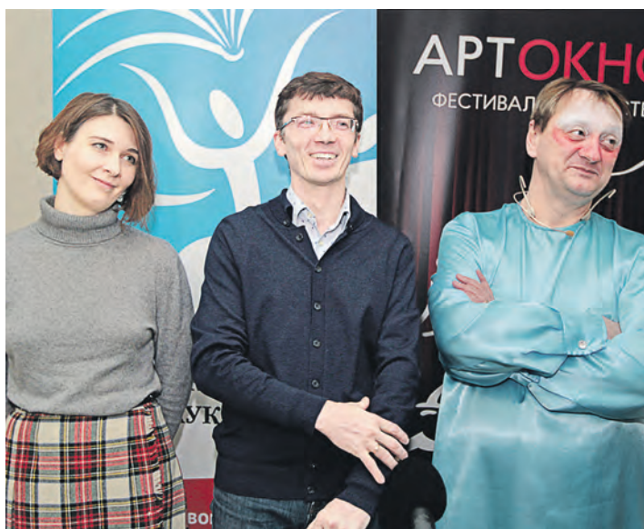
Журналистов интересовали все секреты творческой кухни кукловодов

Александр Проскуровский