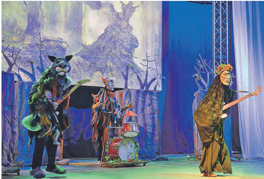
Знакомьтесь: сборная лесной нечисти – ВИА «Лесные самоцветы» (он же «Дикие гитары»)