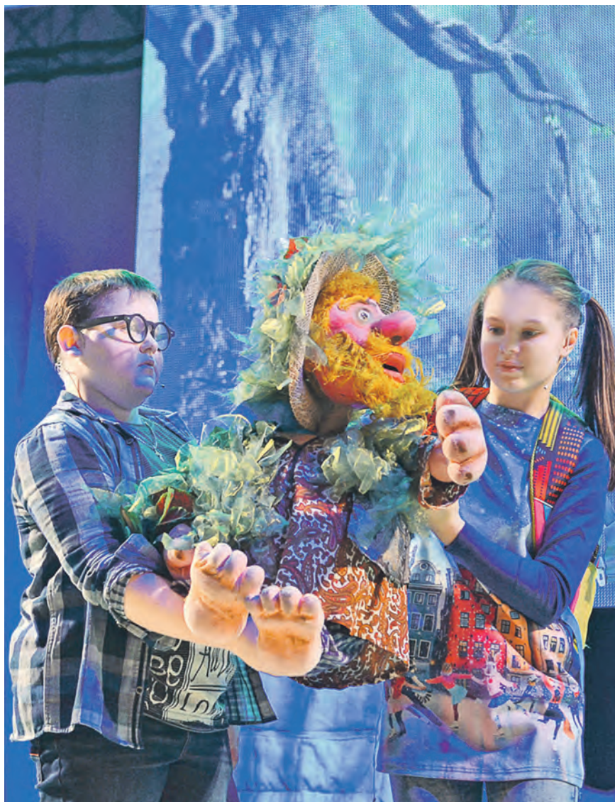
Путешествуя по Кощееву царству, Маша и Витя совершили много добрых дел