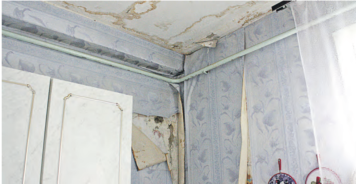
В случае, если ваша квартира стала временно непригодной для проживания, важным становится наличие документов об ущербе

«Не ждите неприятностей, просто будьте к ним готовы» – эта аксиома из теории управления рисками применима в любой сфере жизни. С чего начать, если свежий ремонт в квартире залит кипятком соседями сверху? Главное – не упускать мелочей.