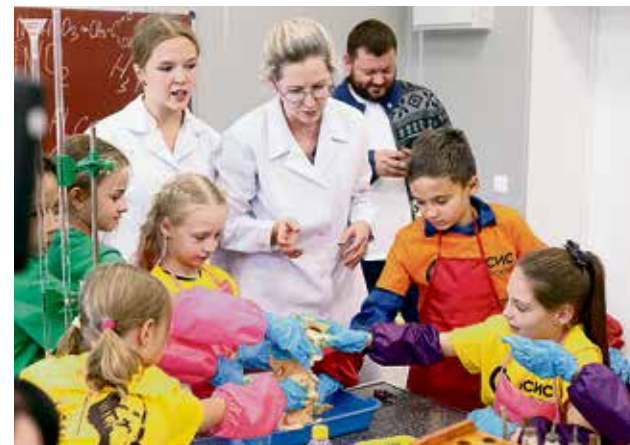
▲ Студенты показали юным гостям, что химия — дело нескудное, а заниматься познанием мира можно с раннего детства