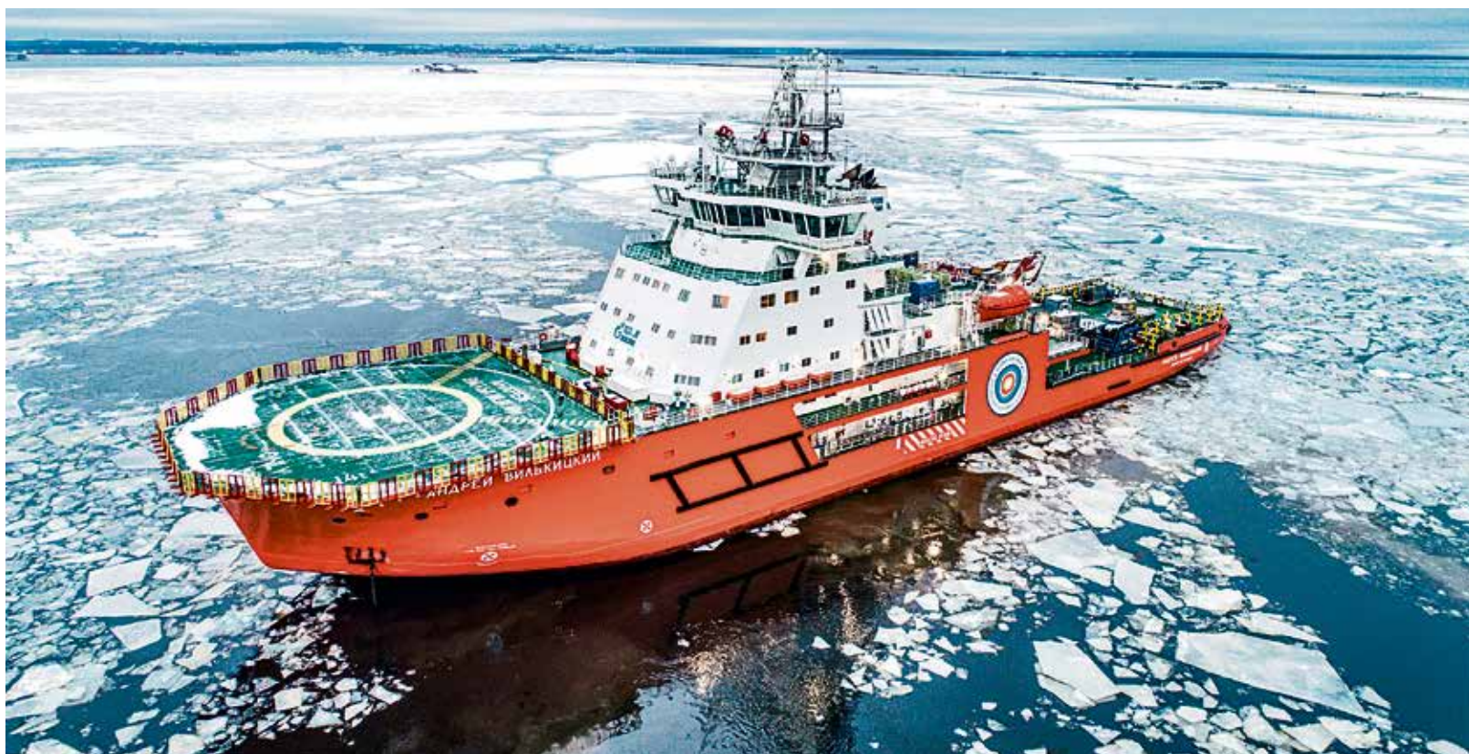
▲ С 2019 года на Северном морском пути работает ледокольное судно обеспечения «Андрей Вилькицкий». Выборгский судовой завод использовал для его изготовления металл Уральской Стали

Сегодня Уральская Сталь поставляет металл ведущим российским и зарубежным судостроительным предприятиям. Её применяют при строительстве многоцелевых ледоколов проекта Aker ARC 130 «Александр Санников» и «Андрей Вилькицкий».