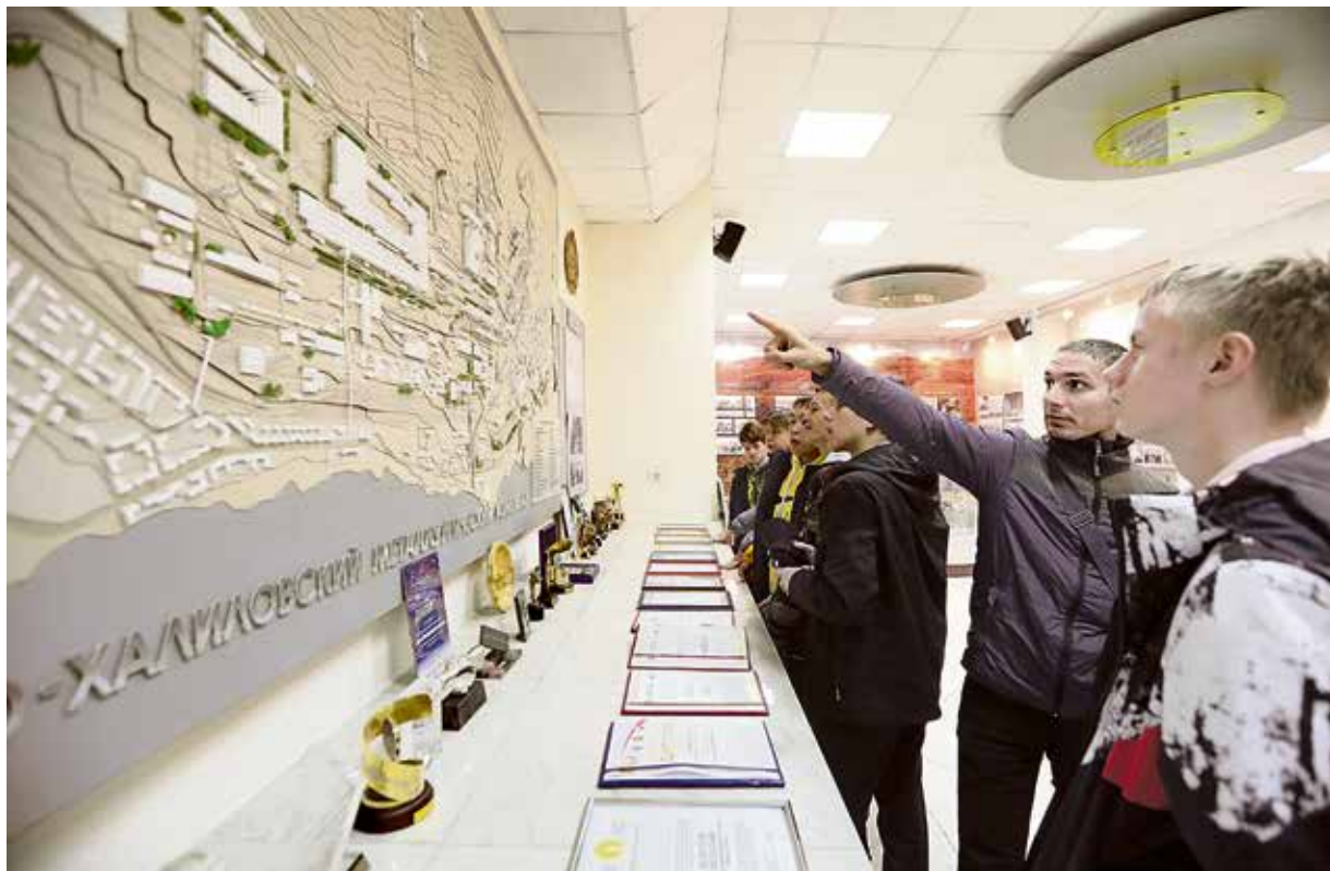
▲ В музее Уральской Стали: комбинат размером с город даже на макете способен поразить новичков масштабами

Уральскую Сталь посещают и школьники, и студенты