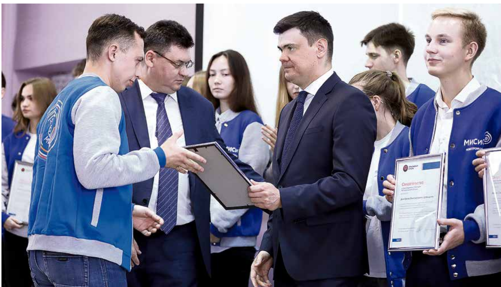
◀ На протяжении многих лет Уральская Сталь поддерживает активную, инициативную и ведущую здоровый образ жизни студенческую молодёжь