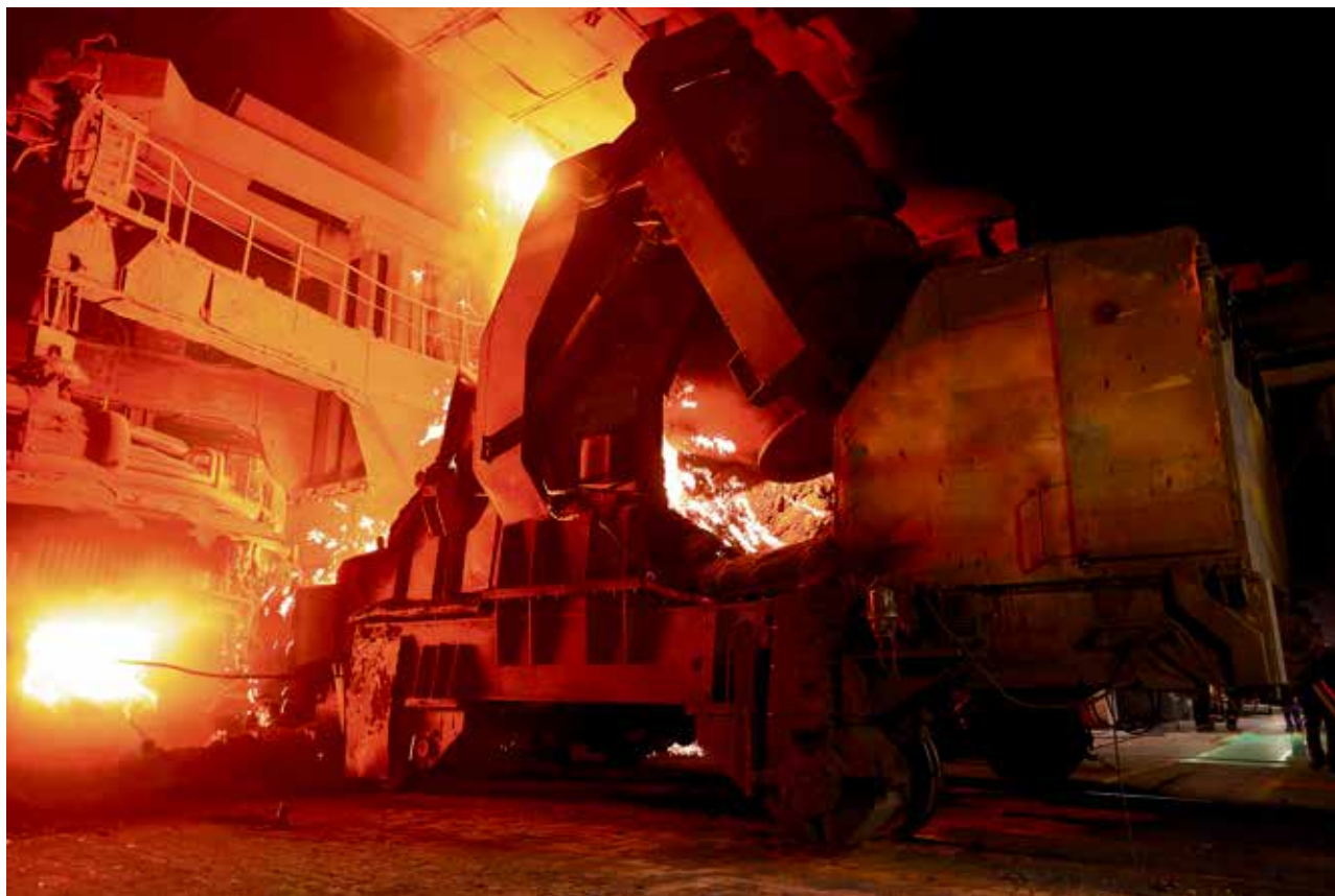
▲ Машина для заливки чугуна на второй печи весь сентябрь работала с удвоенной нагрузкой — и не подвела

Пока мы беседуем в пультовой ГМП-2, напольная машина слива чугуна, похожая на гигантскую катапульту из исторических фильмов, подъезжает вплотную к печи. Сталевар