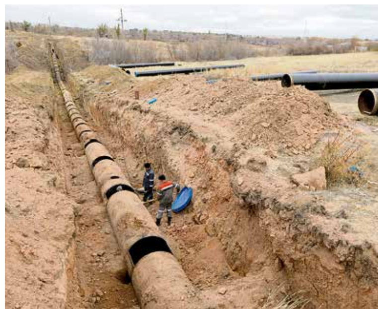
▲ Новый трубопровод важен и для города: ТЭЦ комбината обеспечивает теплом жителей Новотроицка, поэтому перебои подачи воды в зимнее время допустить никак нельзя

До середины декабря ремонтники ЦВС заменят участок водовода длиной 2 400 метров. Сейчас вдоль линии его пролегания идёт укрупнённая сборка: сварщики соединяют в «плеты» по несколько труб, тут же происходит контроль качества сварного шва. После завершения этих работ старый участок водовода поднимут из земли, и на его место уложат новую трассу. А отслужившие своё трубы получат вторую жизнь в печах ЭСПЦ Уральской Стали.