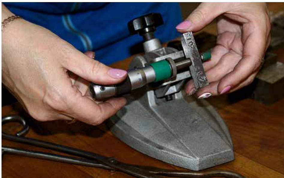
▲ При проверке судостали на ударный изгиб нет мелочей: перед установкой на стенд образец измеряют с точностью до сотых долей миллиметра

Впрочем, иногда от судостроителей поступают заявки на марки, производство которых не требует свидетельств о признании изготовителя. Проще говоря, это заказы на наши разработки, из которых на верфях делают пробные партии продукции, отработывая свои техно-