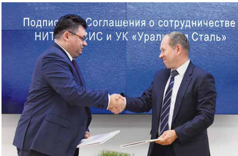
▲ Подписанный текст соглашения — результат интенсивной совместной работы теоретиков и практиков производства

За 30 лет МИСиС дал комбинату тысячи выпускников. Сотни из них стали руководителями производства и сегодня определяют техническую, технологическую и производственную политику комбината.