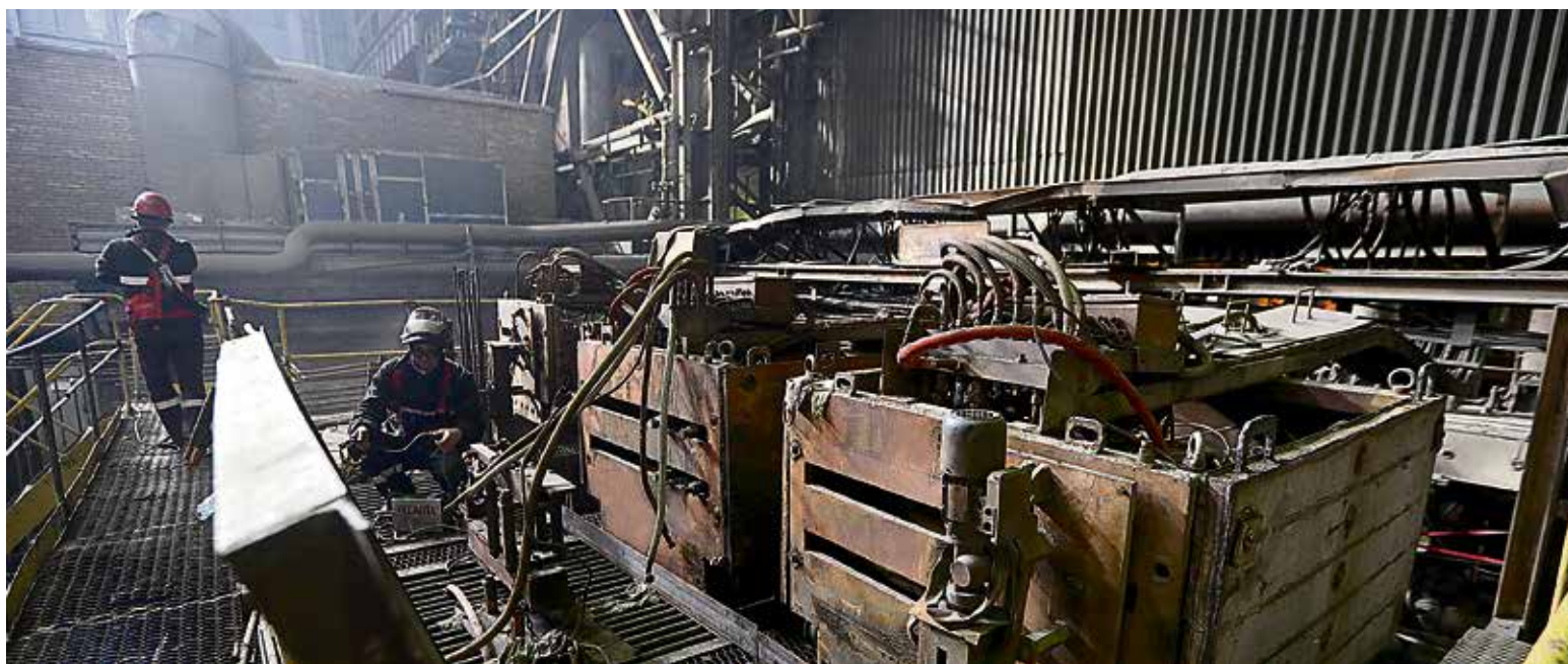
▲ Машина непрерывного литья настолько сложна и обширна, что работы на капремонте хватало всем: слесарям, гидравликам, электромонтёрам, строителям, сварщикам

— Львиная доля заказов, которые производила эта