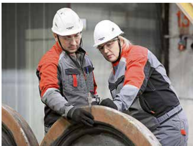
▲ От теории — к практике: преподаватели НПК теперь уверенно смогут дефектовать железнодорожные колёса