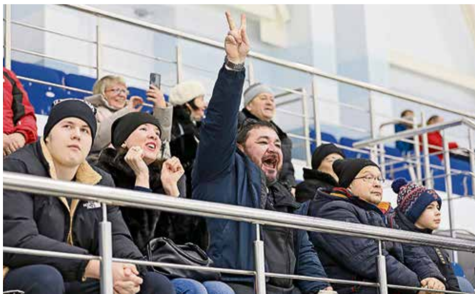
▲ Каждый гол «Уральской Стали» болельщики встречали восторженным гулом