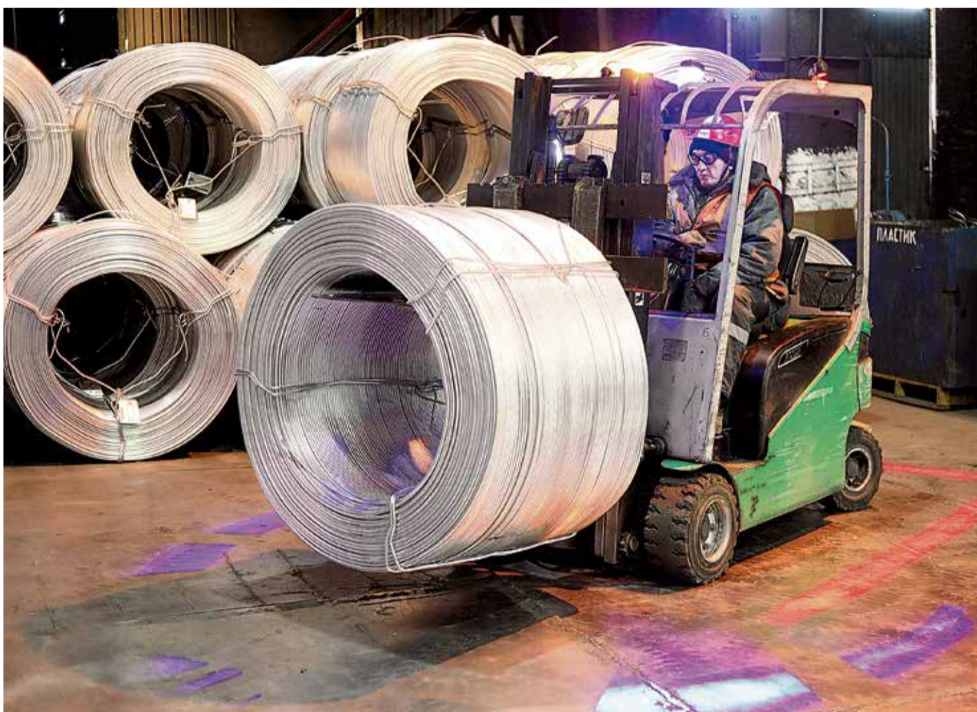
▲ Круговая подсветка позволяет оператору уверенно соблюдать безопасную дистанцию при движении в любом направлении