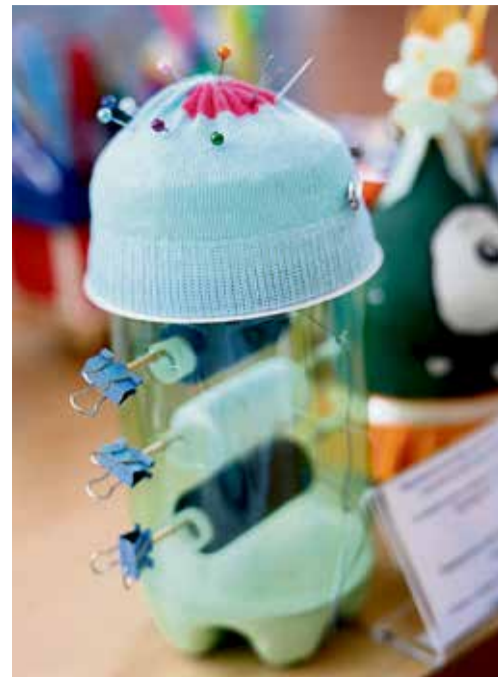
▲ Простая конструкция порадует бабушку-рукодельницу: теперь иголки не потеряются, а нитки не запутаются