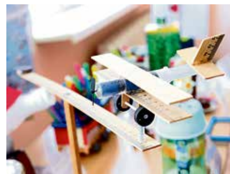
▲ Тяги небольшого моторчика хватает, чтобы запустить самолёт по кругу, а мастер при разработке узнал о том, что такое «плечо рычага» и как оно влияет на баланс модели