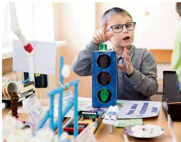
◀ Сигналы этого светофора нужно переключать вручную, поворачивая ручку сверху. Зато у юного изобретателя теперь есть опыт сборки моделей