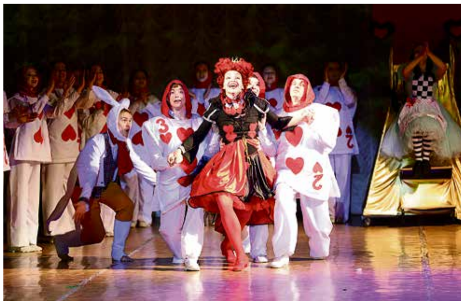
▲ Спектакль вышел органичным, потому совпал с коллективным характером «Данс Холла», у которого гротеск и экспрессия — непременная часть шоу

— Мы здесь вместе с сыном-первоклассником. Хотя сюжет сказки достаточно сложный, он, затаив дыхание, наблюдал за происходящим на сцене. Впечатлений масса: это просто феерия света, красок, пластики!