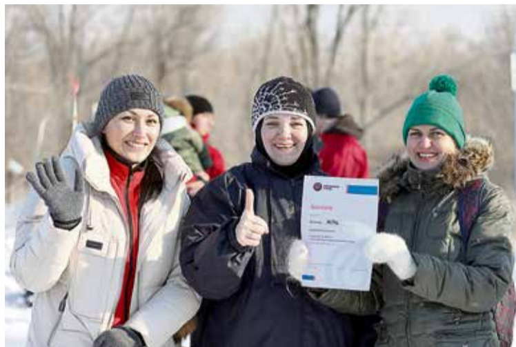
▲ Второе место в эстафете, кажется, совсем не огорчило женскую сборную ЭСПЦ

Ежегодную спартакиаду Уральской Стали открыла лыжная эстафета