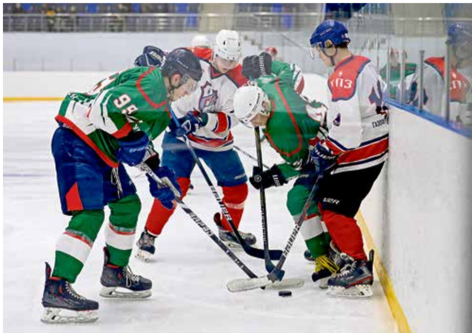
▲ С газовиками новотройчане играли строго и не дали им создать больше одного голевого момента

— В начале игры были шансы создать голевой задел — мы их не использовали. Что ж, это нам урок на будущее: свои моменты надо забирать. Игра с соперником, который намного моложе, — всегда особая история: можно крупно выиграть, а можно... В общем ждём ответной игры, — сказал тренер новотройчан Мак-