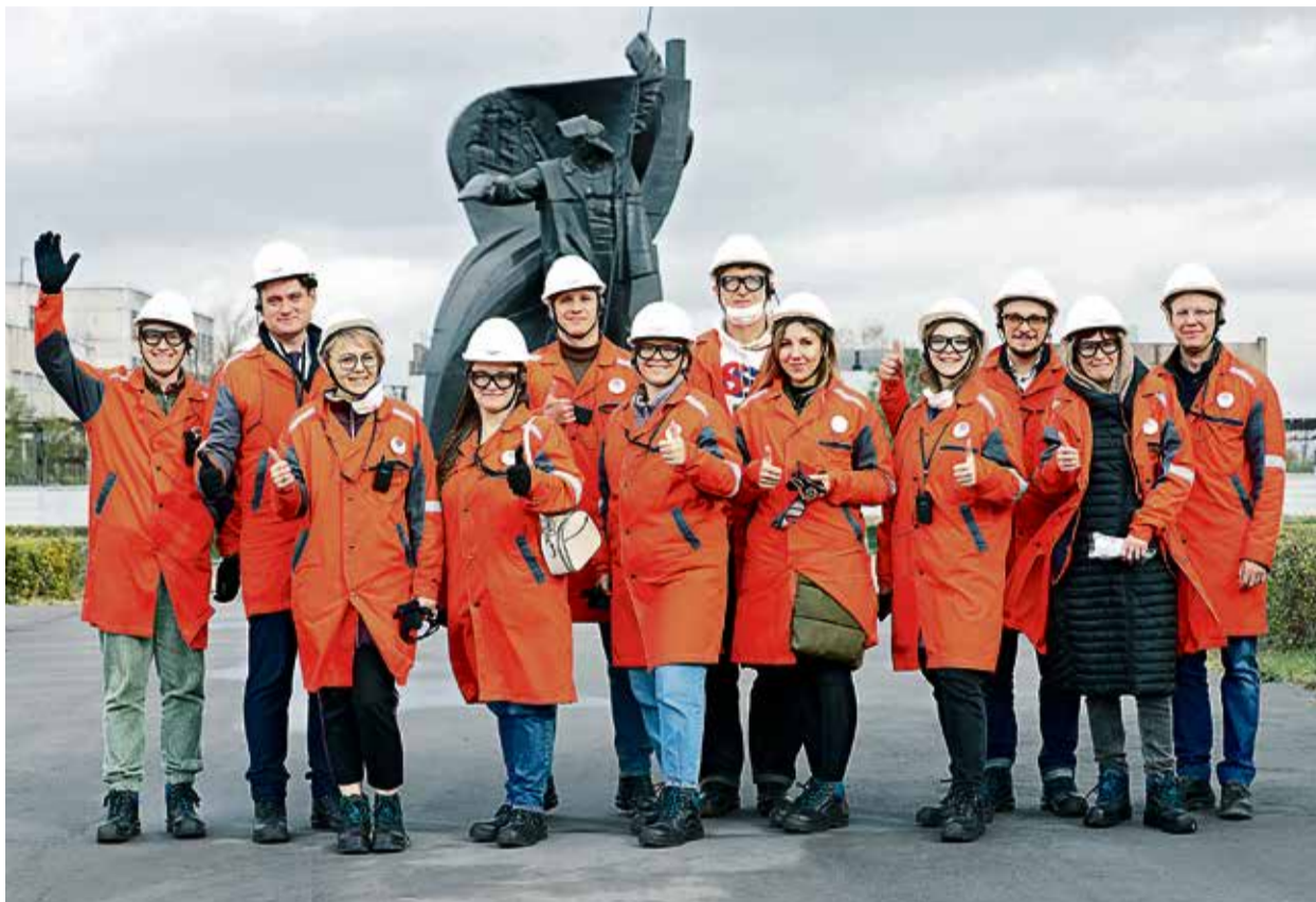
▲ Профессиональным туроператорам на комбинате понравилось, а значит, у проекта есть будущее

Предлагаемые маршруты уже оценили представители региональной команды