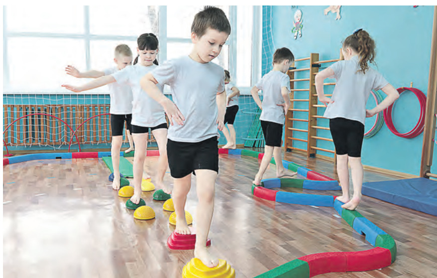
Пройти по специальным дорожкам и удержать равновесие – это не так-то просто