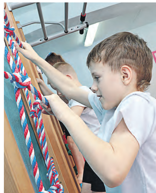
Скалолазание – тоже кинезиологическое упражнение

Марина Валгуснова