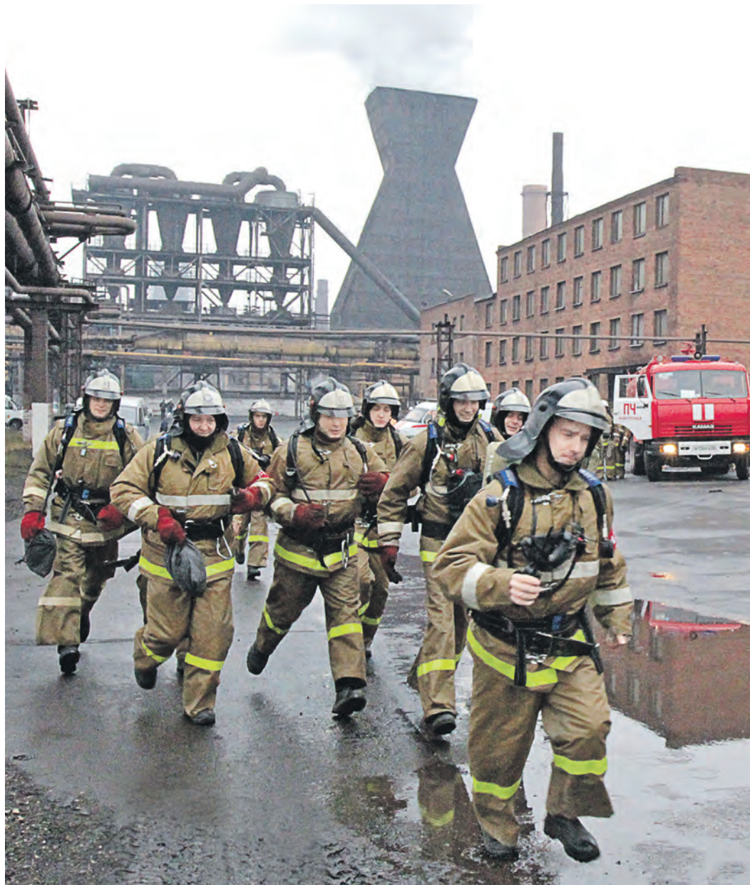
На развертывание подразделения в боевое состояние сегодня требуется всего несколько минут

Двухэтажное здание пожарной части на три выезда построили в 1951 году в непосредственной близости от взрывопожароопасного коксохимического производства и шамотного цеха. Рядом с пожарной частью было построено двухэтажное общежитие, в котором жили пожарные с