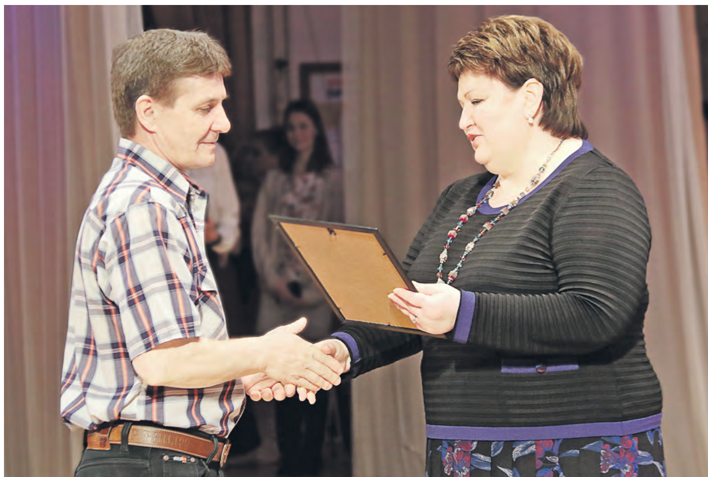
Награды от имени региональной власти вручала вице-губернатор – заместитель председателя правительства области Наталья Левинсон

Во Дворце культуры металлургов состоялся праздничный вечер в честь 73-й годовщины со дня рождения Новотроицка, который получил статус города 13 апреля.