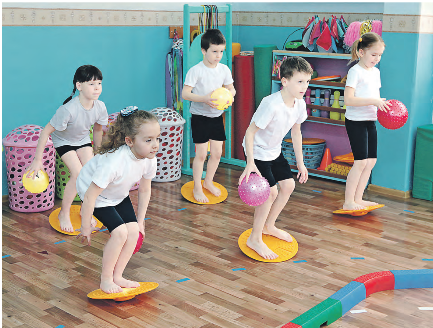
Занятия в спортивном зале на балансирующих тренажерах: ребята следят за равновесием и мячом одновременно

В городе идет реализация проектов-победителей грантового конкурса программы «Здоровый ребенок». В одном из них акцент сделан на использовании кинезиологических упражнений для развития речи воспитанников.