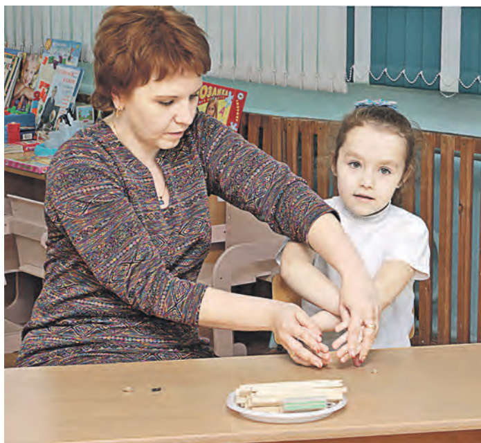
Вместе с мамой можно решить самые сложные задачи!

– Благодаря Металлоинвесту у нас появилась возможность заявить себя в «Здоровом ребенке». Оборудование, приобретенное в рамках гранта, доступно не только участникам проекта, но и всем воспитанникам. Мы видим успешность программы, поэтому будем продолжать!