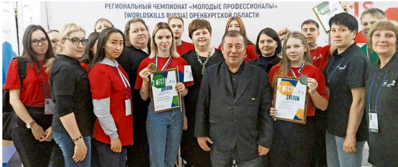
▲ Призовые места — заслуга не только студентов, но и их преподавателей

Впервые в этом году НСТ принял участие в компетенции «Су-