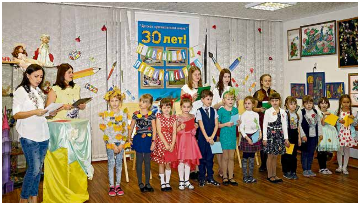
▲ Таинство посвящения в первоклассники педагоги превратили в запоминающийся праздник для новичков

В детской художественной школе состоялась праздничная церемония для первоклассников.