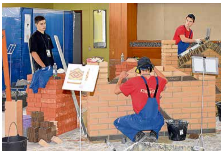
◀ Ребята из НСТ всегда показывают хорошие результаты в компетенции «Кирпичная кладка»

Также для учащихся школ Новотроицка и Орска программа WorldSkills в этом году предусматривала профориентационные мероприятия. Строительный техникум отвечал за мастер-класс «Выкладывание камина», в котором школьники не только наблюдали за процессом работы, но и могли сами попробовать управиться с кельмой и полутёркой.