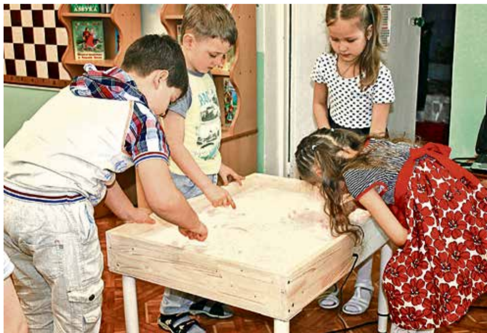
▼ Работа с песком нормализует эмоциональное состояние ребёнка

Проект «Волшебник-песок», который заявили в 2019–2020 году, ориентирован на социально-эмоциональное благополучие ребёнка. Выбор такого акцента не случаен: по итогам прошлого учебного года в детском саду выявлены дети с высокой степенью психоэмоционального напряжения (малыши кусаются, дерутся, отбирают игрушки, не могут наладить контакт со сверстниками, испытывают трудности адаптации в коллективе). Педа-