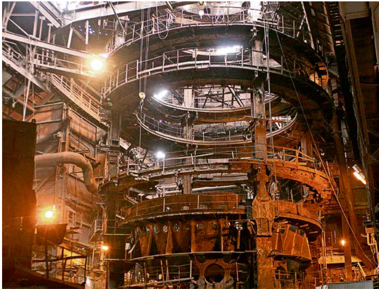
◀ Глубокая реконструкция печей позволит на ближайшие годы отказаться от ремонтов второго разряда