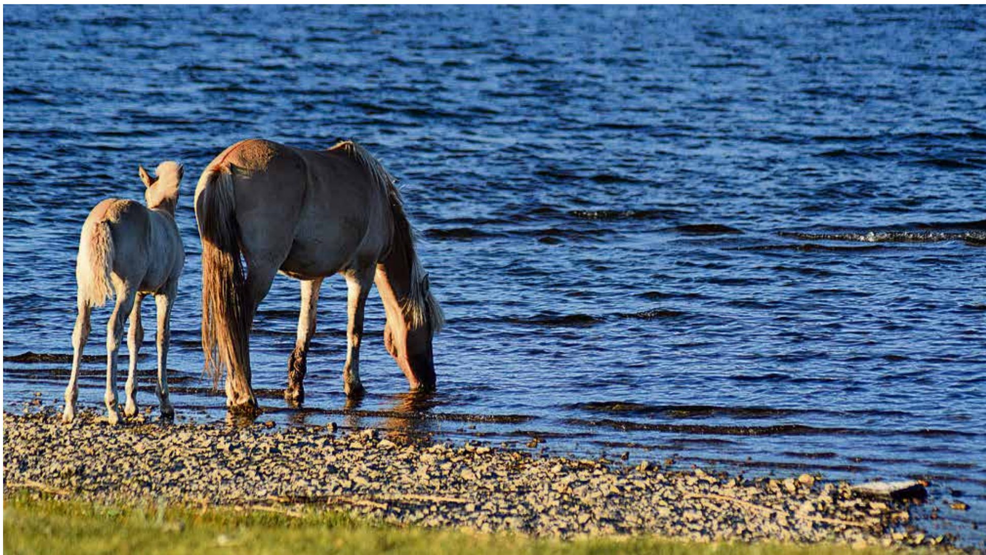
▲ Вадим Морозов. НА ВОДОПОЕ