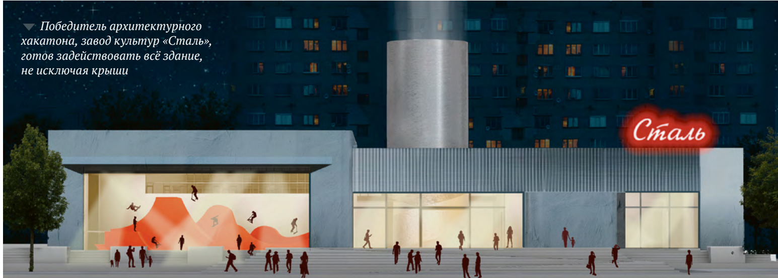
▼ Победитель архитектурного хакатона, завод культур «Сталь», готов задействовать всё здание, не исключая крыши