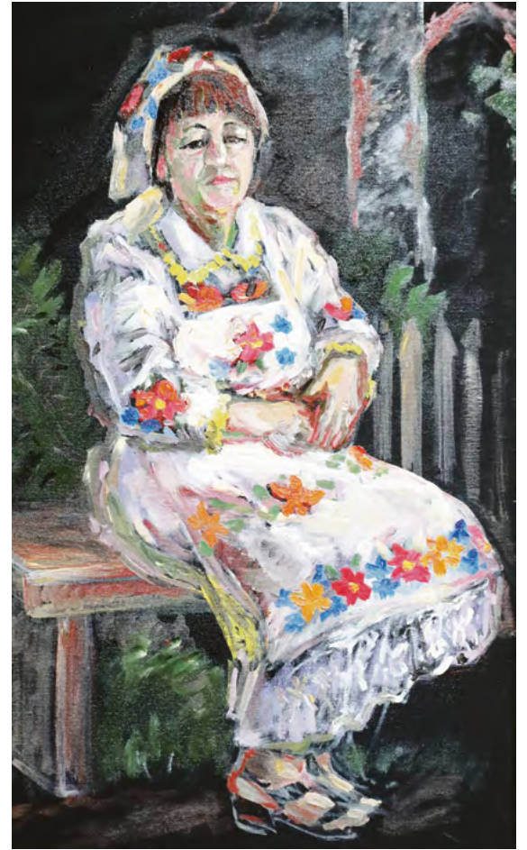
▲ Люди на картинах Натальи словно отделены от тёмного, часто условного фона, и это придаёт их фигурам дополнительный объём