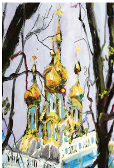
▲ Для художника важно иметь душу ребёнка. Один из способов — взглянуть на мир снизу вверх глазами маленького человека