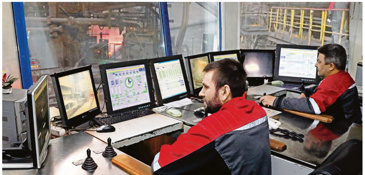
▲ Благодаря усилиям ремонтных служб комбината операторы стана 2800 уверенно отработают год до следующего капитального ремонта