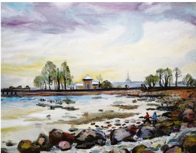
▲ Автор в путешествия берёт мольберт и делится увиденным со зрителями. Даже северо-западные пейзажи у неё полны света

Выставка «Лето Господне» будет открыта до 14 декабря, а следом за ней в малом зале музея откроется ещё одна экспозиция Старостиной, «Калейдоскоп». В него войдут работы в разных жанрах из творческой поездки в Вятскую область. Вход платный или по «Пушкинской карте».