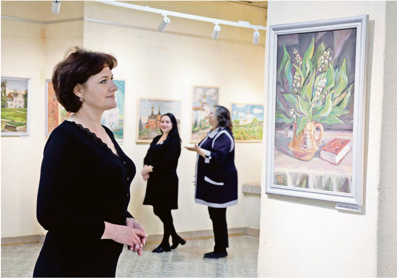
▲ Даже натюрморты у Старостиной с библейскими коннотациями: не каждый художник назовет картину с букетом ландышей «Песнь Давида»