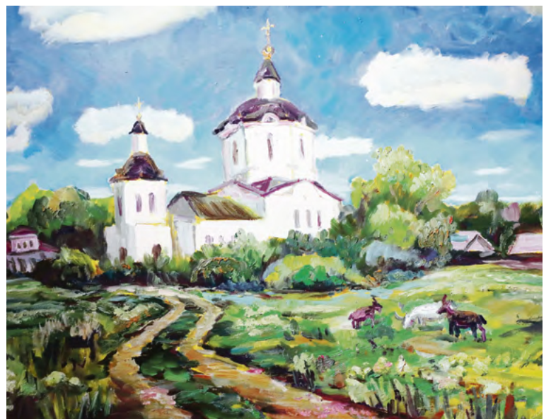
▲ Храмы на взгорке любил писать ещё Левитан. Минувшее с тех пор столетие поменяло страну и ничего не смогло противопоставить традиции