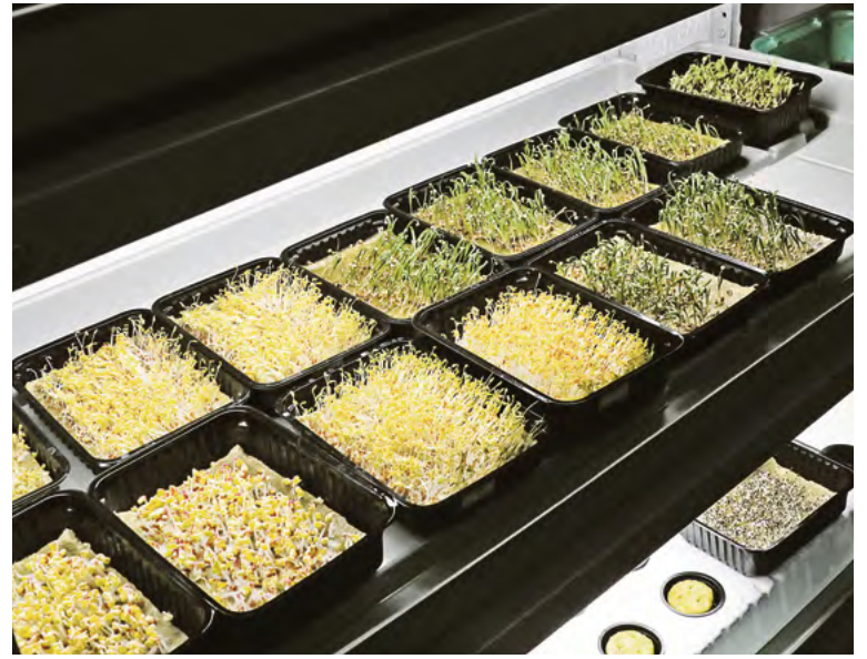
▲ Тот, кто решит выращивать микрозелень, круглый год сможет обеспечивать себя свежими витаминами с квартирной грядки

— Я показываю ребятам, как можно обеспечить себя