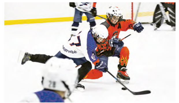
▲ В первый игровой день защита «Стальных орлов» в равных составах не оставила шансов сверстникам из «Сарматов»

— Выход на вторую строчку в турнирной таблице даёт нам бонус — дополнительные игры в «родных» стенах, — рассказывает тренер «Стальных орлов». — Поэтому четыре следующих игры мы проведём дома и лишь две — на выезде. Так что приходите за нас болеть 30 ноября и 1 декабря на играх с «Металлургом» и 14-15 декабря — вновь с «Сарматами».