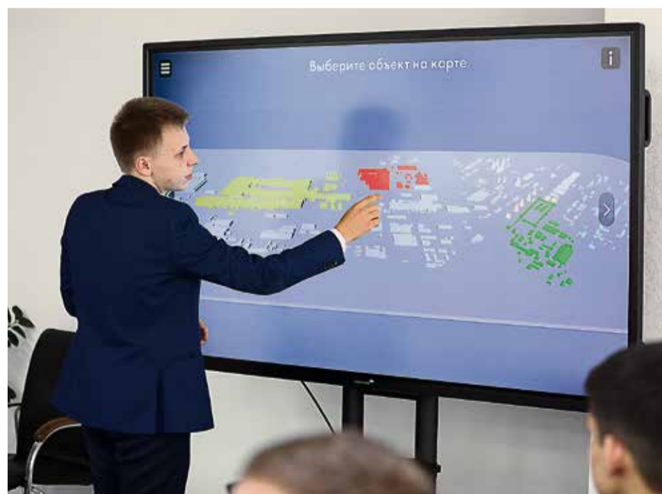
▲ Авторы планируют интегрировать интерактивную карту Уральской Стали с сайтом предприятия

— Нам осталось проработать конкретику каждого цеха, добавить обучающие материалы. Мы