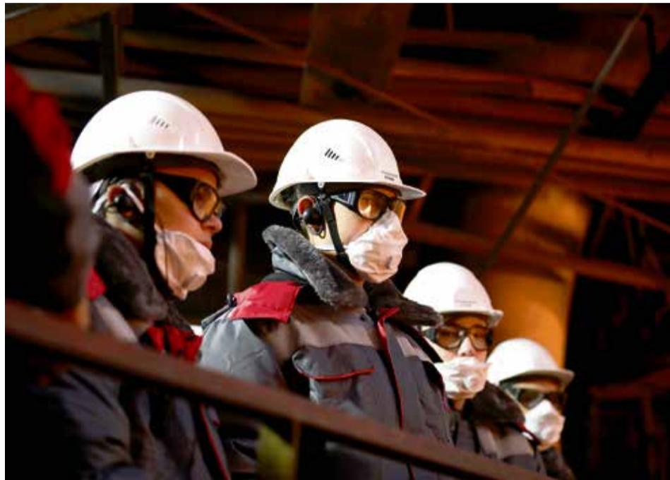
▲ Каждая экскурсия рождает огонь в глазах очередного новичка. И неудивительно: разливка чугуна — зрелище незабываемое

тельный подход к охране труда и соблюдению техники безопасности. Поделились историями успеха и обсудили с молодёжью