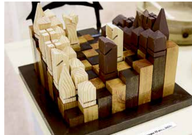
▲ Необычные шахматы от воспитанников интерната: хочешь — играй, а хочешь — дивись фантазии автора