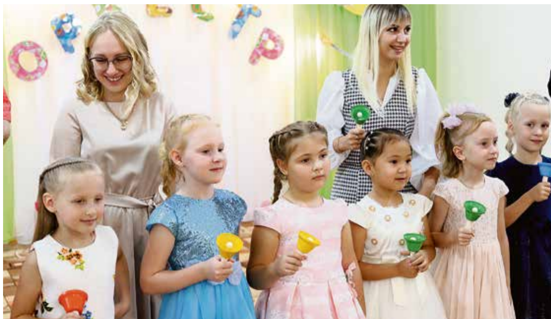
▲ Мама порой стеснялись больше детей: игра в оркестре улучшила и их навыки выступления перед публикой

— С помощью грантовых проектов мы всегда решаем несколько задач. В этот раз, помимо укрепления эмоциональной связи в семье, мы знакомим детей с музыкальными