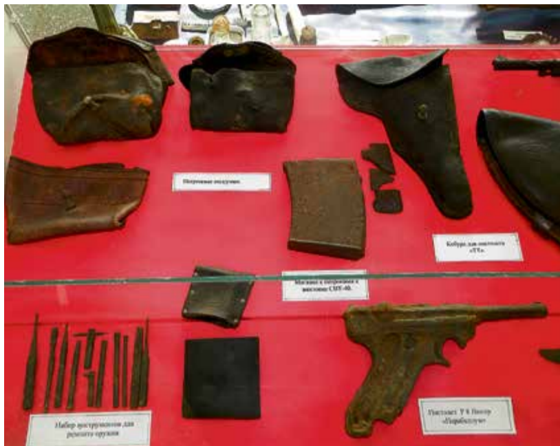
▲ Школьный музей поискового клуба «Уралец» — вечное напоминание живущим о том, что никто не забыт и ничто не забыто