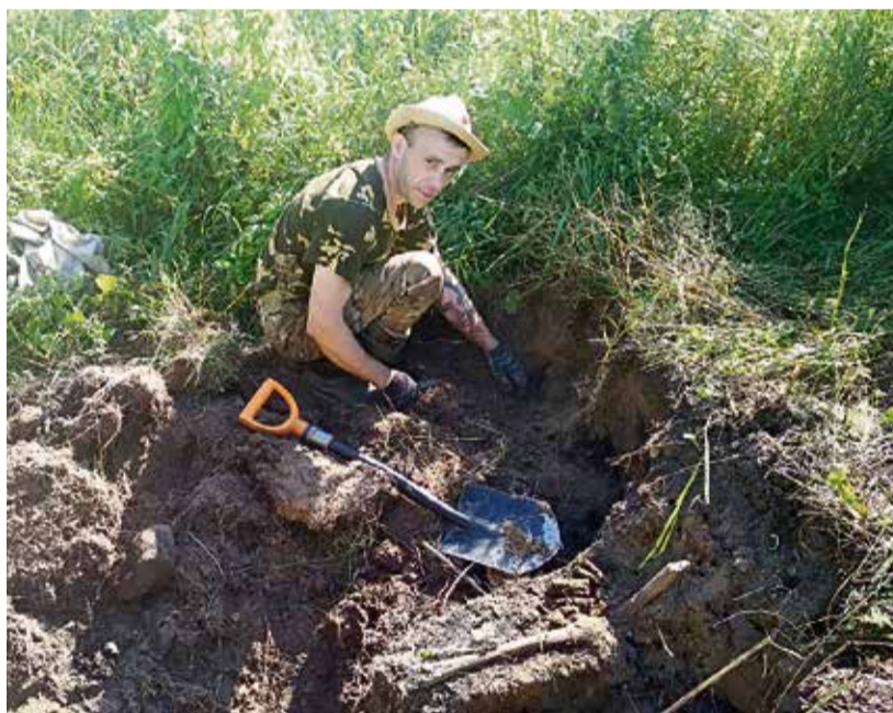
▲ В Новгородской области ещё хватает мест, где лишь тонкий слой дёрна отделяет сегодняшнюю историю от событий Великой Отечественной