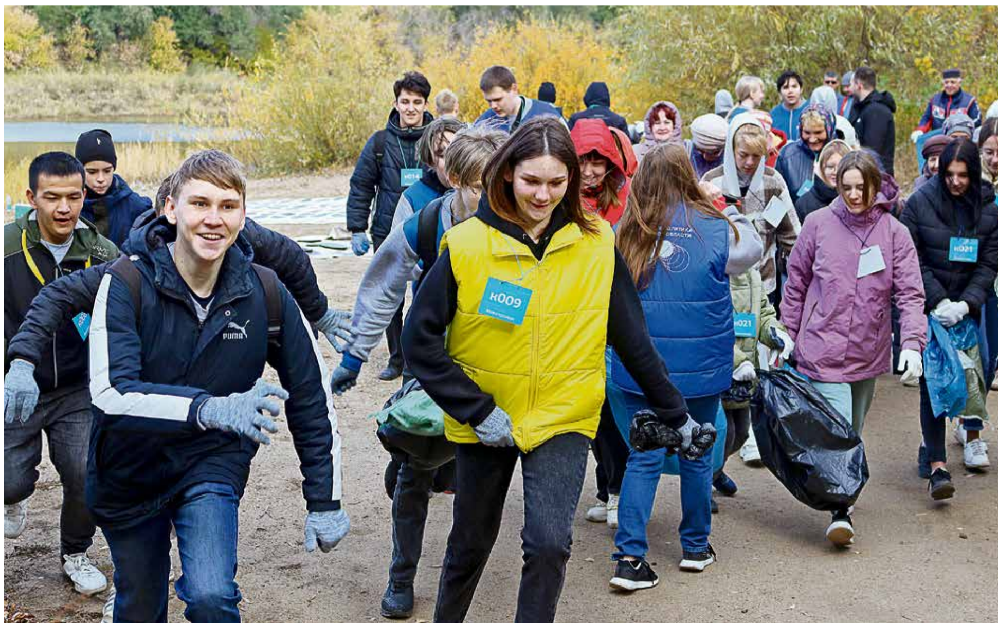
▲ На старте каждая команда могла выбрать себе темп от бега до неспешной прогулки. В итоге молодость уступила опыту