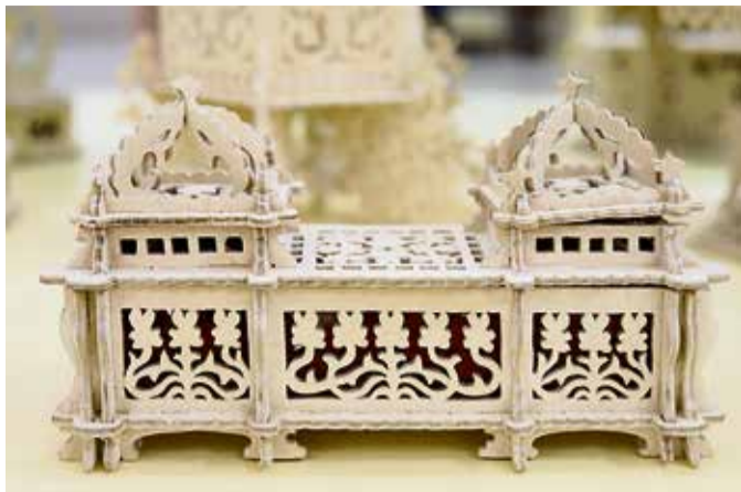
▲ Вам шкатулку или дворец? А пусть будет шкатулка-дворец, которая вместит все ваши драгоценности!