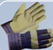
Перчатки спилковые комбинированные