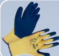
Перчатки полиэфирные с латексным покрытием