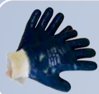
Перчатки с нитриловым покрытием

2 СИЗ РУК ДЛЯ ЗАЩИТЫ ОТ ХИМИЧЕСКИХ ФАКТОРОВ — НЕФТЕПРОДУКТОВ, МАСЕЛ И ЖИРОВ, РАСТВОРОВ КИСЛОТ И ЩЕЛОЧЕЙ