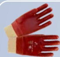
Перчатки с ПВХ-покрытием