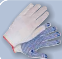
Перчатки хлопчатобумажные с точечным покрытием

1 СИЗ РУК ДЛЯ ЗАЩИТЫ ОТ МЕХАНИЧЕСКИХ ВОЗДЕЙСТВИЙ — ИСТИРАНИЯ, ПРОКОЛОВ И ПОРЕЗОВ, ВИБРАЦИИ