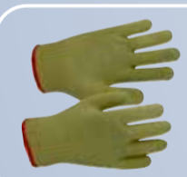
Перчатки арамидные термостойкие