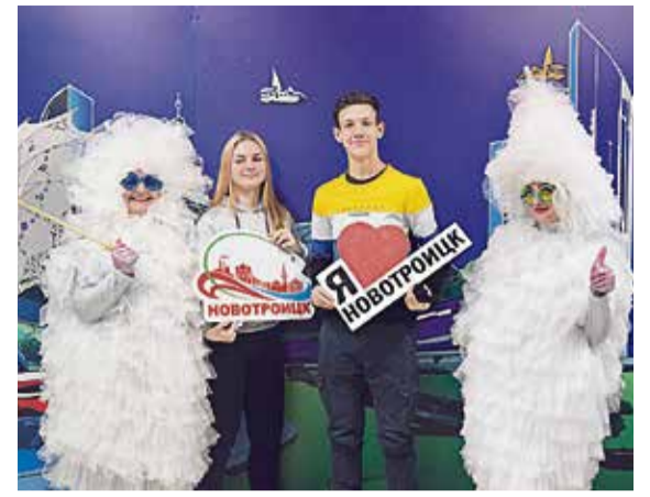
▲ Татьяна день, как ещё часто называют этот неформальный праздник, оставил после себя много ярких впечатлений и необычных снимков

Яркое оформление, зажигательные танцевальные хиты, весёлые подвижные конкурсы с памятными подарками — таким запомнился гостям праздника День студента #ЗачётныйНовотроицк! Гостей события порадовали также яркие музыкальные номера воспитанников продюсерского центра «Нота» и оренбургской региональной общественной организации содействия развитию спорта «Ледяное кружево».