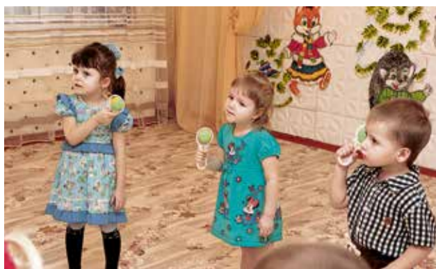
▲ Музыкальные занятия — один из компонентов проекта «Умка»