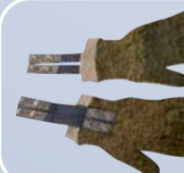
Перчатки с токопроводящей нитью

Для эффективного использования защитных свойств СИЗ рук, а также в целях безопасного выполнения работ необходимо: