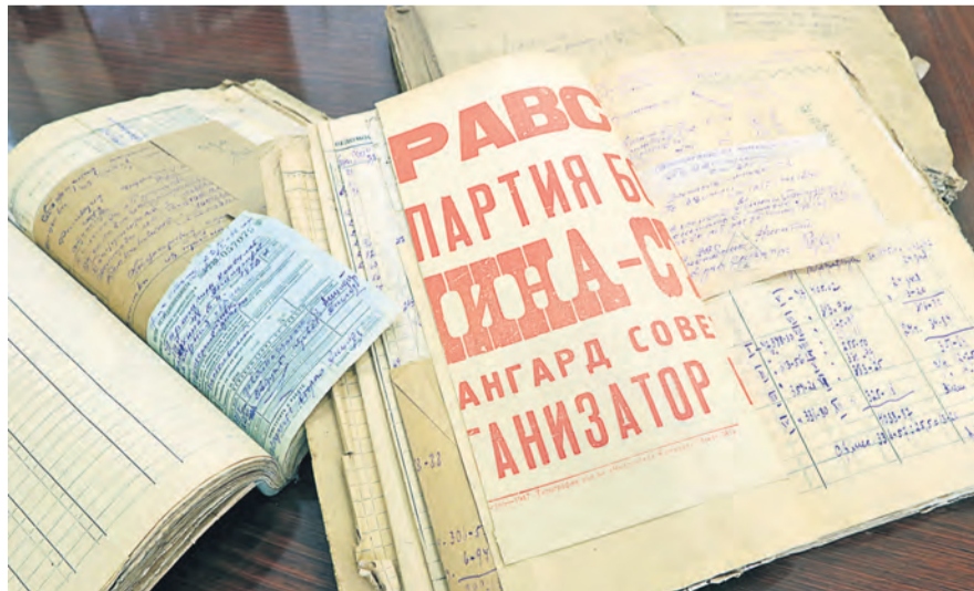
Протоколы заседаний часто велись на обратной стороне агитационных плакатов – в послевоенной стране сказывался дефицит бумаги

«С 1937 по 1953 год удельный вес продовольственных товаров в общем объеме товарооборота уменьшился с 63 до 55 процентов, а непродовольственных товаров, соответственно, увеличился с 37 до 45 процентов, говорится в секретной докладной записке председателю совета Министров СССР Григорию Маленкову об изменении государственных розничных цен на продовольственные и промышленные товары по сравнению с довоенным уровнем. На протяжении военных лет и в 1946-1947 годах повышение цен продолжалось. В 1946-м были повышены цены на основные продовольственные товары. Средний уровень цен к концу 1947 года превышал уровень цен 1937 года в 3,5 раза. С момента отмены карточной системы 16 декабря 1947 года по 1 апреля 1953-го цены снижались шесть раз. В настоящее время уровень цен превышает цены 1937 года на 59 процентов».