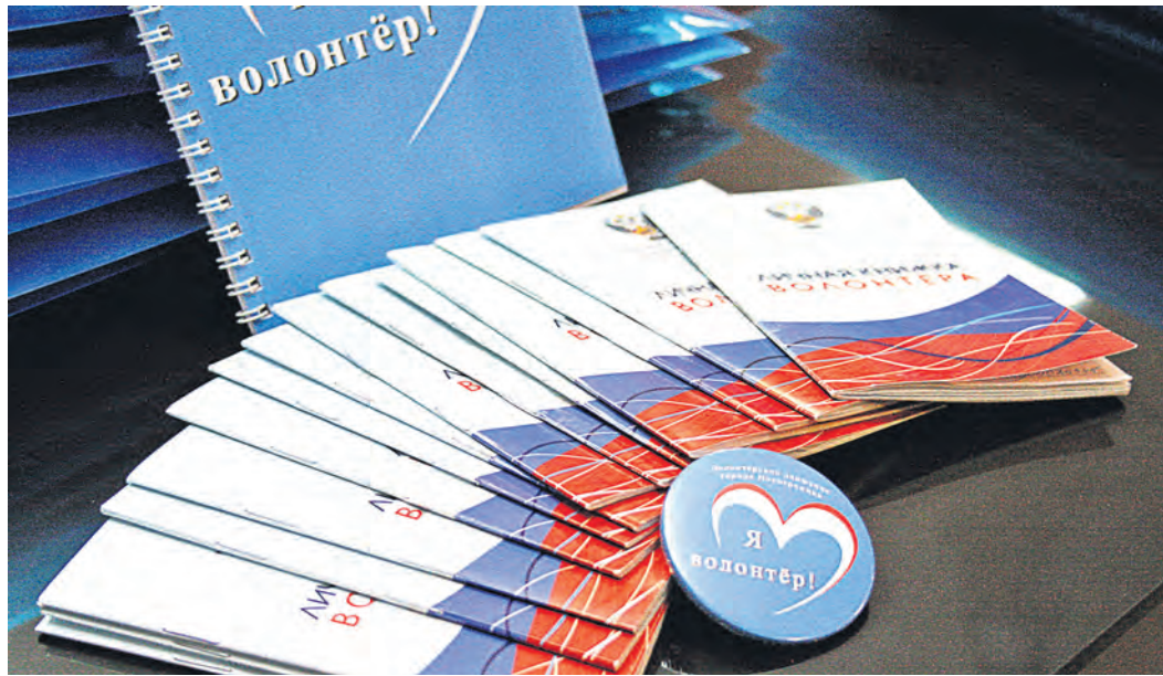
Молодежные волонтерские организации играют важную роль в решении социальных проблем города

– выписка из Единого государственного реестра юридических лиц со сведениями о заявителе, выданная не ранее чем за 30 календарных дней до подачи конкурсной документации;