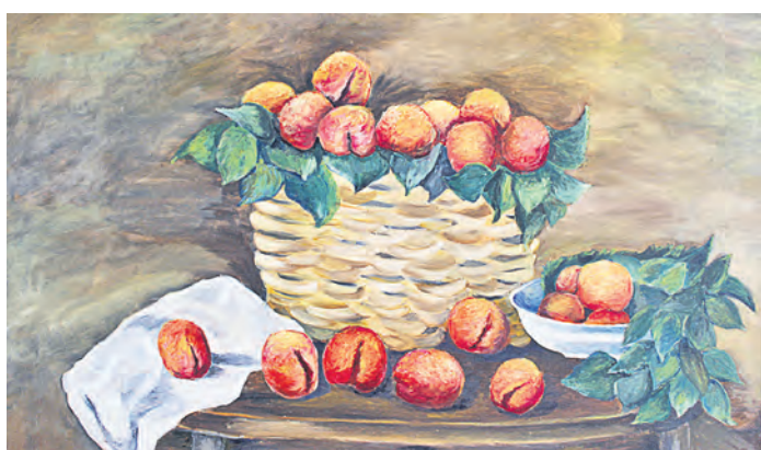
Аппетитные персики дразнят предвкушением жаркого лета