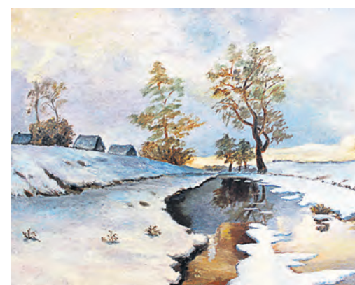
Когда весна придет, не знаем. Но очень ждем ее бурного натиска на зиму