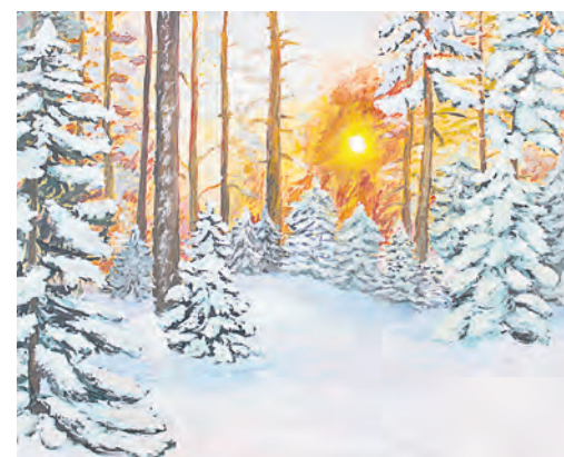
Совсем скоро мы расстанемся с этой красотой до будущей зимы