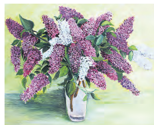
Сирень – излюбленная натура для каждого живописца, работающего в жанре натюрморта