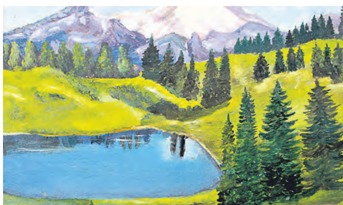
Прав Высоцкий: лучше гор могут быть только горы, на которых еще не бывал