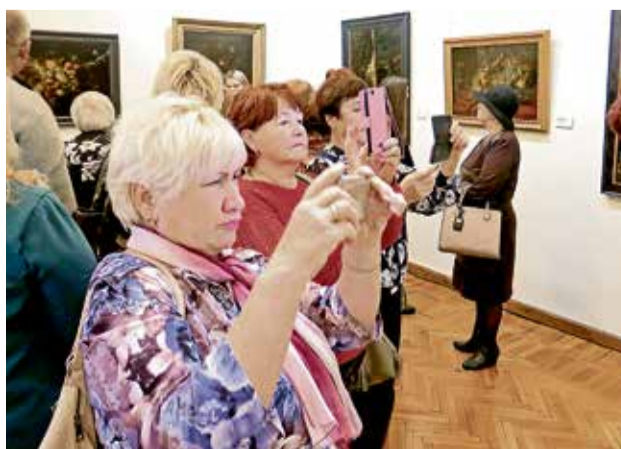
▲ Гости старались запечатлеть картины на камеры

ще! Я очень рада, что благодаря культурной платформе АРТ-ОКНО у нас на периферии появилась возможность увидеть такие шедевры!