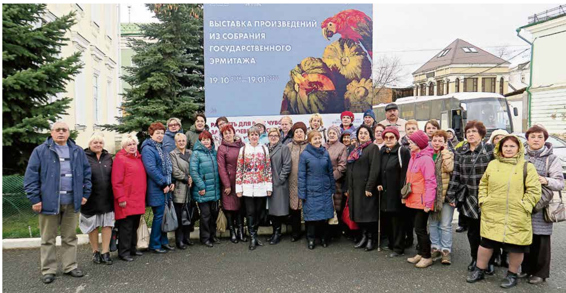
▲ 42 ветерана Уральской Стали приехали на выставку