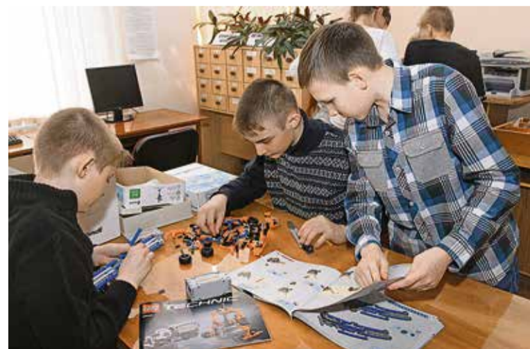
▲ Конструкторы LEGO способны заинтересовать и совсем юных конструкторов, и школьников постарше