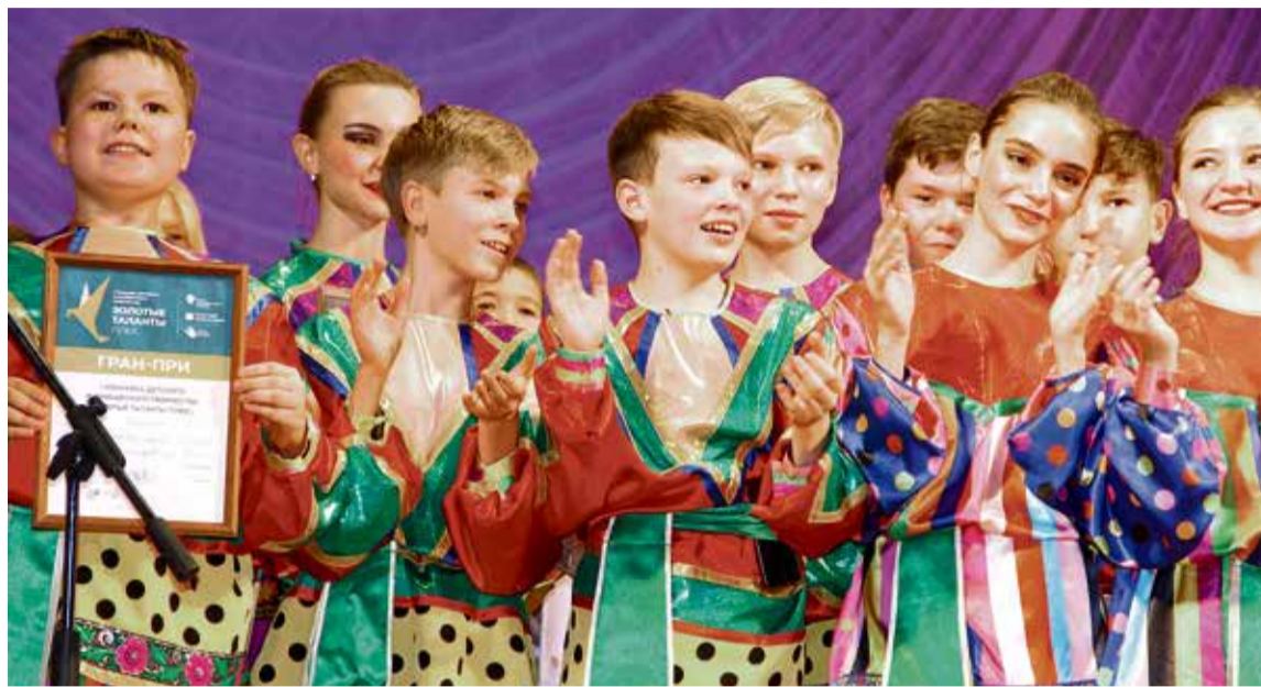
▲ Номинация «Хореография» оказалась самой сложной для жюри — настолько высок был исполнительский уровень всех ансамблей — но победитель был выбран единогласно: «Молодость»

Александр Проскуровский