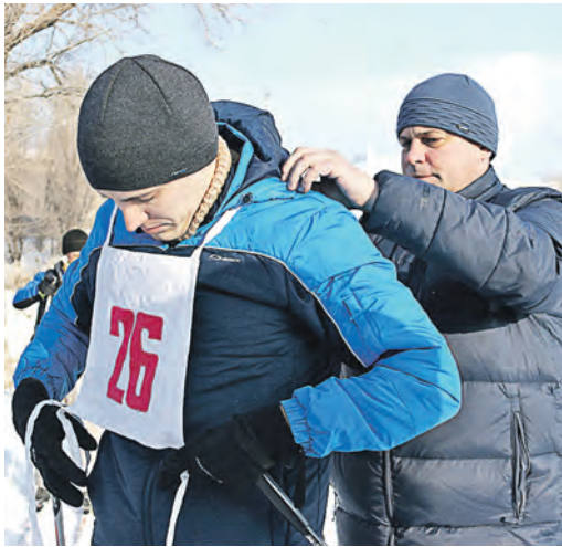
Физорг для спортсмена – второй отец

В прошлую субботу в лесополосе за улицей Фрунзе прошла лыжная эстафета спартакиады-2018 Уральской Стали. На старт вышли двадцать пять команд.