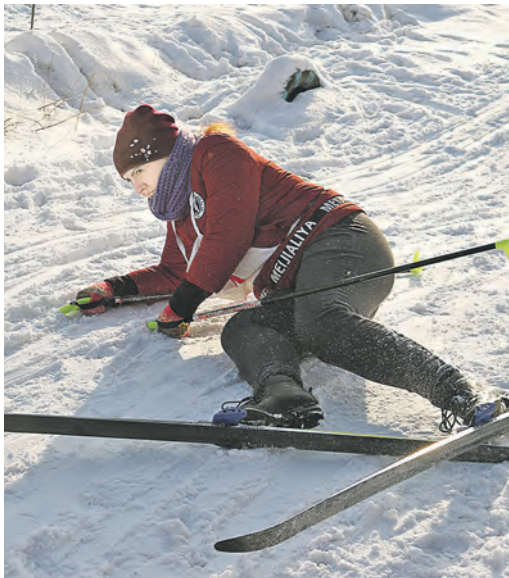
Когда все силы отданы борьбе...