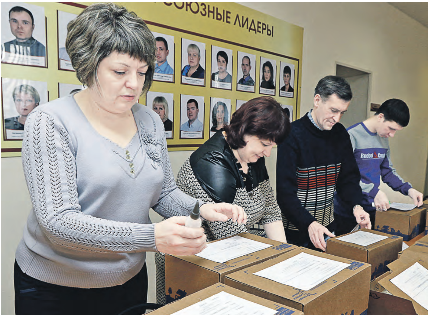
Все посылки от профкома предприятия, где трудятся родители новотройчан, найдут своих адресатов, став приятным сюрпризом с малой родины

В преддверии Дня защитника Отечества в профсоюзном комитете Уральской Стали собрали посылки военнослужащим, чьи отцы и матери трудятся на комбинате.