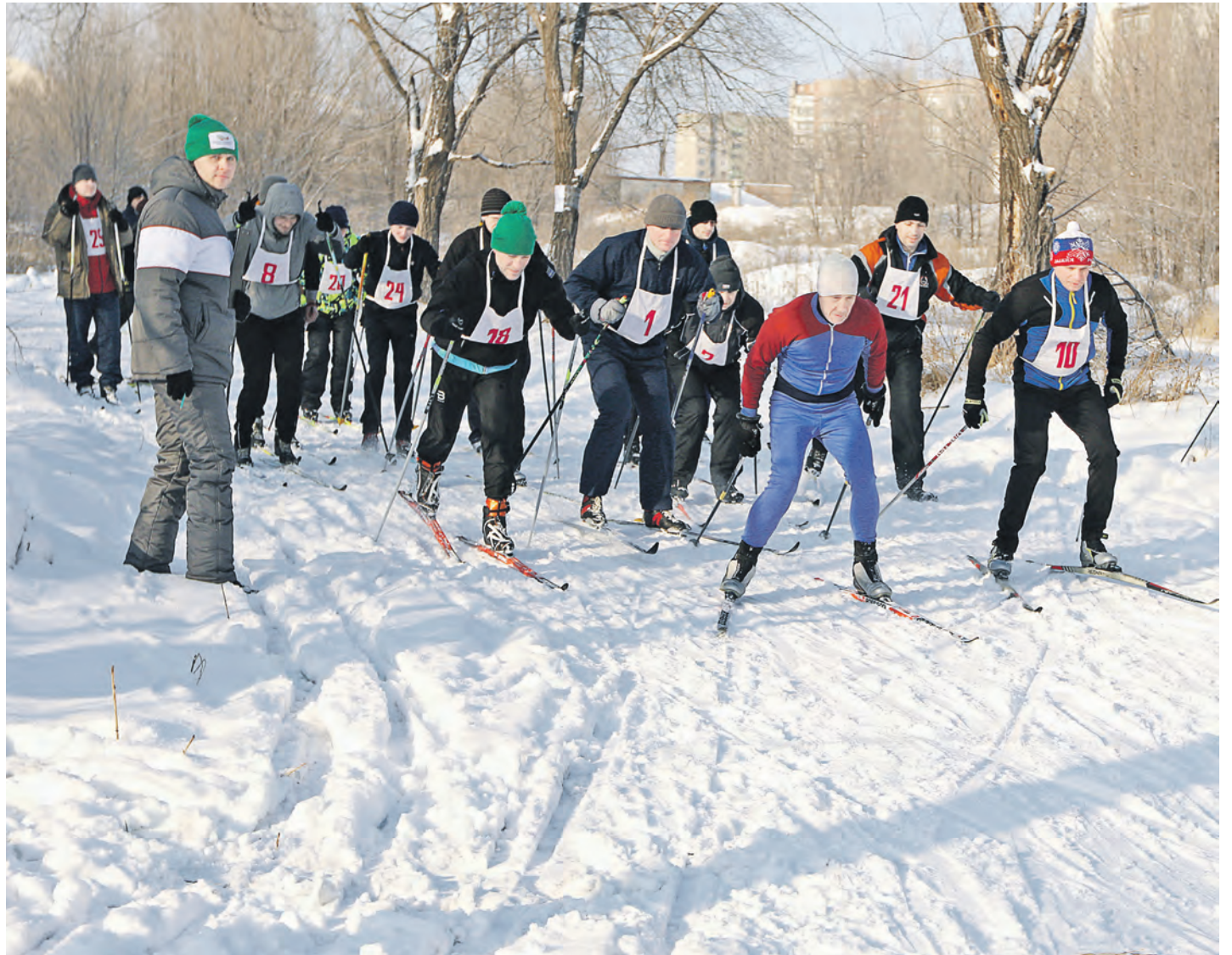
Мужской масс-старт проходит по одинаковой тактической схеме: захватить лидерство с первых секунд гонки

К рещенские морозы наконец отпустили наши щеки и носы. Трасса за лицеем порадовала хорошей укатанностью: несмотря на выпавший накануне снежок, лыжи отлично скользили даже без смазки.