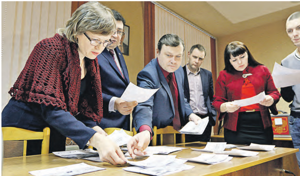
Вчера ящики с предложениями были вскрыты комиссией, теперь предстоит анализ инициатив горожан

Принять участие в судьбе города мог каждый. Новотроичане уже высказали свои предпочтения в отношении Молодежной аллеи, сквера вокруг кинотеатра «Экран» и отдельных территорий Западного. Активно