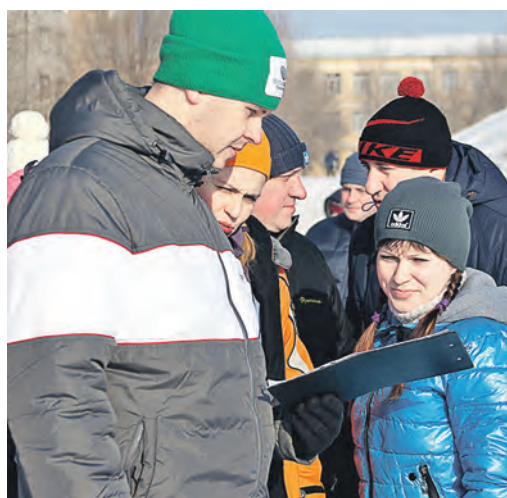
Скажи, судья, какое у нас место