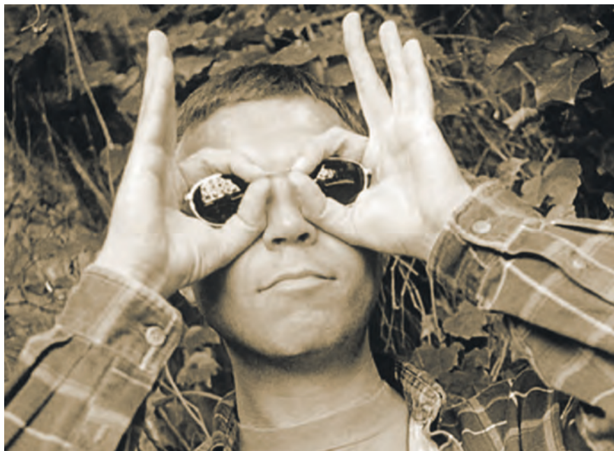
Пелевин в жизни едва ли не больший мистификатор, чем в творчестве: он избегает фотографирования, а накануне выхода последней книги запустил слух о собственной смерти

В НОЯБРЕ 2017 ПИСАТЕЛЬ ВИКТОР ПЕЛЕВИН ВСТРЕТИЛ СВОЕ 55-ЛЕТИЕ. В ЮБИЛЕЙ ЖИВОГО КЛАССИКА ПРЕССА ЗАПЕСТРЕЛА СТАТЬЯМИ О ЕГО БИОГРАФИИ И ТВОРЧЕСТВЕ, А САМ ПЕЛЕВИН ОТМЕТИЛСЯ ВЫПУСКОМ НОВОГО РОМАНА.