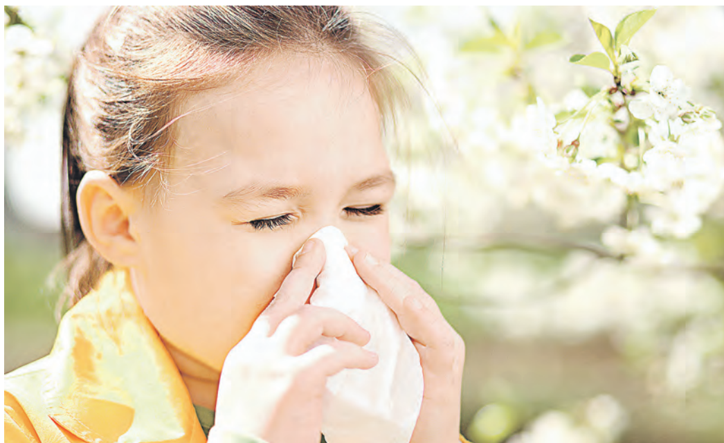
Аллергический ринит, если его не лечить и не принимать мер профилактики, способен испортить каникулы

Стоит отметить, что главный нелекарственный помощник в борьбе с аллергией – это вода во всех ее состояниях. Не только холодные компрессы, влажная уборка по дому, но и увлажнение воздуха в помещении – прекрасное средство как профилактики, так и облегчения течения аллергических реакций.