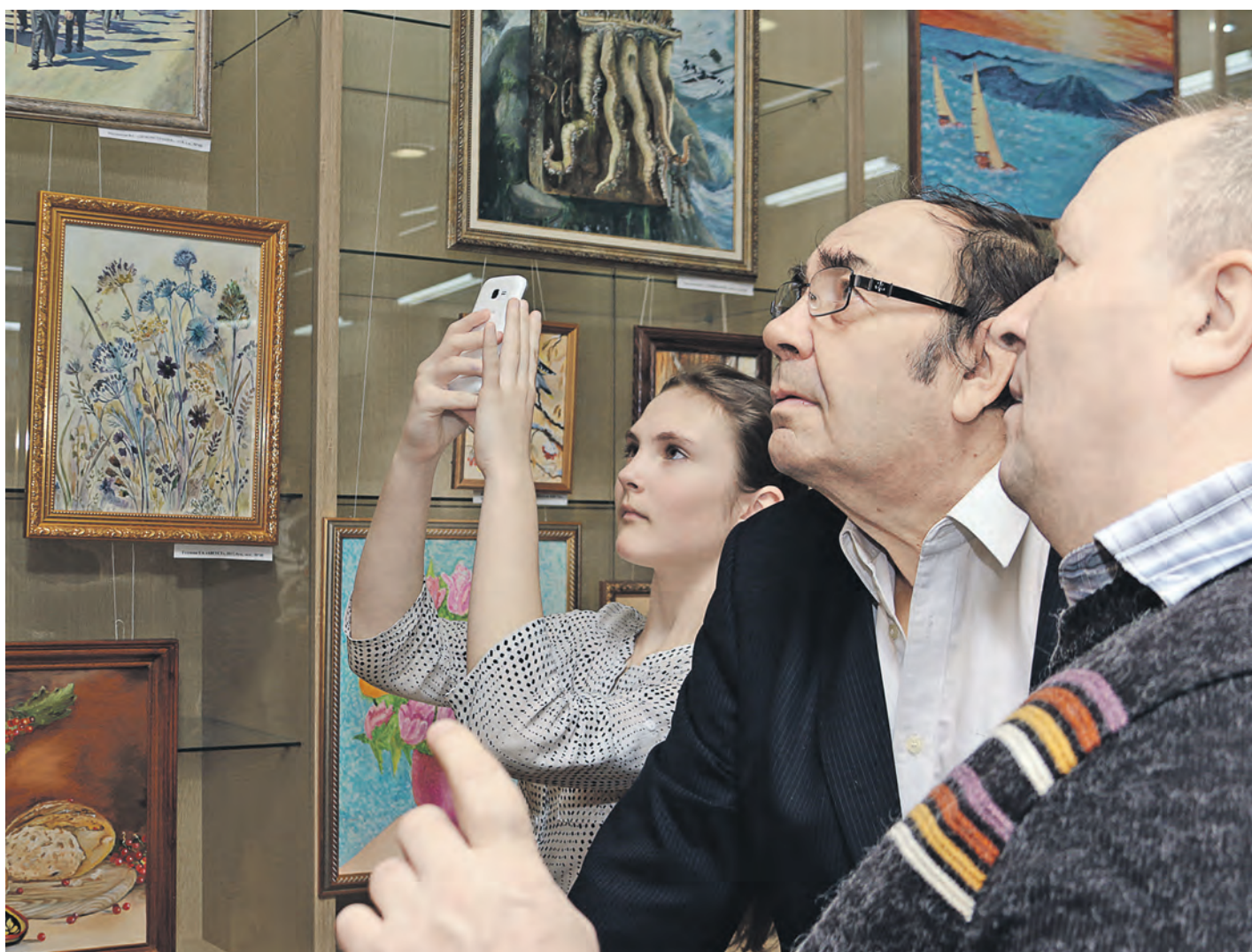
В городской весенней выставке участвуют художники разных поколений. То же можно сказать и о зрителях

Почти 40 местных художников разных поколений собрала в музейно-выставочном комплексе традиционная коллективная выставка живописцев и графиков, посвященная Дню рождения города. Экспозиция называлась «Яркие краски звонкой весны».