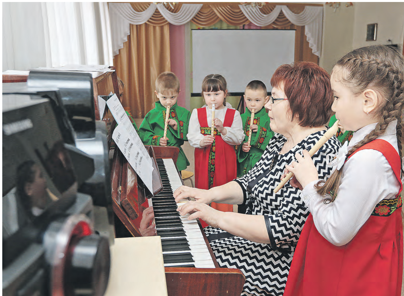
В рамках проекта в детском саду был организован духовой ансамбль «Ладушки»

В детском саду №25 педагоги нестандартно подошли к решению проблем заболеваемости малышей. В качестве профилактического средства от ОРЗ они выбрали... дудки.