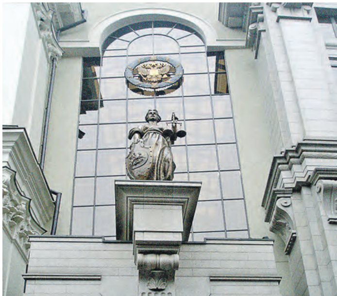
Многолетние мятарства собственницы частного дома закончились только в Верховном суде России

Собственница не выполнила предписания правил землепользования и застройки. А именно – на ее участке возведен капитальный объект без разрешения на строительство, только после чего она обратилась в администрацию и попросила выдать ей разрешение на строительство. В выдаче разрешения чиновники отказали, заметив, что «не предусмотрена выдача разрешений на строительство на уже возведенные объекты капитального строительства». Ей также сообщили, что материалы «по факту самовольного строительства» они отправили в управление муниципального контроля администрации для принятия к ней административных мер.