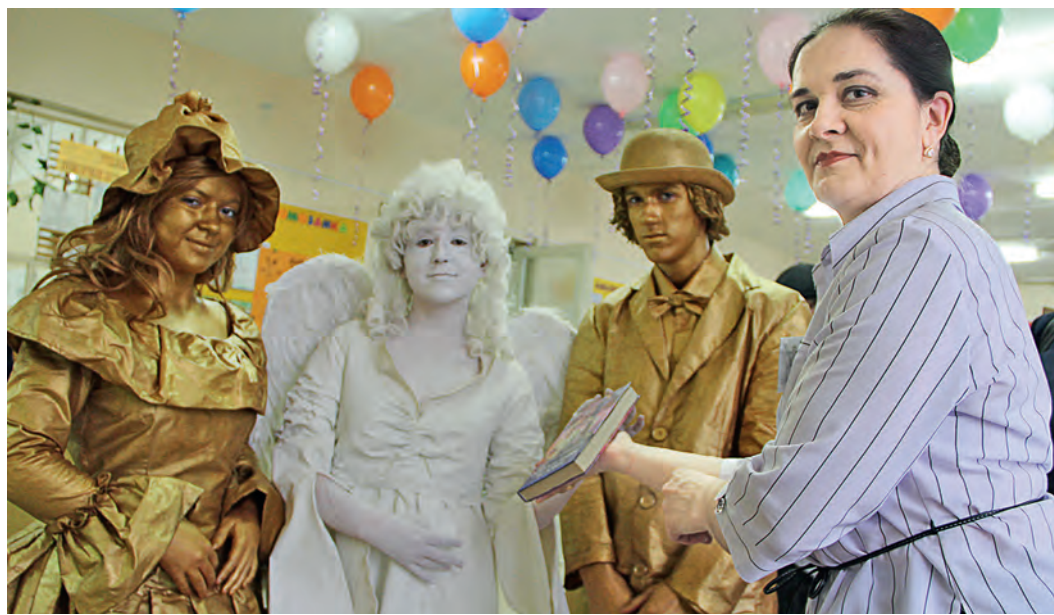
Фото с живой скульптурой – это эффектно! Театры, подобные «Коломбине», не в каждом мегаполисе встретишь

Поднявшись на второй этаж, участники «Библионочи» убедились: чудес здесь не меньше! Вот раритетные издания. Мы с чувством гордости и трепета прикасались (в перчатках!) к Библии, прижизненным произведениям Льва Толстого «Отец Сергей», «Тихон и Маланья», рассказам для детей, к первому изданию «Истории государства Российского» с дарственной надписью автора императору Александру Павловичу и к другим