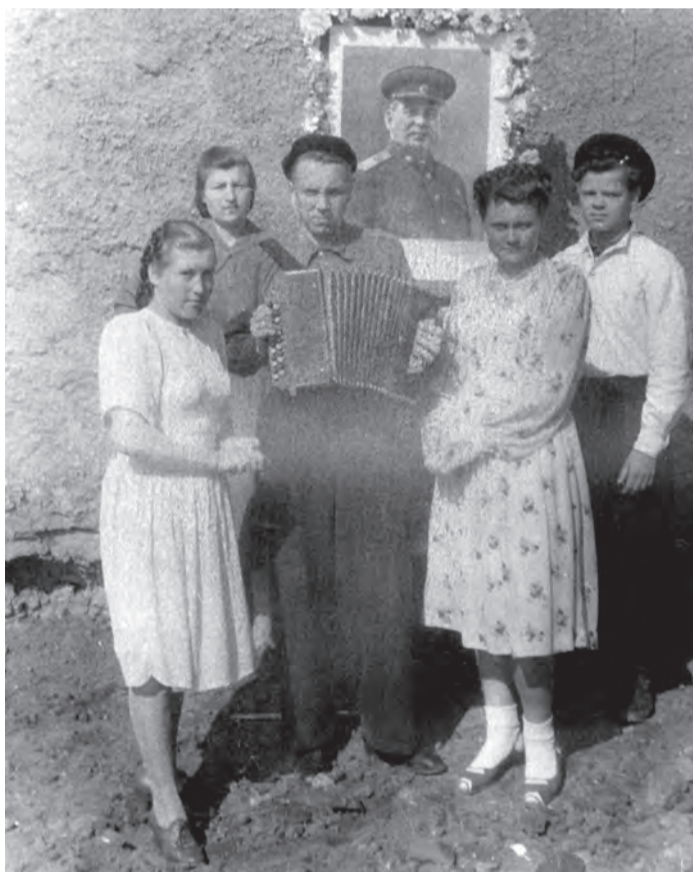
Первомай в Новотроицке. 1951 год

Ели один раз в день, но продержались так до весны. Ранней весной стали копать мороженую картошку, похожую на застывший крахмал. Бабушка пекла из нее оладьи, смешав с травой ширрицей, которая росла повсеместно, как сорняк. Так, во всяком случае, мы думали о ней тогда. На самом деле она очень ценится ботаниками за питательность.