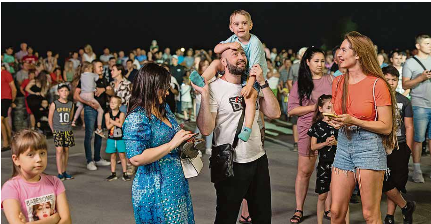
◀ Площадка у центральной проходной стала центром праздника: сюда приходили целыми семьями, чтобы разделить радость с коллегами, родными и близкими