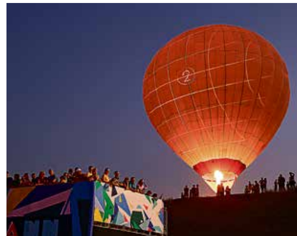
▲ Самый большой гость — воздушный шар, который стал ещё и огромным экраном для видеороликов