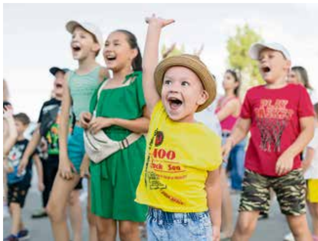
▲ Танцы, шоу мыльных пузырей, конкурсы: ведущие сумели развлечь всех, вплоть до самых юных участников праздника