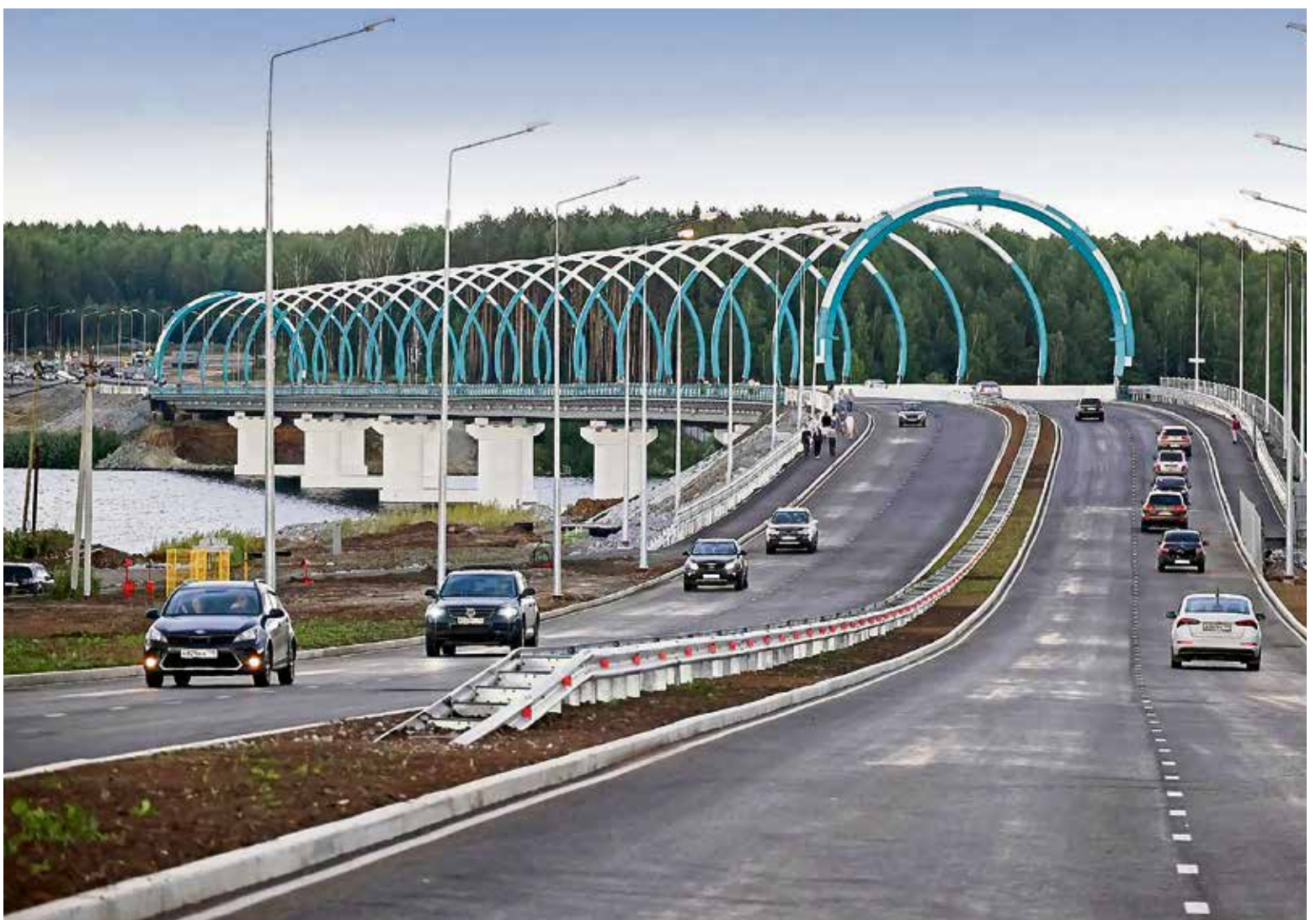
▲ Ажурные конструкции моста и основные несущие элементы сделаны из прочнейшего конструкционного металла Уральской Стали