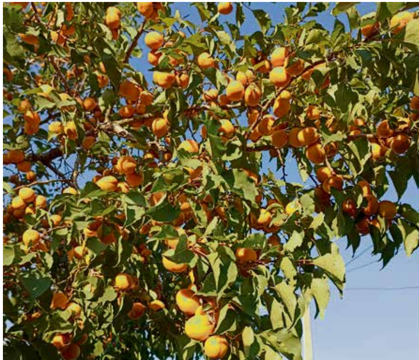
▲ В наших краях абрикосы редко приносят крупные плоды, что не мешает популярности культуры у садоводов

— В трёхлитровую стерилизованную банку укладываем 20–25 абрикосов, один кружок лимона и два кружочка апельсина. Заливаем кипятком и даём настояться 10 минут. В воду добавляем один стакан сахара, кипятим и снова заливаем в банку. Закатываем крышкой.