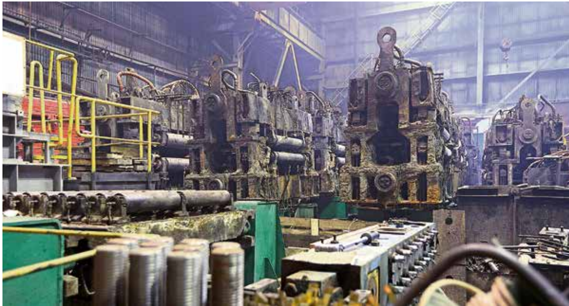
▲ Эти секции МНЛЗ закончили свою непростую работу. Теперь их ждёт восстановление в ремонтных подразделениях комбината

Довольно масштабное обновление и на второй гибкой модульной печи. Мы демонтировали все