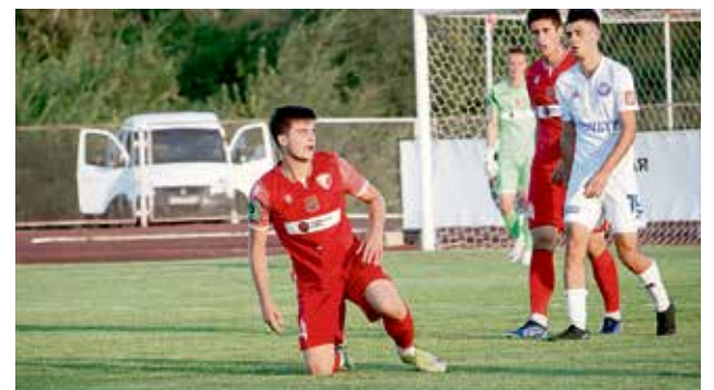
▲ «НОСТА» способна бороться за места вверху таблицы, но для этого нужно больше забивать

В итоге «НОСТА» после пяти туров на восьмом месте с шестью очками. Сегодня команда может вернуться в группу лидеров, если обыграет на своём поле «Торпедо» из Миасса. Начало игры в 18 часов.