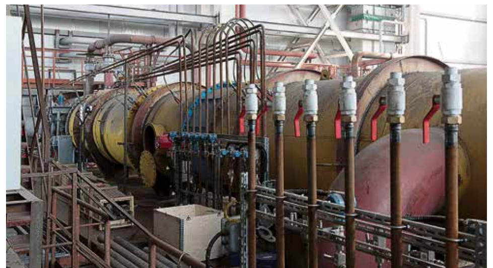
▲ ТЭЦ — сложнейший организм, где за работой энергетических установок следят тысячи датчиков. Каждый элемент перед отопительным сезоном проверят специалисты

Впрочем, и на этом ремонты в ТЭЦ не остановят. Начало отопительного сезона близко, и к середине октября надо завершить текущие и капитальные ремонты основного оборудования котельного и тур-