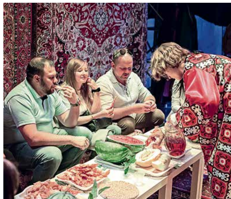
▲ Гости праздника смогли окунуться в атмосферу Узбекистана

В соответствии с Указом Президента Верховного Совета СССР от 6 сентября 1955 года День строителя празднуют во второе воскресенье августа.