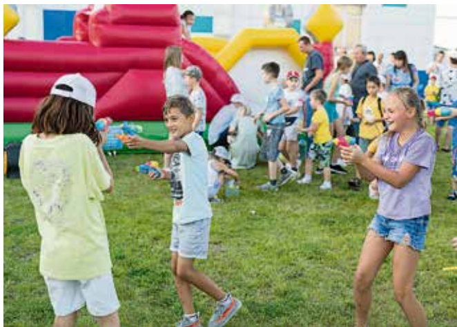
▲ Бои на водяных пистолетах — лишь одна из десятка забав, которые организаторы подготовили для детей