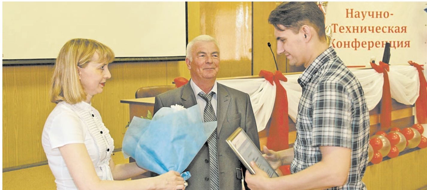
НТК — отличная возможность для молодых не только попробовать себя в исследовательской деятельности, но и принести пользу родному комбинату