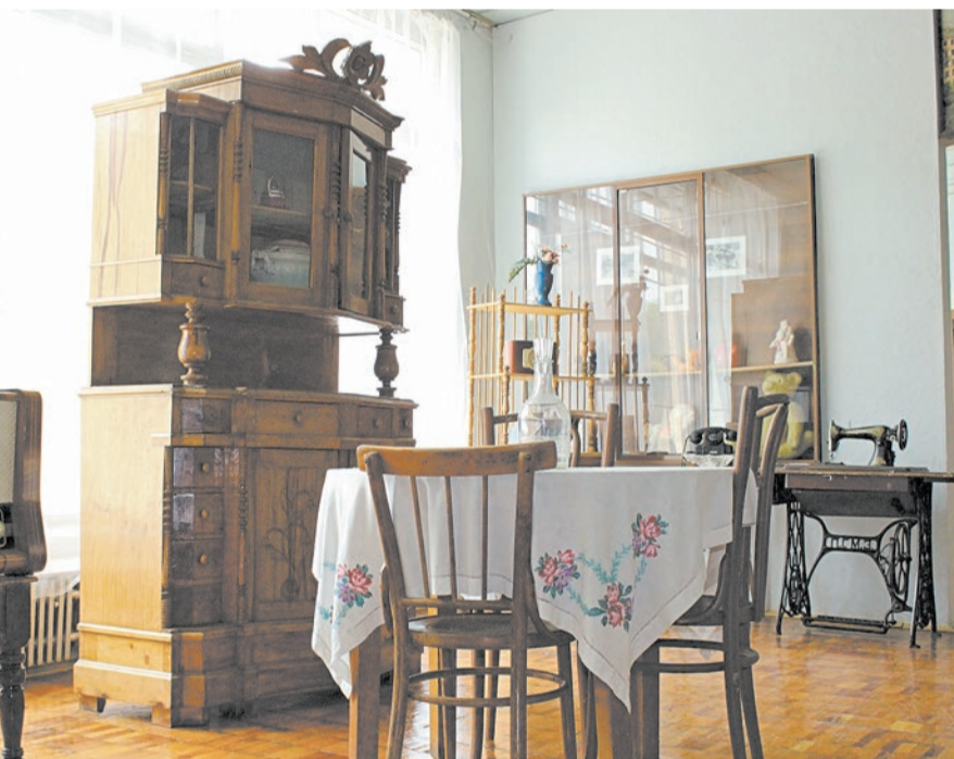
И сердце охватывает ностальгия по ушедшему XX веку — прекрасному времени нашей молодости

В юбилейный год сотрудники музейно-выставочного комплекса приготовили для своих посетителей насыщенную программу. Во-первых, это цикл «От частных коллекций к музейному собранию», «Художники Новотроицка» —