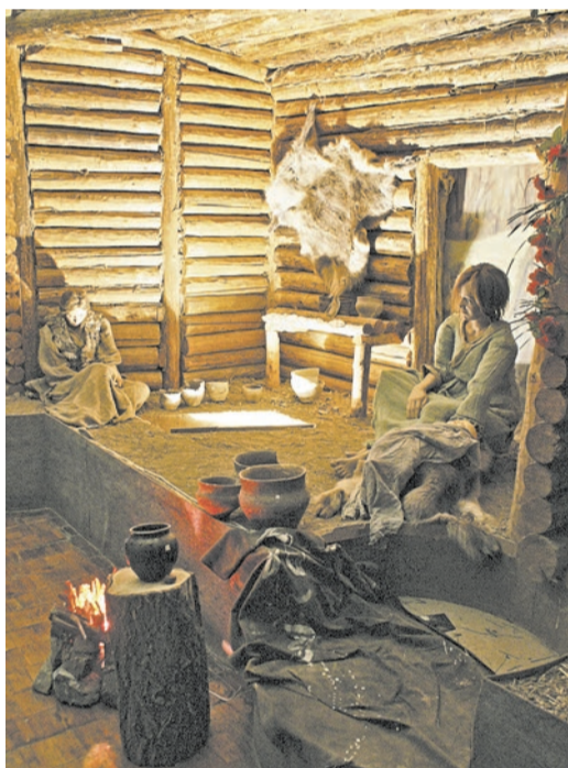
Эффект полного погружения в древность

Через восемнадцать лет, 17 ноября 1988 года, решением городского Совета народных депутатов № 342 музей отделился от Орского и приобрел статус самостоятельного — «Историко-краеведческий музей города Новотроицка». Был набран штат сотрудников.