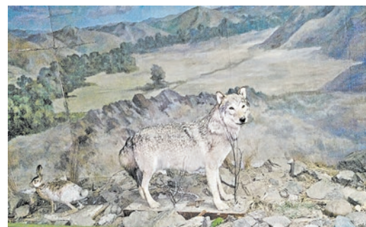
Чучела основных животных Урала — гордость МВК