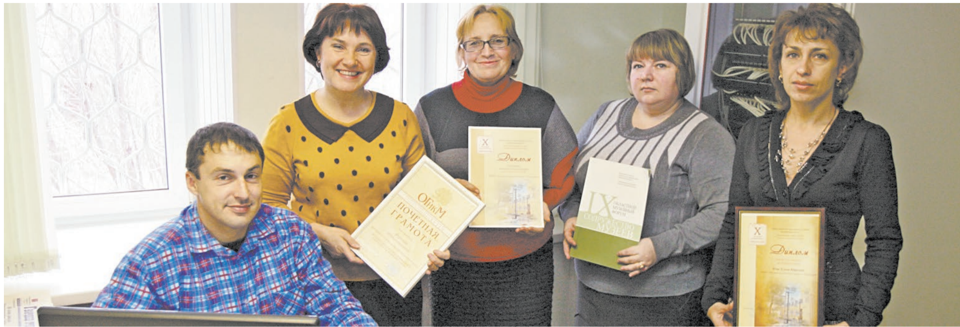
Тесное и многолетнее — так в двух словах можно сказать о сотрудничестве городского музея с журналистами «Металлурга», рассказывающими о новостях МВК

2016 год — юбилейный для новотроицкого музея: в декабре он отмечает свое 50-летие. Вся история нашего городка бережно хранится в его экспозициях и запасниках.