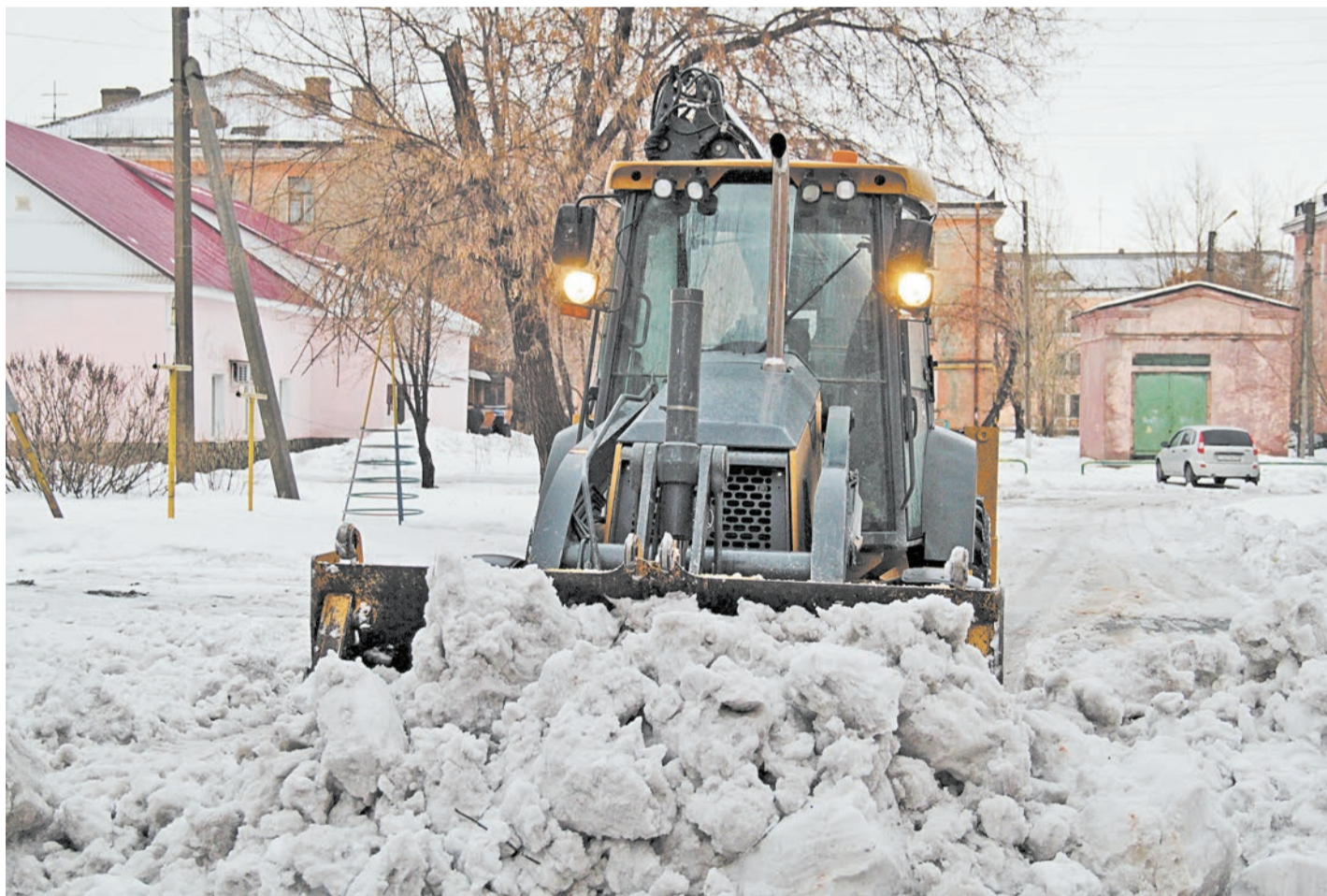
С раннего утра до позднего вечера спецтехника борется со снегом. Дворы чистят даже ночью

Похоже, что погода в эту зиму решила основательно проверить на прочность жителей нашего региона. И проверки эти устраиваются с завидной периодичностью.