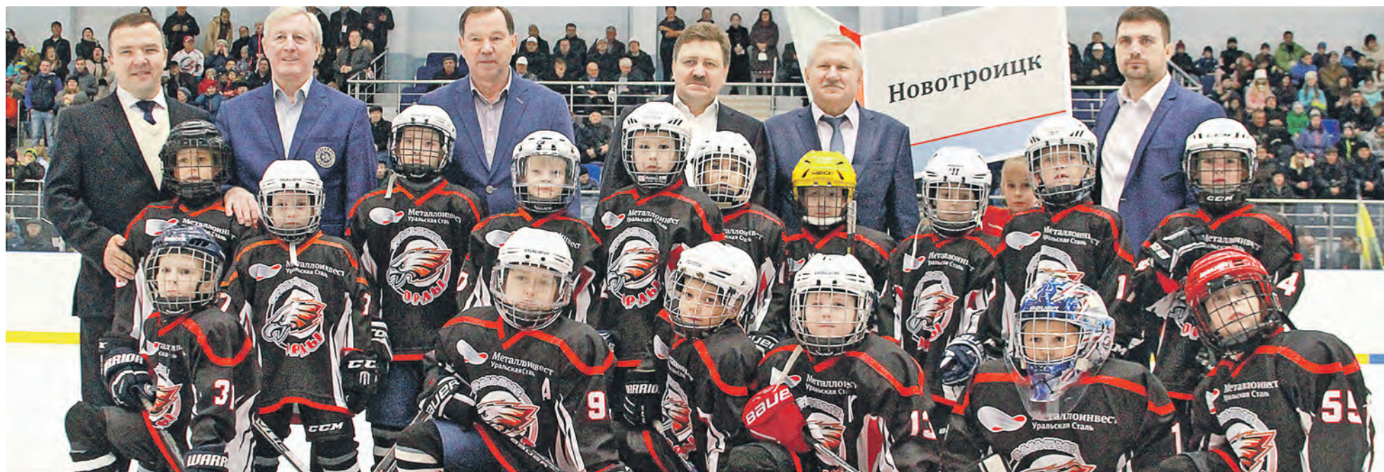
Три дня внимание местных любителей спорта приковано к команде с гордым названием «Стальные орлы». Первые лица города и комбината дали напутствие юным хоккеистам. Мы верим в вас, ребята!

Три дня в Ледовом дворце «Победа» продолжается первый в истории Новотроицка международный хоккейный турнир на кубок управляющего директора Уральской Стали