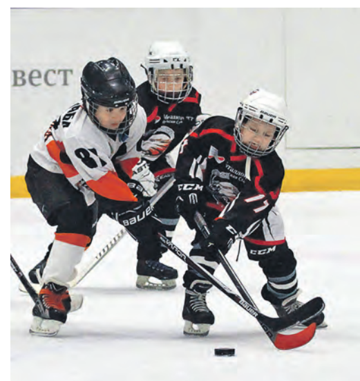
Детская борьба за шайбу