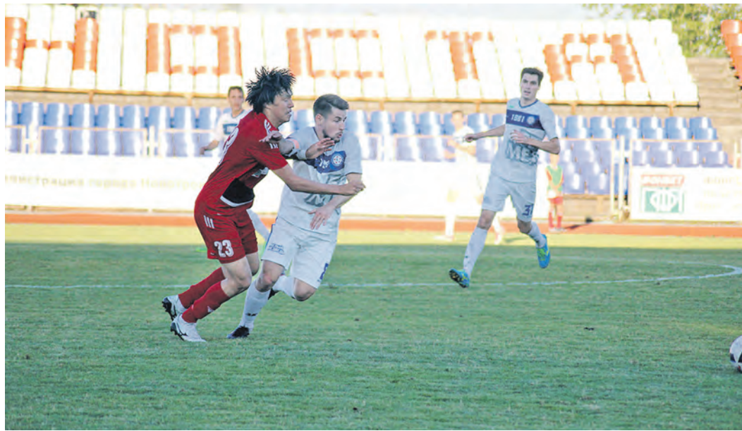
Хозяева поля зорко следили, чтобы гости не смогли подойти близко к их штрафной площади

– «Бей вперед и побежали!», мы предполагали, что «КамАЗ» предложит нам такую манеру игры, в первые двадцать минут у них это получалось. Потом разобрались, но было уже поздно – один из прорывов завершился голом. А вот то, что мы не смогли забить имея, минимум два отличных момента и