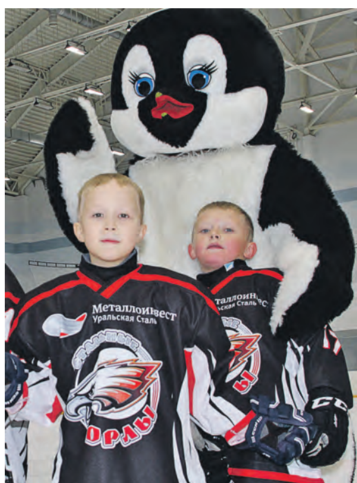
Талисман турнира – пингвиненок Бомбардир

Почетное право открыть международный турнир предоставили его инициатору – депутату Законодательного