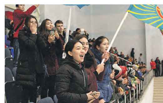
Поддержкой трибун была обеспечена каждая команда