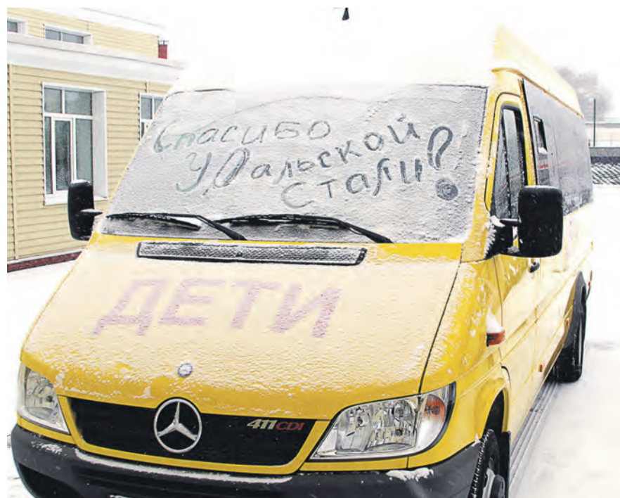
Салон нового автомобиля рассчитан на перевозку 23 человек

Пока в помещении шел торжественный концерт, кто-то из воспитанников под наплывом чувств вывел на припорошенном снегом лобовом стекле автобуса: «Спасибо Уральской Стали!».