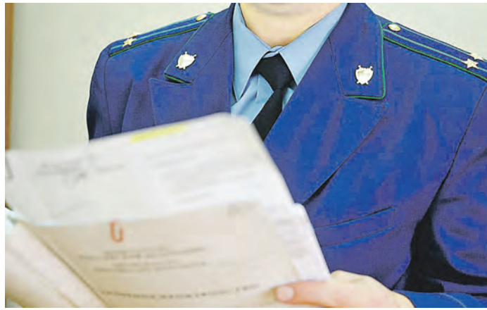
Прокуратура обязала администрацию отреагировать на жалобу

– Согласно правилам санитарного содержания территории города Новотроицка физическим лицам запрещено загрязнять территорию города горюче-смазочными материалами, нефтепродуктами. Компетентный орган по составлению протоколов и расследует данные правонарушения административная комиссия, которая формируется из специалистов городской администрации, в связи с чем жалоба была