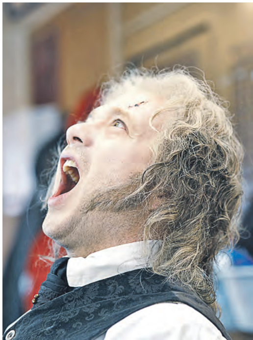
Глава полиции – часть команды. Пока часть

Если учесть две упомянутые выше особенности картины, то мы получим задуманное авторами: разудалое, веселое и жутковатое зрелище, сравнить которое и не с чем. Хоть оно и набито заимствованиями и