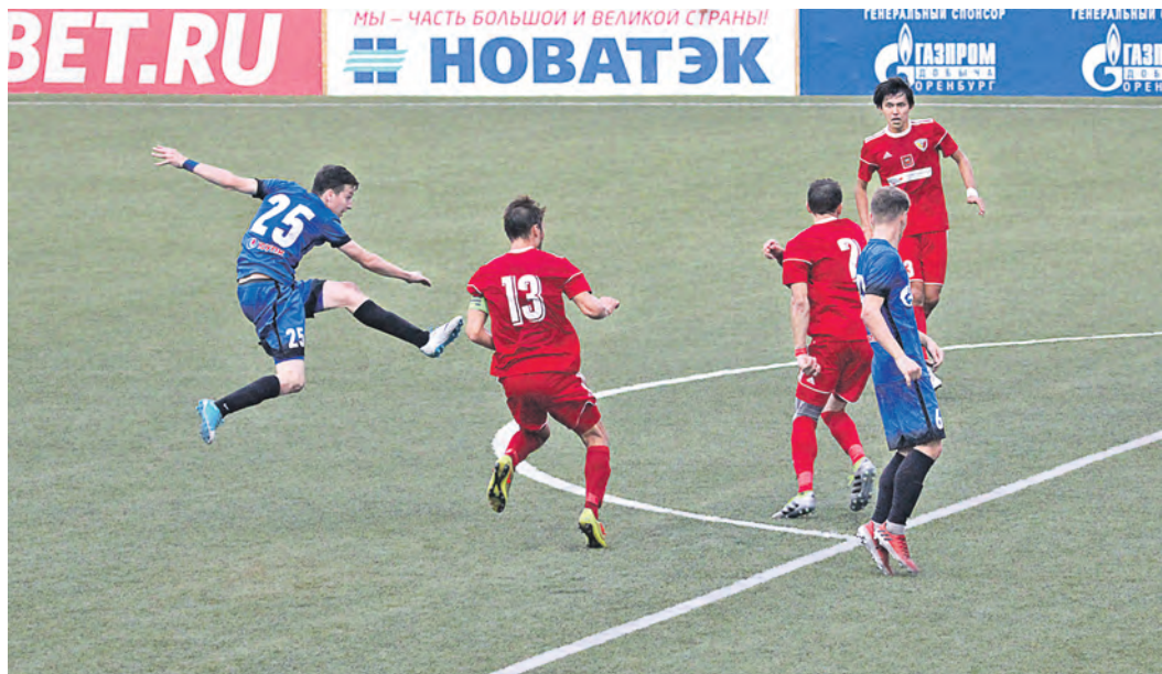
«НОСТА» не смогла воплотить в победу тотальное территориальное преимущество

Даже специалисты знают, что левый фланг металлургов