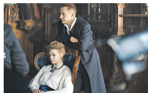
Панночка – обязательный малороссийский персонаж