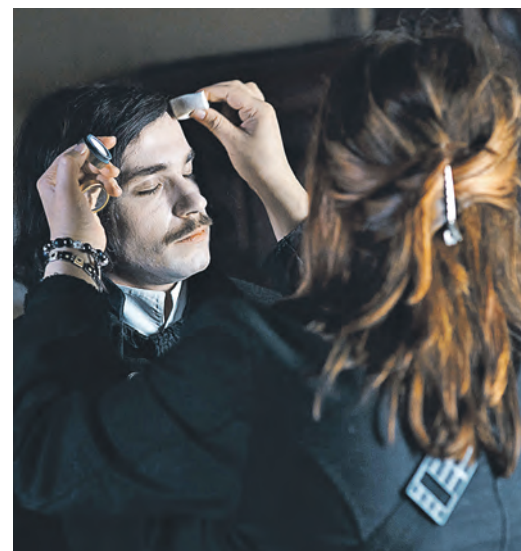
За образом Гоголя внимательно следили гримеры