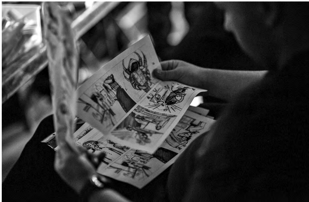
При подготовке к съемкам образы нечисти сначала были много раз отрисованы на бумаге