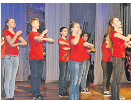
Лицеисты представили композицию «Увертюра» хореографа Олеси Рослик