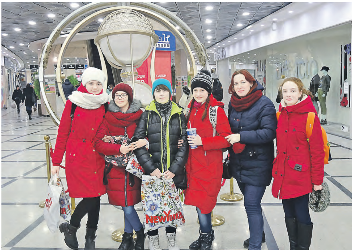
Екатеринбург очаровал новотроицкую делегацию не только историческими памятниками, но и роскошными современными торговыми центрами