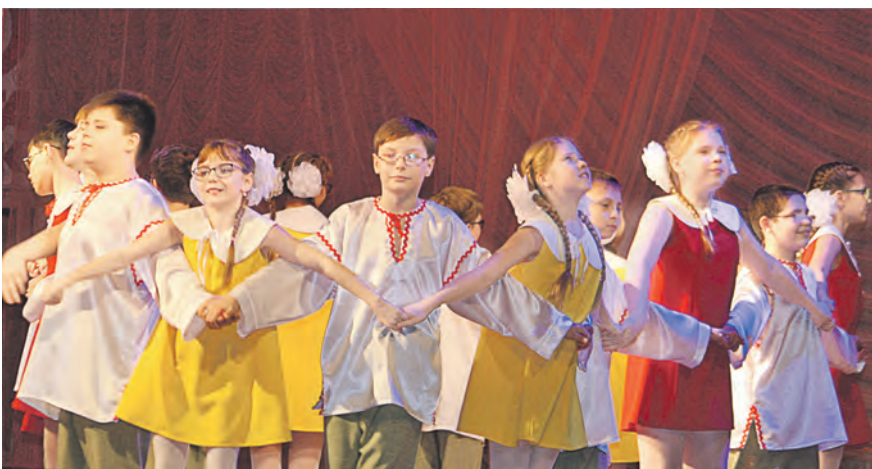
«Солнечный круг» от юных танцоров ансамбля «Сerpантин» школы-интерната