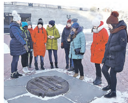
Капсула времени – как послание будущим поколениям – заложена на плотине реки Исеть