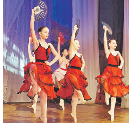
Будущие плисецкие и павловы подрастают в Центре развития творчества детей и юношества