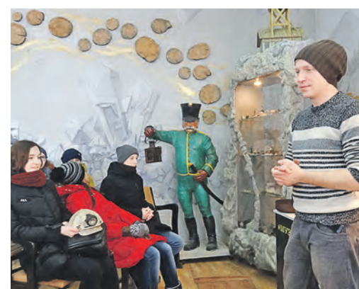
Экскурсии в музее золота, расположенном в Березовском, проводят студенты-добровольцы