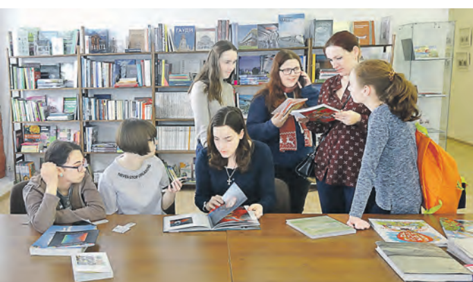
В библиотеке музея архитектуры и дизайна глаза разбегаются от разнообразия профильной литературы