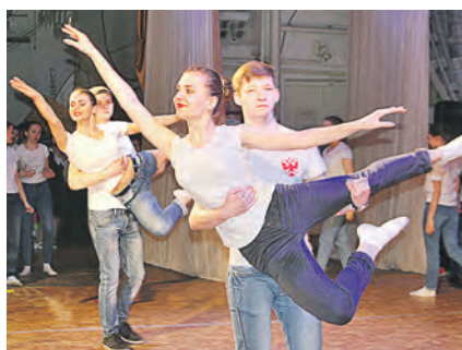
Танец гимназистов «Жить!» никого в зале не оставил равнодушным