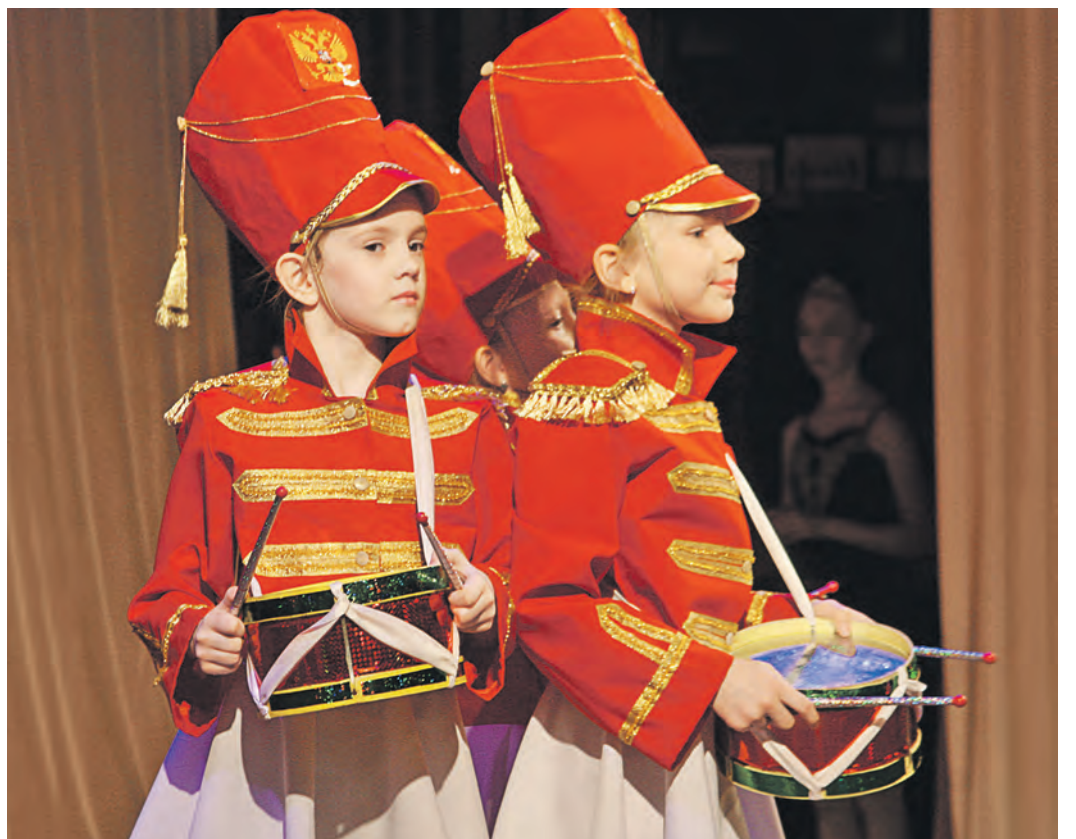
Гусарская форма всем к лицу, в том числе представительницам прекрасного пола. Зрители еще раз в этом убедились, наградив дружными аплодисментами юных барабанщиц из детского сада №37