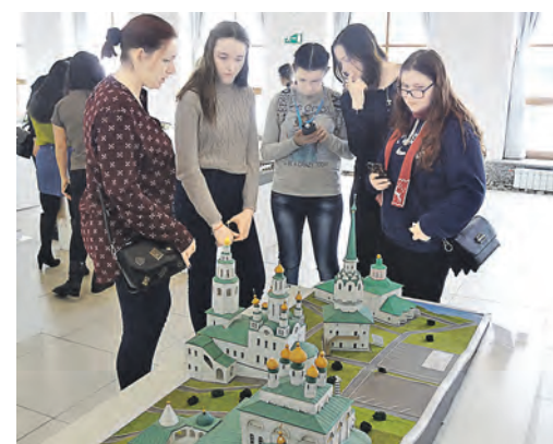
Один из макетов православного собора, представленный в музее архитектуры и дизайна