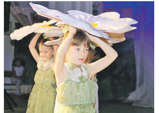
Юные «Ромашки России» из детского сада №24 очаровали зрителей