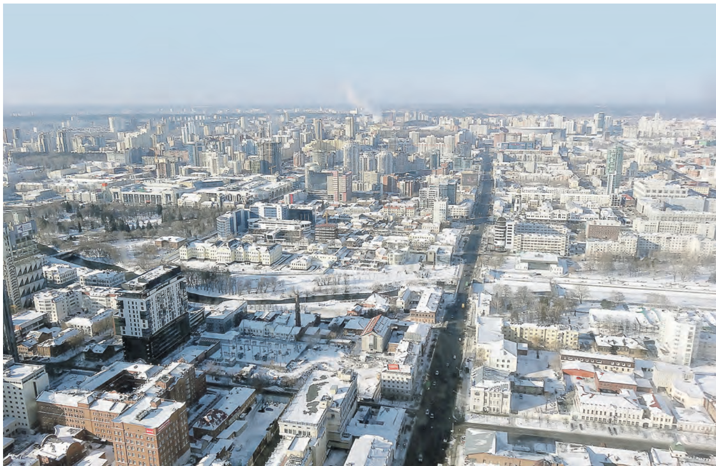
Вид на Екатеринбург с высоты 52-го этажа смотровой площадки бизнес-центра «Высоцкий»