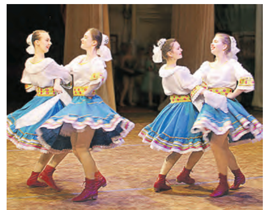
«Волжским проходкам» аплодировали на Урале