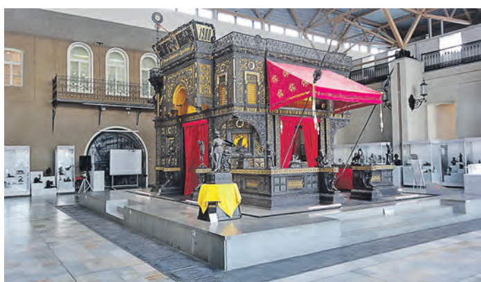
Музей изобразительных искусств Екатеринбурга обладает крупнейшей в России коллекцией каслинского чугунного художественного литья