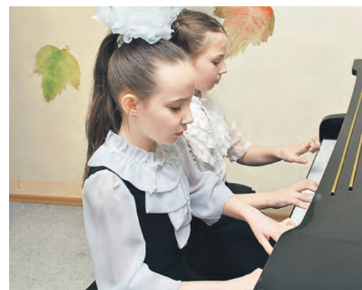
Как оркестр звучит рояль, когда играешь на нем в четыре руки