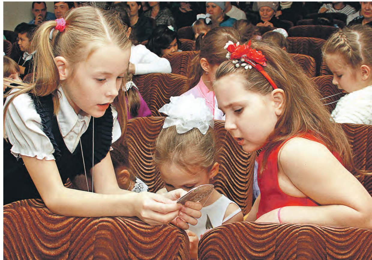
Храни медаль до выпускного!

Александр Проскуровский