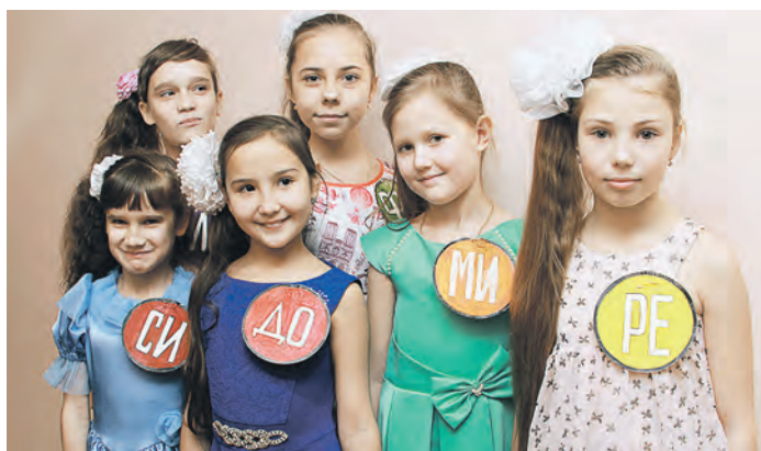
В роли веселых ноток – лучшие ученицы ДМШ, победительницы городских и региональных конкурсов