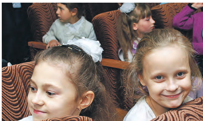
Замечательный праздник украсили белые банты и по-детски открытые улыбки первоклассниц