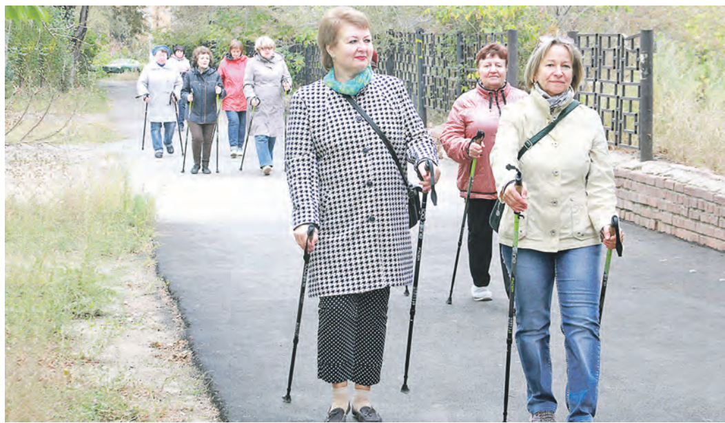
Начав с городских тротуаров, ветераны освоили и пригородные пешеходные маршруты