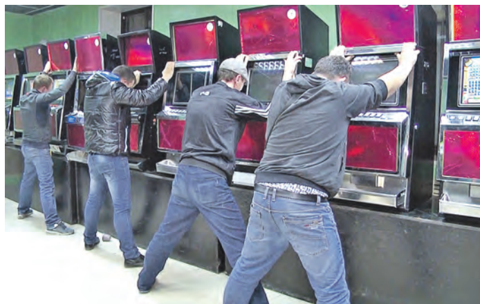
Хозяева и клиенты теневого бизнеса рискнули – и проиграли

Для обеспечения стабильной ежедневной работы незаконного казино организатор игорного бизнеса принял на работу в качестве администраторов заведения двух девушек. Новые сотрудницы посменно круглосуточно выполняли