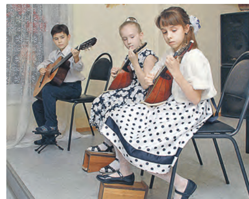
Трио «Колибри» еще молодо, но свой вклад в популяризацию народных инструментов уже вносит