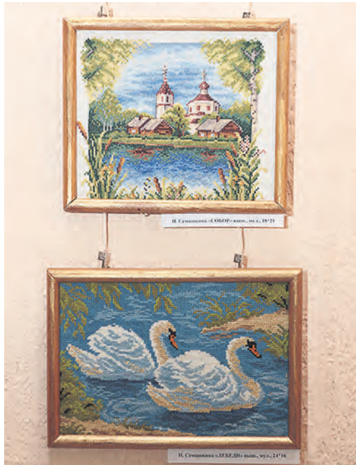
Такие знакомые с детства милые сердцу мотивы украинской земли

Выход на заслуженный отдых – лучшее время для реализации своих творческих замыслов. Это доказывает персональная выставка новотроицкой рукодельницы Натальи Семашкиной, чьи вышитые картины представлены в городском музейно-выставочном комплексе.