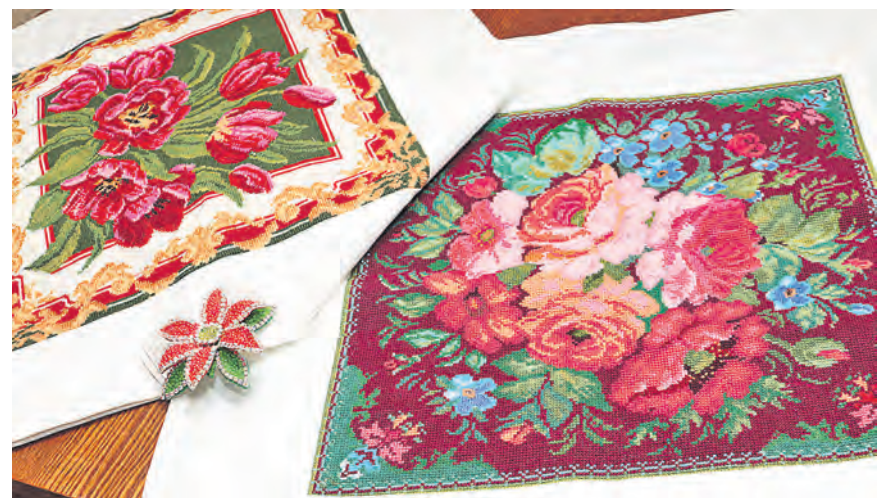
А эти цветы «распустились» на самых обычных наволочках для подушек

Марина Валгуснова