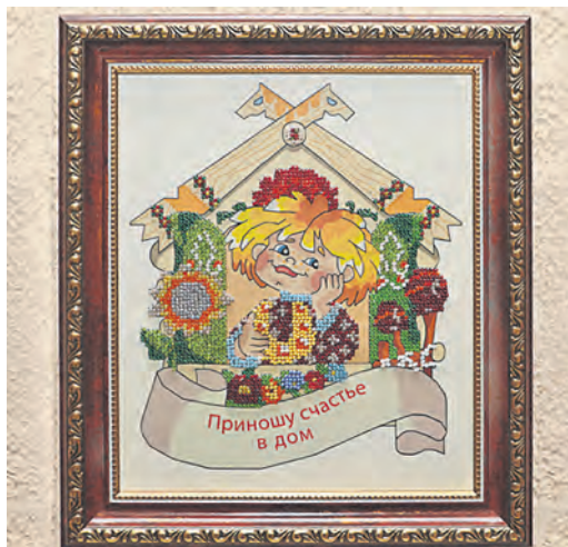
Обереги – для самых дорогих людей