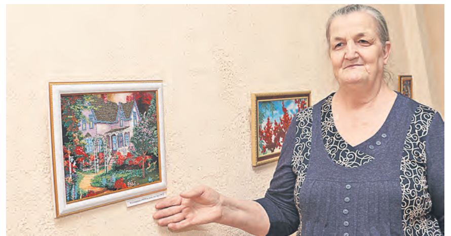
О таком вот загородном домике мечтает новотроицкая мастерица