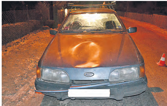
По закону ответственность водителя выше, чем у пешехода