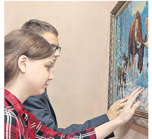
Вышитая картина так и манит потрогать и ощутить прохладные грани бисера