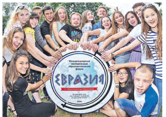
Встречи «Евразии» происходят на перекрестке культур

Оператором образовательной программы выступил Московский государственный институт международных отношений (университет) Министерства иностранных дел Российской Федерации. В работе лекционных сессий будут затронуты темы: «Мир завтрашнего дня: что может сделать нас конкурентоспособными?», «Евразия как новая геополитическая реальность?», «Глобальные вызовы современности: преодоление как залог стабильности. Переход к устойчивому развитию», «Молодежь Евразии: каким мы видим свое настоящее и будущее», «Международная волонтерская программа «Послы русского языка в мире».