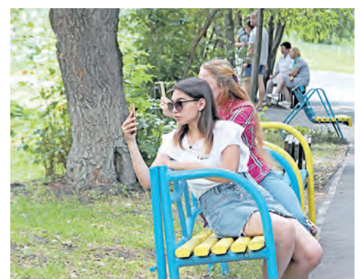
Больше всего стараются запечатлеть все жаркие моменты игры