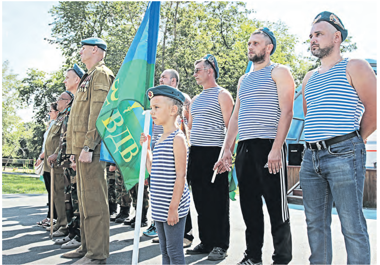
Торжественное построение на главной площади «Родника»

Марина Валгуснова