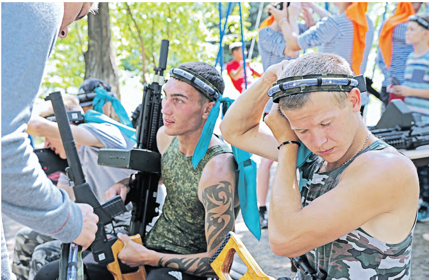
Последние приготовления перед стартом