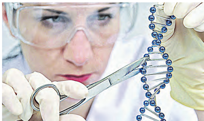
В генетике нас ждет еще очень много открытий

Идентифицируя гены, команда создала модель прогнозирования рисков, которая в будущем поможет лечащим врачам выявлять пациентов с высокой предрасположенностью к аритмии и заблаговременно проводить профилактику. Из 151 гена, ассоциированных с аритмией, 32 могут взаимодействовать с существующими лекарствами. Причем некоторые из них предназначены вовсе не для лечения