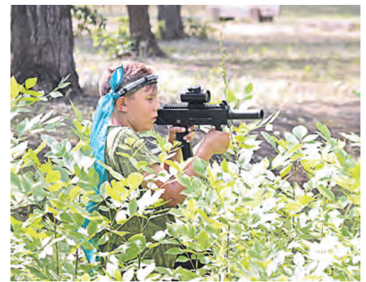
Хорошая маскировка – шанс остаться незамеченным