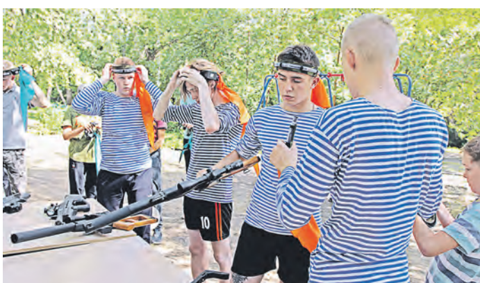
Для участников военно-патриотического клуба «Гридень» это не первые стрелковые соревнования