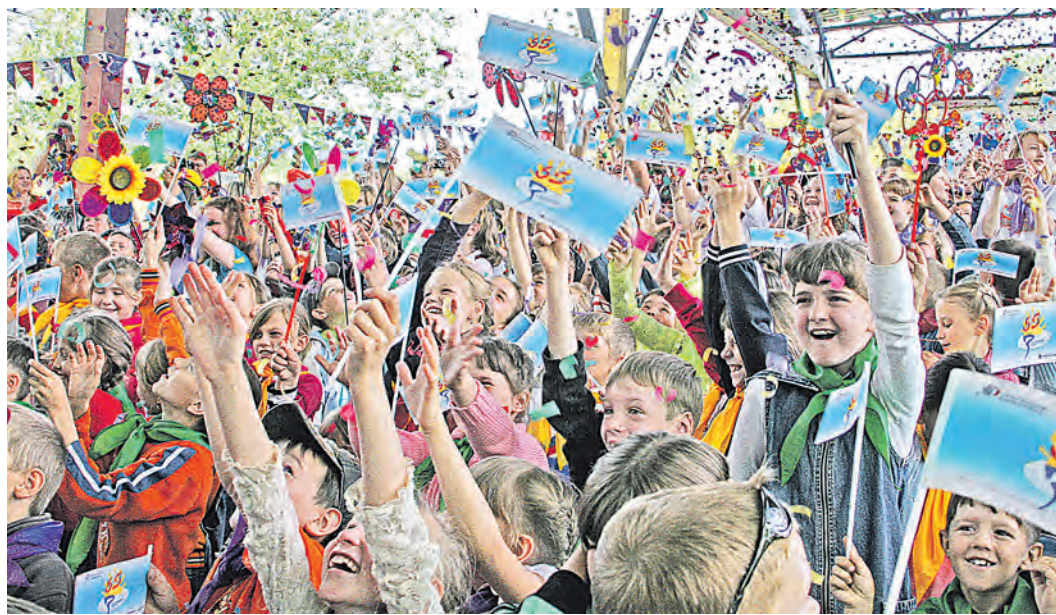
В Новотроицке детские лагеря никогда не пустуют, позволяя за лето отдохнуть тысячам детей и подростков

Заявки принимаются от юридических лиц всех форм собственности, находящихся на территории Оренбургской области, индивидуальных предпринимателей, адвокатов, нотариусов и иных субъектов, наделенных правом