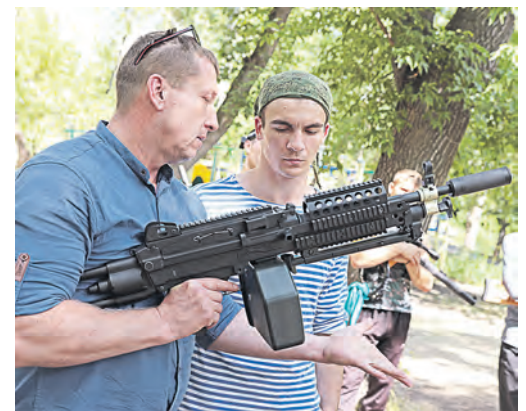
Без четких инструкций наставника с электронным оружием не справиться