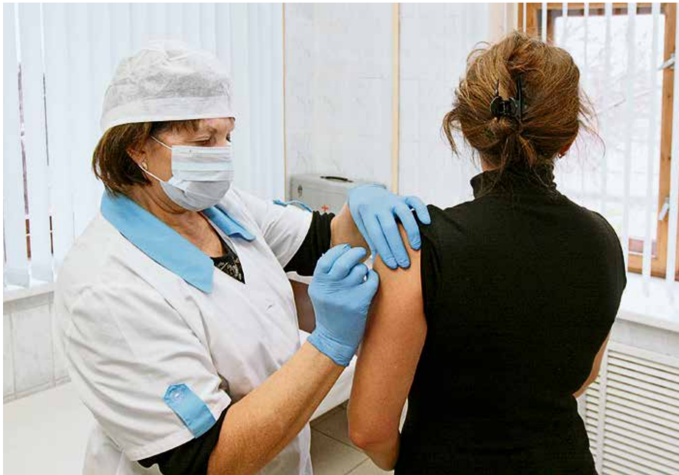
◀ Несколько секунд, потраченных на вакцинацию, способны сберечь здоровье на долгие годы

Выжившим тоже непросто, у пожилых, например, усиливает-