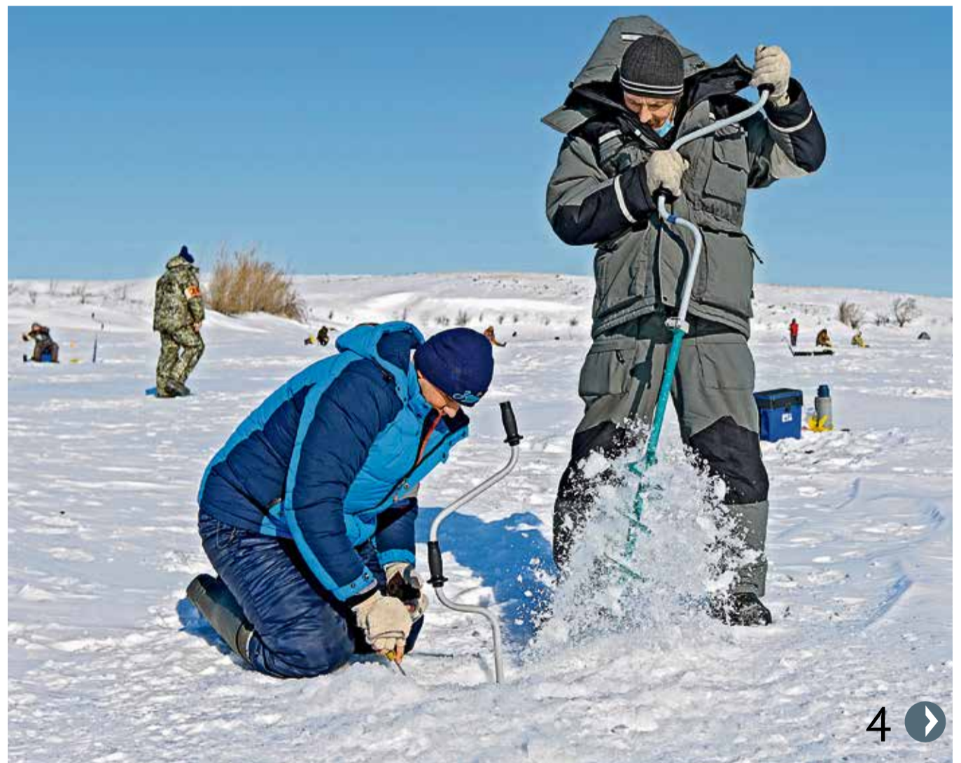
▲ Чтобы добуриться до воды в этом году, нужно было постараться — ледовый покров достигал метровой толщины

Пятый этап Корпоративной спартакиады прошёл на льду Ириклинского водохранилища, где собрались специалисты по подлёдному лову.