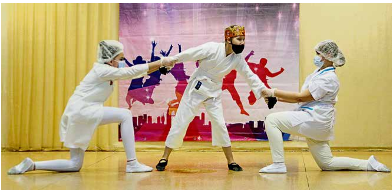
▲ Драматургии в программу конкурса добавил танец «В благодарность врачам!»