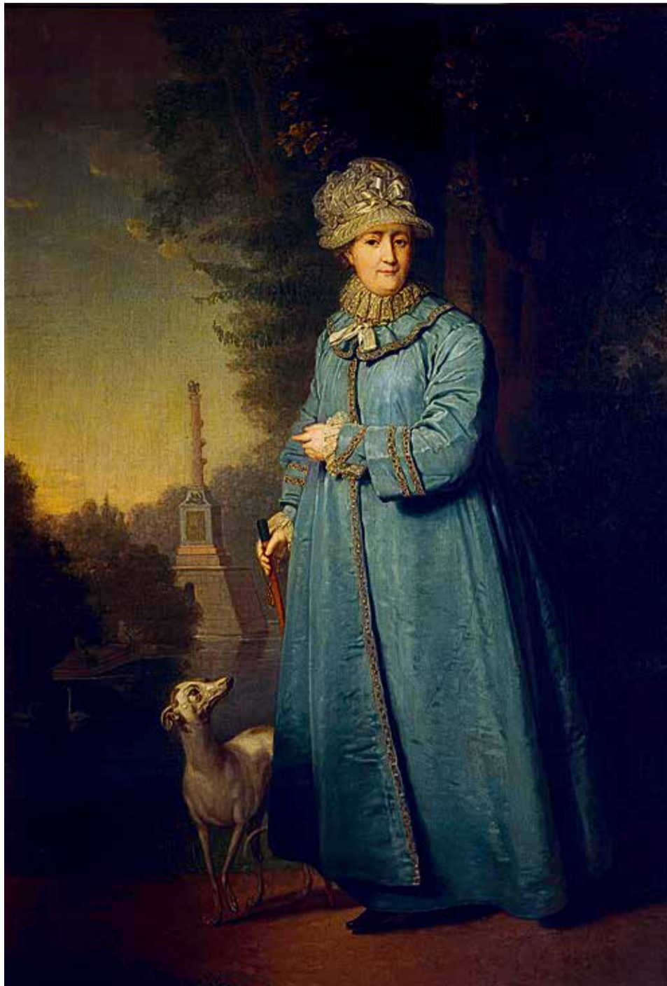
▲ Зрители могут увидеть одну из первых попыток отойти от канонов помпезного изображения государей, картину «Екатерина II на прогулке в Царскосельском парке»

67 произведений живописи и декоративно-прикладного искусства посвящены женщинам или ими созданы. Царствующие особы и светские дамы, работницы и крестьянки, служительницы Мельпомены и монахини. Темы и стили широко варьируются: от классических портретов до жанровых сцен. Парадные изображения сменяются приватными, сдержан-