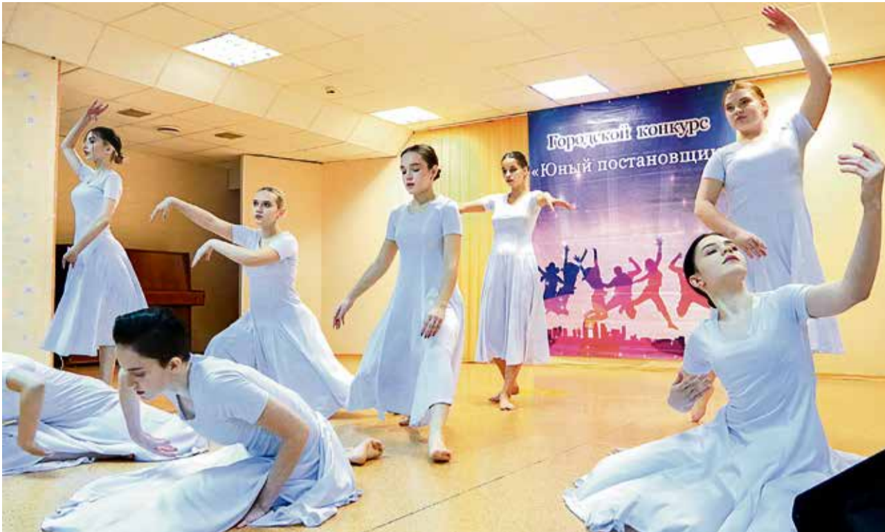
▲ Девушки коллектива «Ритмы юных» посвятили своё выступление любимому педагогу