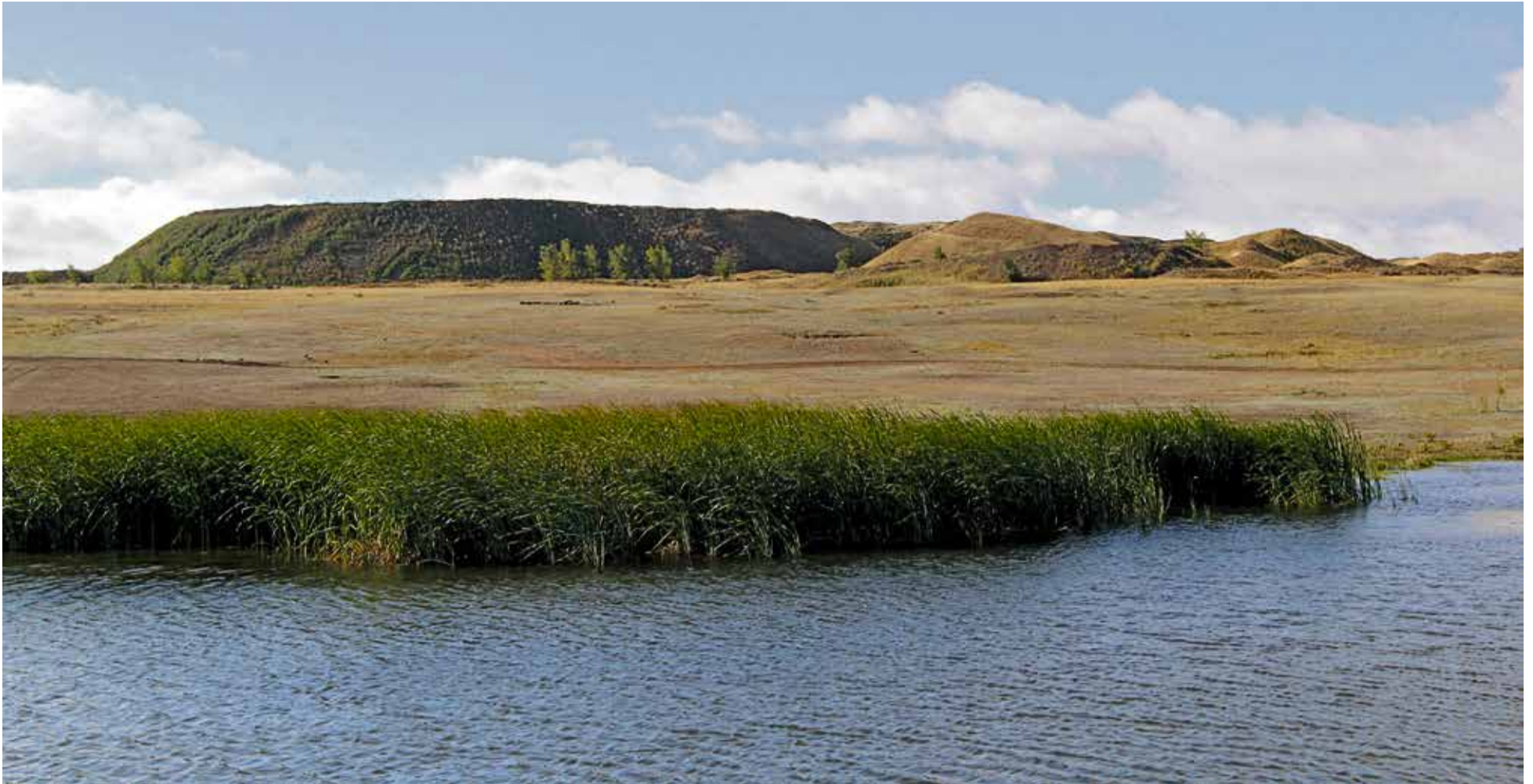
▲ Если перейти озеро по дамбе и свернуть вправо, можно легко обнаружить рукотворные углубления — всё, что осталось от посёлка добытчиков марганца