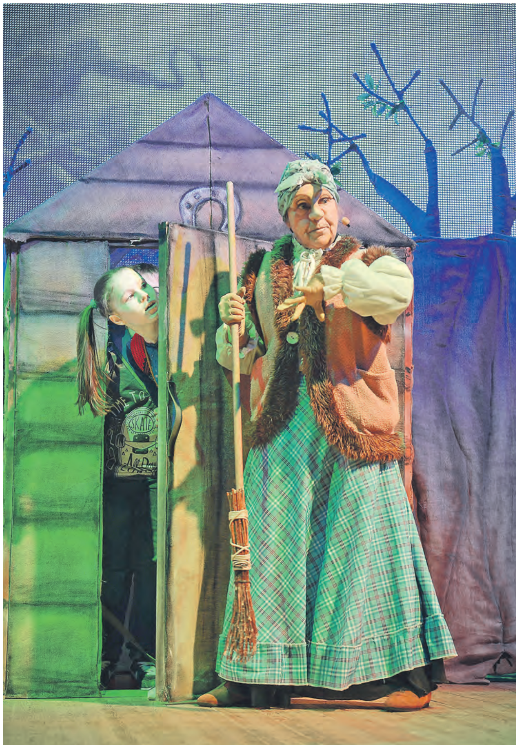
Сказочные персонажи оренбургского театра легко узнаваемы и по-своему симпатичны

В рамках фестиваля искусств АРТ-ОКНО благотворительного фонда Алишера Усманова «Искусство, наука и спорт» в нашем городе проходят гастроли Оренбургского театра кукол.