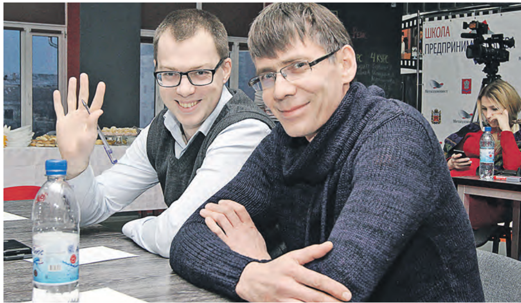
Выпускники Школы получают вместе со знаниями уверенность в собственных силах

Для участников Школы все обучение бесплатно, а это не только теоретические занятия, но и живое общение с состоявшимися предпринимателями, бизнес-тренерами и наставниками. Программа Школы предпринимательства построены по принципу «от идеи до работающего бизнеса»: обучение начинается с момента формирования концепции собственного дела, составления бизнес-плана, до открытия нового работающего бизнеса.