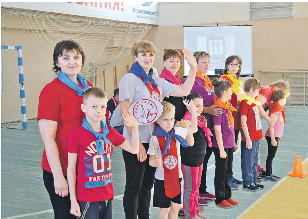
Команды бабушек и внуков вышли на старт! Впереди ждет множество испытаний

Марина Валгуснова