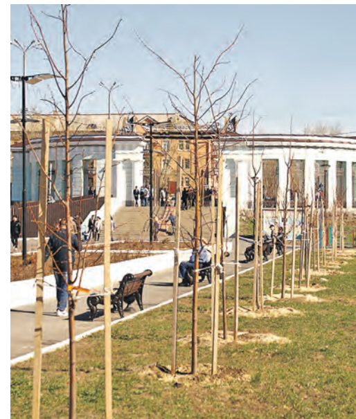
Зашумят зеленой кроной молодые клены