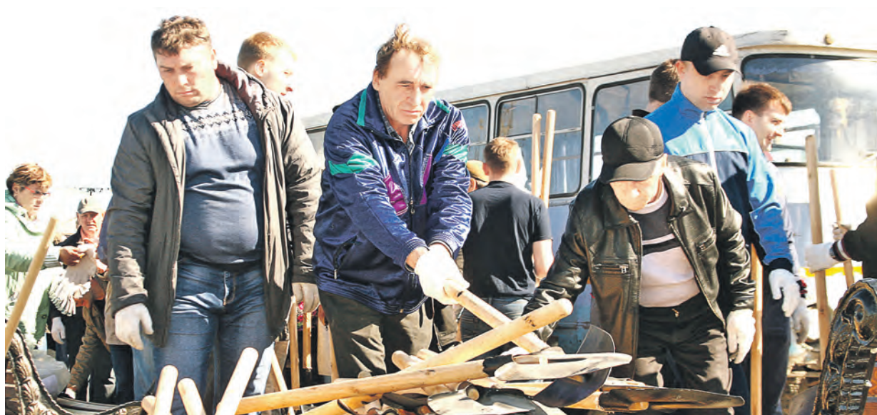
Ребята, разбирай лопаты!