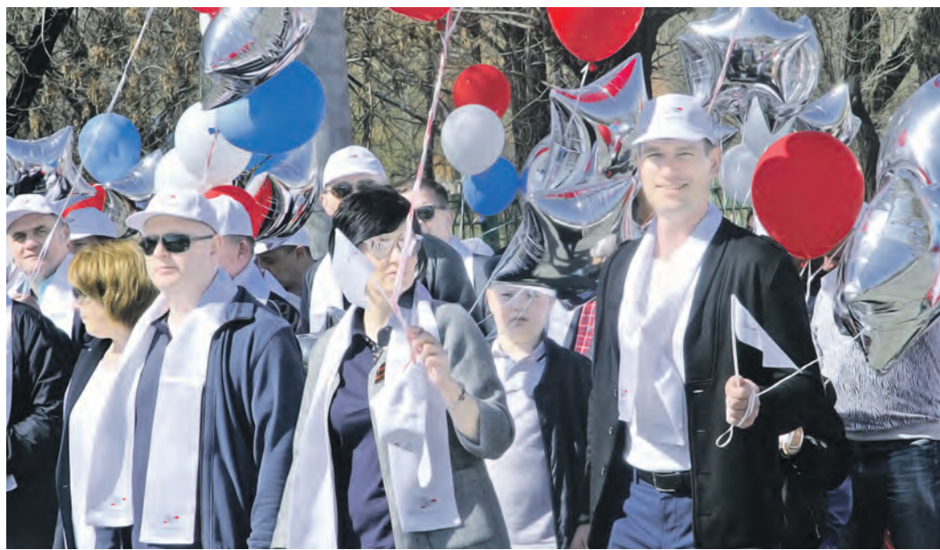
Новотроичане ни разу не прерывали традицию первомайских шествий

Открывало торжественный марш, по традиции, поколенные новотроичан, которым предстоит строить здесь будущее – ученики городских школ. Тут можно было увидеть, насколько разнообразны увлечения молодежи. Вот среди колонны выделяется четкими очертаниями несколько десятков юношей, марширующих в военной форме. Держат строй, подражая «коробкам» воинов, виденных на Красной площади и, проходя перед трибуной, начинают печатать шаг. А вот менее формальные представители поколения открывают колонну своего учебного заведения велосипедной кавалькадой. «Хорошо в это день с городом знакомиться, он сам весь выходит к тебе навстречу!», – замечает гость из Казахстана, оказавшийся в этот день в Новотроицке. Следом за школами следуют