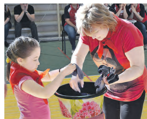
Найти пару каждому носку оказалось не так просто