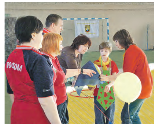
Повязать на воздушный шарик платок – очень непростое задание!