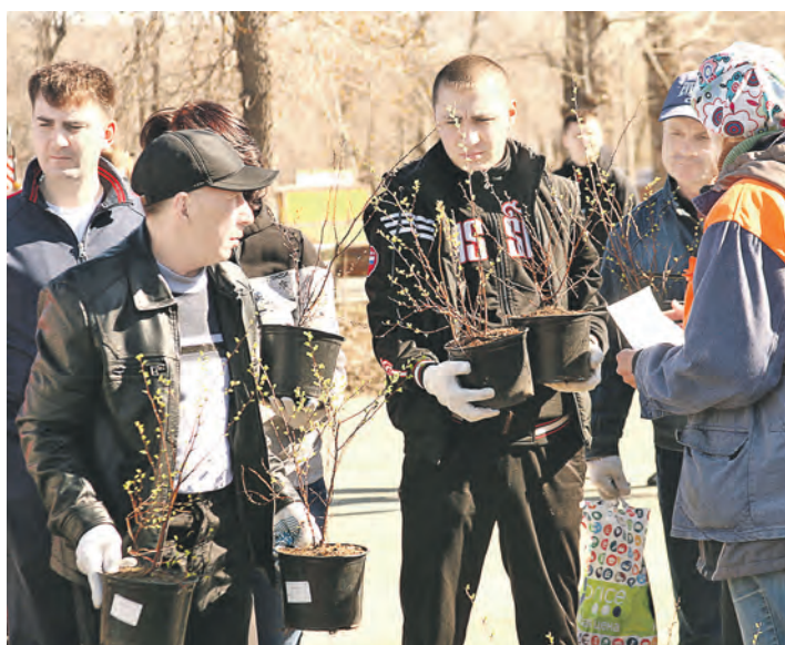
Саженцев хватит всем

Александр Проскуровский