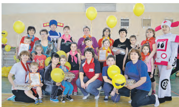
Общее фото на память