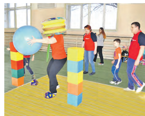
Горячий момент «Больших гонок»: обойти препятствие, ориентируясь на команды внука