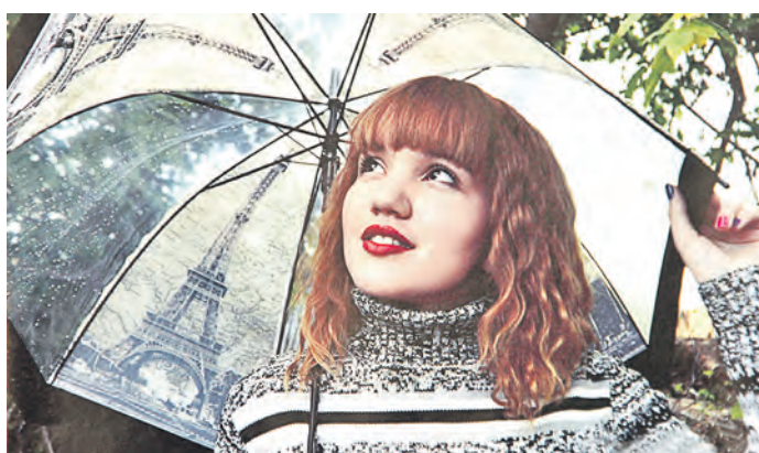
Зонттик с видами Парижа, но поля пока не Елисейские – наши. А главное, мечтать о путешествиях не вредно...