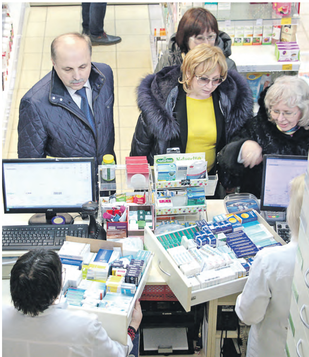
Принцип выбора аптеки по близости к дому не всегда оправдан, иногда разница в цене на один и тот же препарат составляет десятки, а то и сотни рублей

Многие думают, что схожие внешне узнаваемые атрибуты аптек означают их сетевую принадлежность, а значит, цены там одинаковые. Это не так. Несмотря на цветовую идентичность вывесок и витрин эти аптеки – разные юридические лица, информация об этом скромно значится на небольших табличках при входе. К сожалению, никто из представителей частных аптек, в которых мы побывали, не согласился прокомментировать ценообразование,