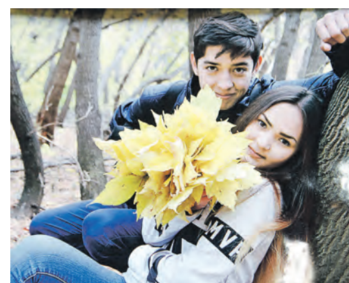
Юноша в кадре дарит сильному полу надежду на будущую выставку Горшковой о нас, мужики!