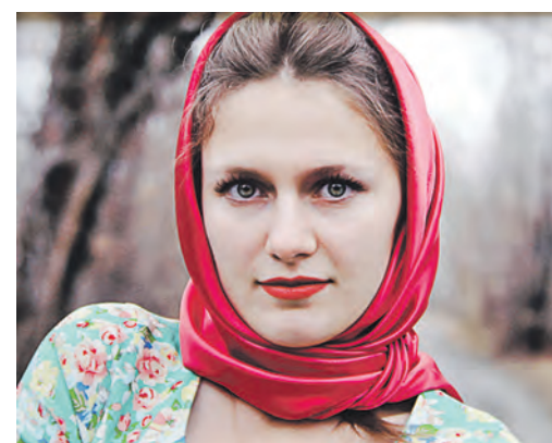
Зрителям судить, удалось ли молодому автору постичь всю глубину женской души