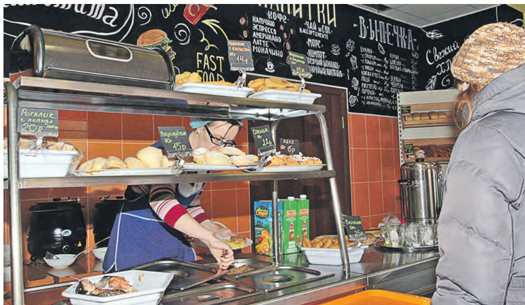
Оформление кафе тоже имеет значение. Например, в «Спутнике» акцент сделали на контрастных цветах, яркой мебели и оригинальной росписи на стенах.

Доступный ланч можно найти в чайхане «У Тамары» (улица Марии Корецкой, 2): кроме первого и второго из привычного обеденного меню здесь большой выбор национальных блюд, внушительный