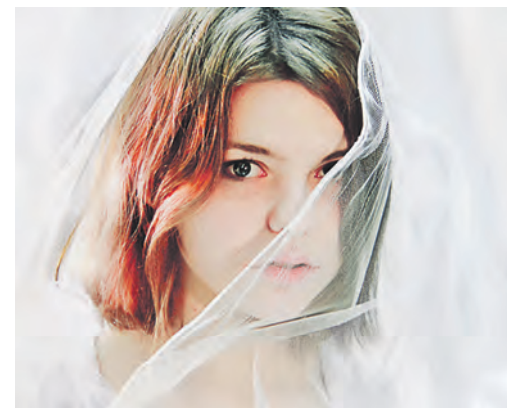
Молодой фотограф умеет создать романтический образ своей современницы