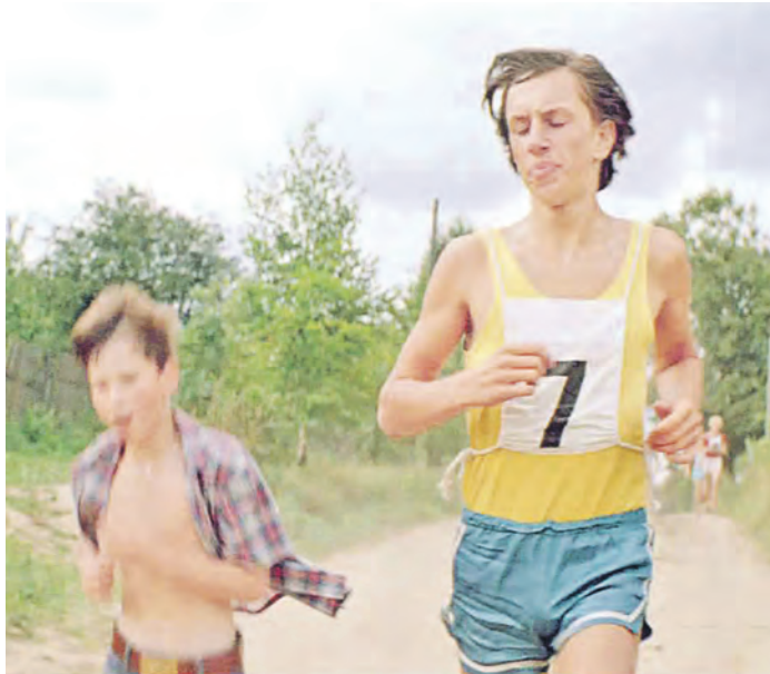
Никто не спорит, что физическая подготовка – важная часть воспитания здорового человека. Но прививать ее силой – плохой метод.

Но тех, кто продвигает ГТО в оренбургские массы, это не волнует. Принцип тот же – если сверху велели внедрить ГТО, значит будем внедрять! И не важно, что из всего коллектива только одна десятая часть