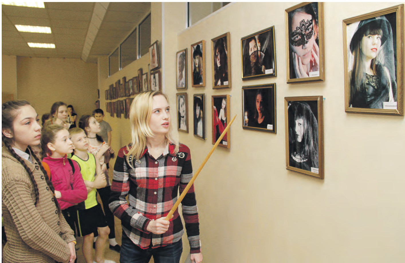
Автор выставки готова ответить на все вопросы зрителей и прокомментировать каждое фотополотно