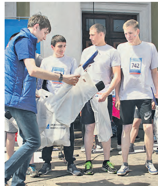
Спортивных трофеев хватило на всех