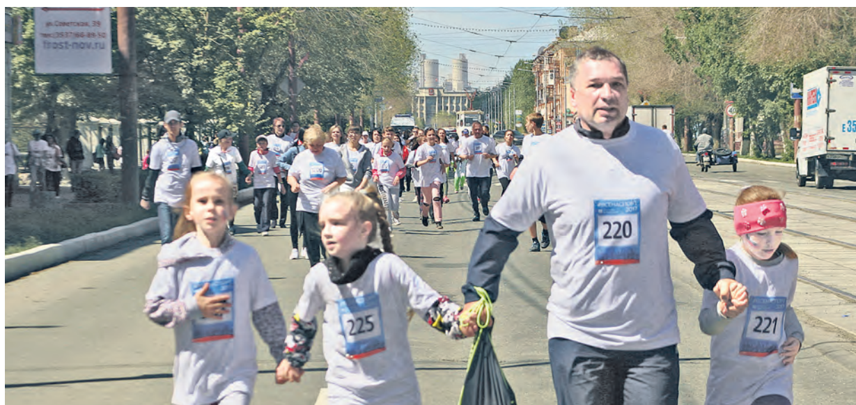
Закон семейной команды гласит: «Своих не бросаем! Только вперед и только все вместе!»