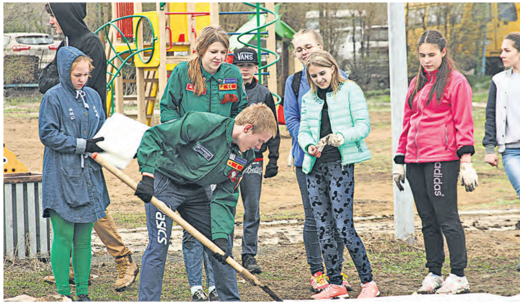
Первые всходы ромашки появятся совсем скоро

В старину люди были уверены, что там, куда падала звезда,