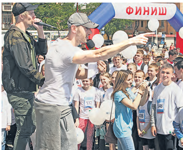
Две звезды, Станин и Орлов, «прокачали» площадь Металлургов

Александр Проскуровский