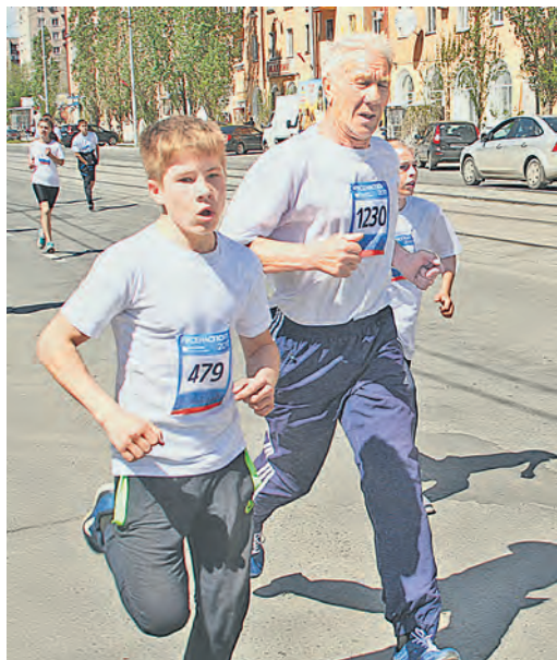
Получилась эстафета – эстафета поколений

Новотроицк присоединился к спортивной семейной акции #ВСЕНАСПОРТ-2017 Благотворительного фонда Алишера Усманова «Искусство, наука и спорт».