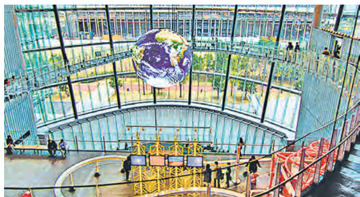
Музей – это место, где встречаются настоящее и прошлое

Кристина Гаврилова, научный сотрудник МВК