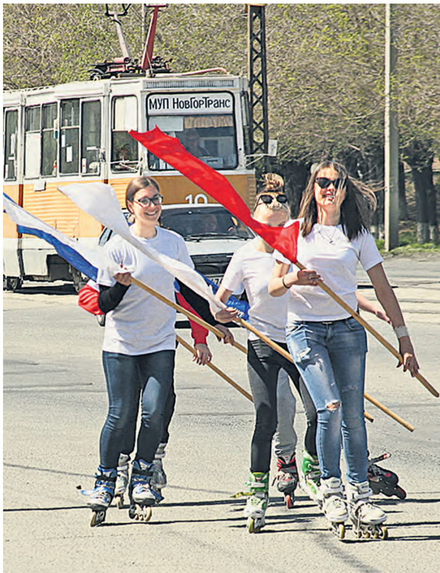
Позади старт... Да здравствует спорт!

Почти 1300 горожан дружно вышли на старт, тем самым присоединившись к любителям здорового образа жизни из Старого Оскола и Железногорска.