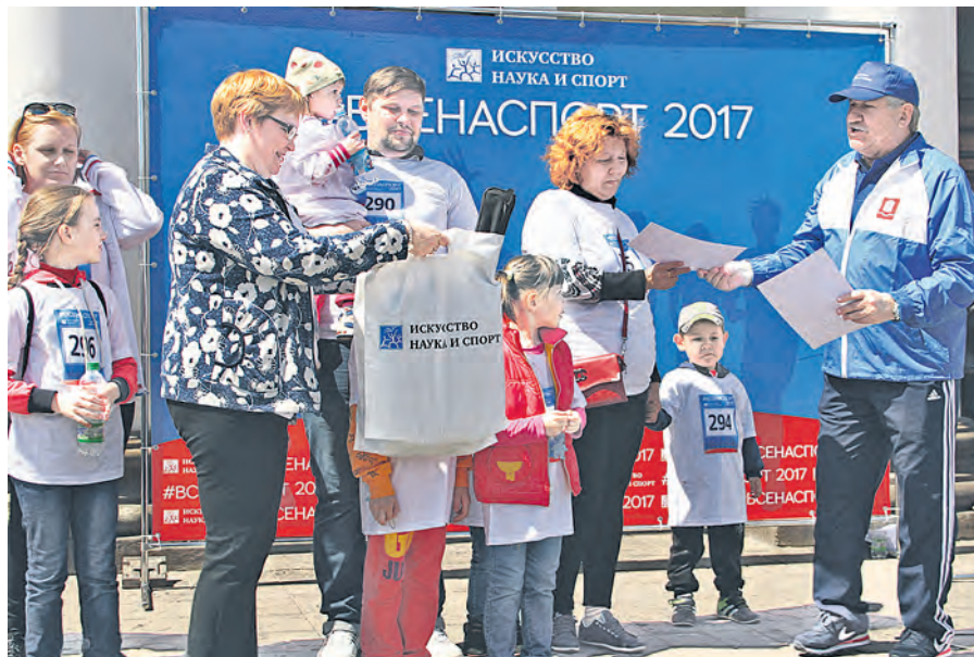
Приятный миг награждения