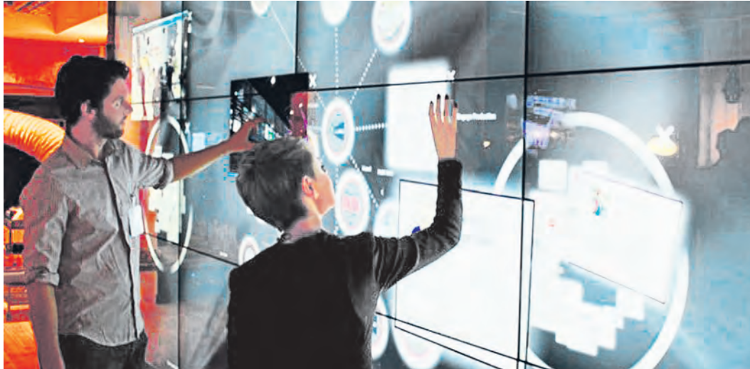
Самая важная задача – объединить под крышей музея современную науку, творчество и культуру

Так каким же он будет, музей будущего? Закрыв глаза, я представляю большой корабль. Поскольку музей – это место, где встречаются настоящее и прошлое, то пусть он будет большим кораблем времени, парящим над землей. В этом корабле обязательно будут множество различных залов, а на входе в самом центре будет гигантский шарообразный экран, демонстрирующий карты нашей Земли и