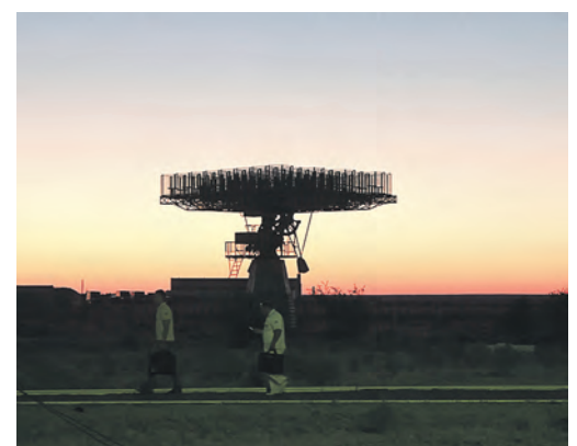
Почти африканский пейзаж, но вместо акаций здесь «растут» радиолокационные антенны