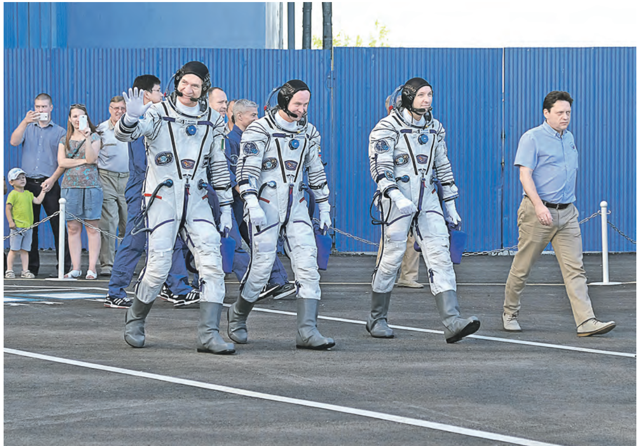
«Заправлены в планшеты космические карты, и штурман проверяет в последний раз маршрут...». Слова из старой песни сами собой приходят в голову, когда понимаешь: вскоре эти люди окажутся в сотнях километров над поверхностью Земли