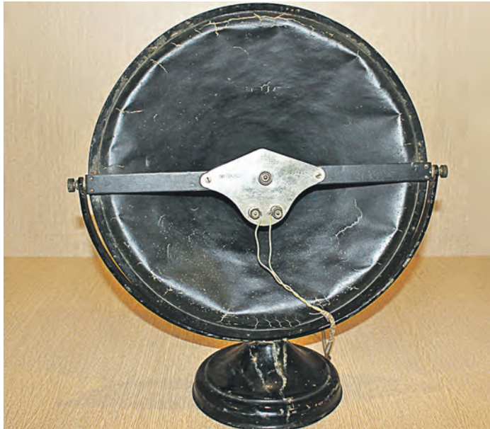
Репродукторы такого типа выпускались в СССР с конца 20-х годов прошлого века на нескольких предприятиях страны

Начиная с 20-х годов, радио, как средство массовой информации с наибольшим охватом аудитории, стало основным инструментом, формирующим кругозор и мировоззрение граждан СССР. По радио передавали политические новости и производственные достижения,