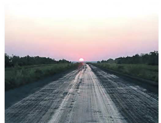
Прощай, Байконур, ты оставил незабываемые впечатления, и мы постараемся к тебе вернуться!