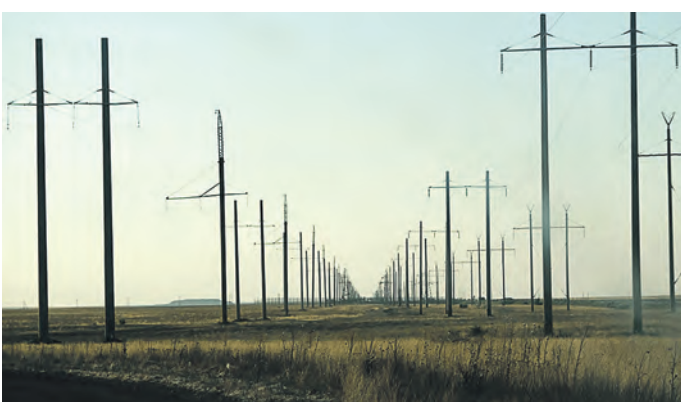
Когда в бескрайней и безлюдной степи вдруг вырастают могучие опоры ЛЭП, это означает – что дорога в космос где-то рядом