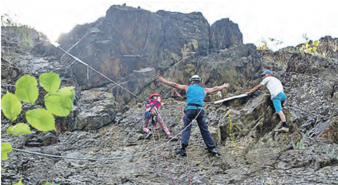
По отвесной скале можно идти с закрытыми глазами – дочь подстрахует