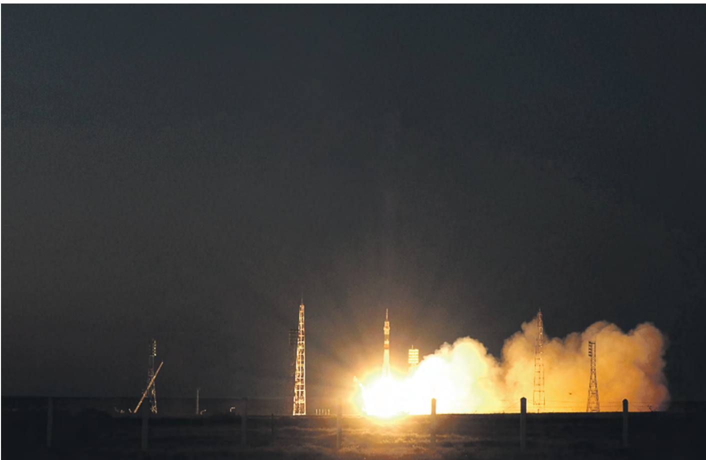
У фотографов было всего несколько секунд, чтобы успеть снять старт в космос