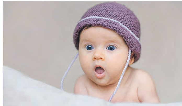
Дети удивляются, если победитель оказывается обделен

Детей приводили в замешательство два последних варианта: после окончания сценки младенцы продолжали смотреть на экран, как если бы итог дележа не укладывался в их представления о положении вещей. Дети ожидали, что главная кукла получит большую награду, ведь она в начале выиграла борьбу за стул. То есть уже в полуторагодовалом возрасте дети вполне могут считывать чужое социальное положение и предвидеть, какие «бонусы» полагаются в связи с этим. Теперь ученые