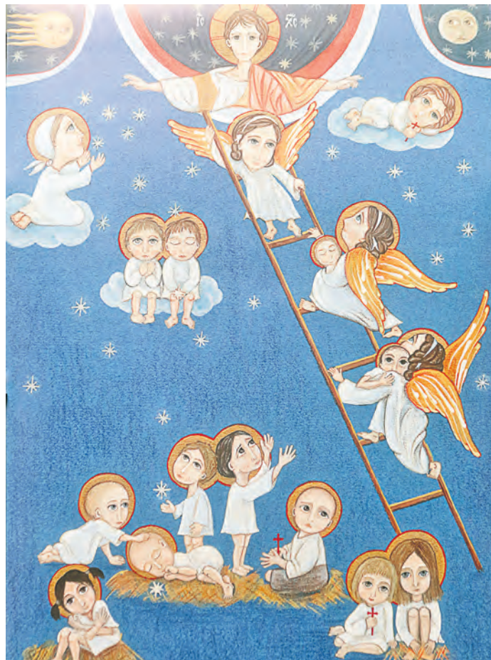
Лики погибших детей – основная тема в монастырских работах