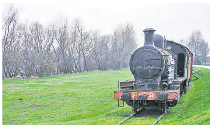
Поезд «Воз ужаса», который привозил вагоны с узниками в лагерь

Инициатором выставки выступила Орская епархия русской православной церкви, передавшая малоизвестные документы о сети концлагерей, которые действовали во время Второй мировой войны на территории Хорватии. Среди экспонатов фотографии с мест чудовищной трагедии сербского народа и картины монахинь, наших современниц, которые трудятся в восстановленных храмах.