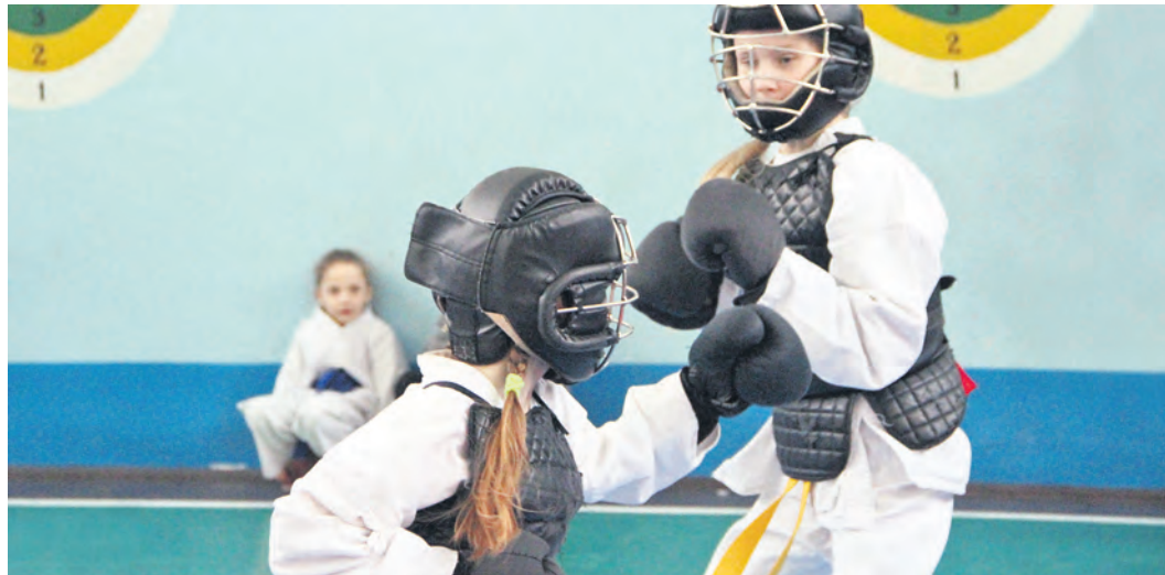
Каратисты в кобудо похожи на древних воинов в тяжелом вооружении

Награды ребятам вручили ветераны Афганистана – активисты местного отделения Всероссийской общественной организации ветеранов «Бое-