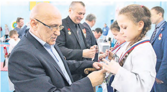
Герои войны награждают юных героев спорта

Александр Викторов