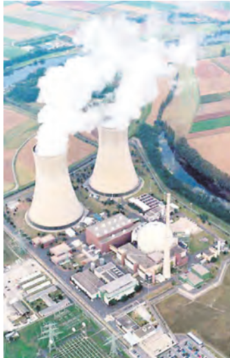
Кому достанется лакомый кусок?

Приобретение электростанции для главы ArcelorMittal Лакшми Миттала стало продолжением схватки с известными бизнесменами – семьей Руйа, которая борется за то,