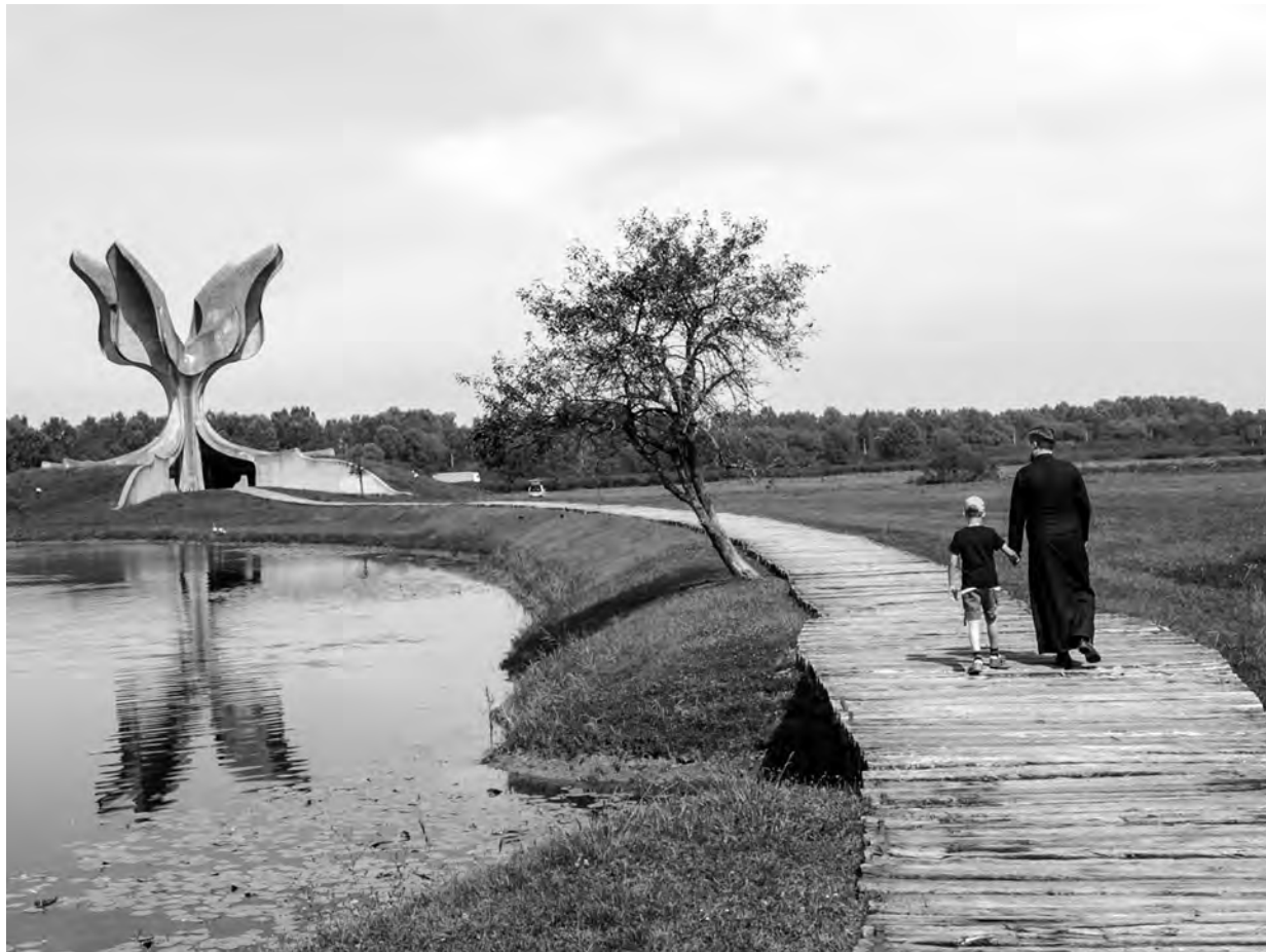
Монумент памяти всех невинно убиенных в лагерях Ясеновац расположен на месте массовых расстрелов заключенных

В течение недели в новотроицком филиале МИСиС будет работать документальная выставка, посвященная жертвам лагерей смерти «Ясеновац». Затем она переместится в городской музейно-выставочный комплекс.