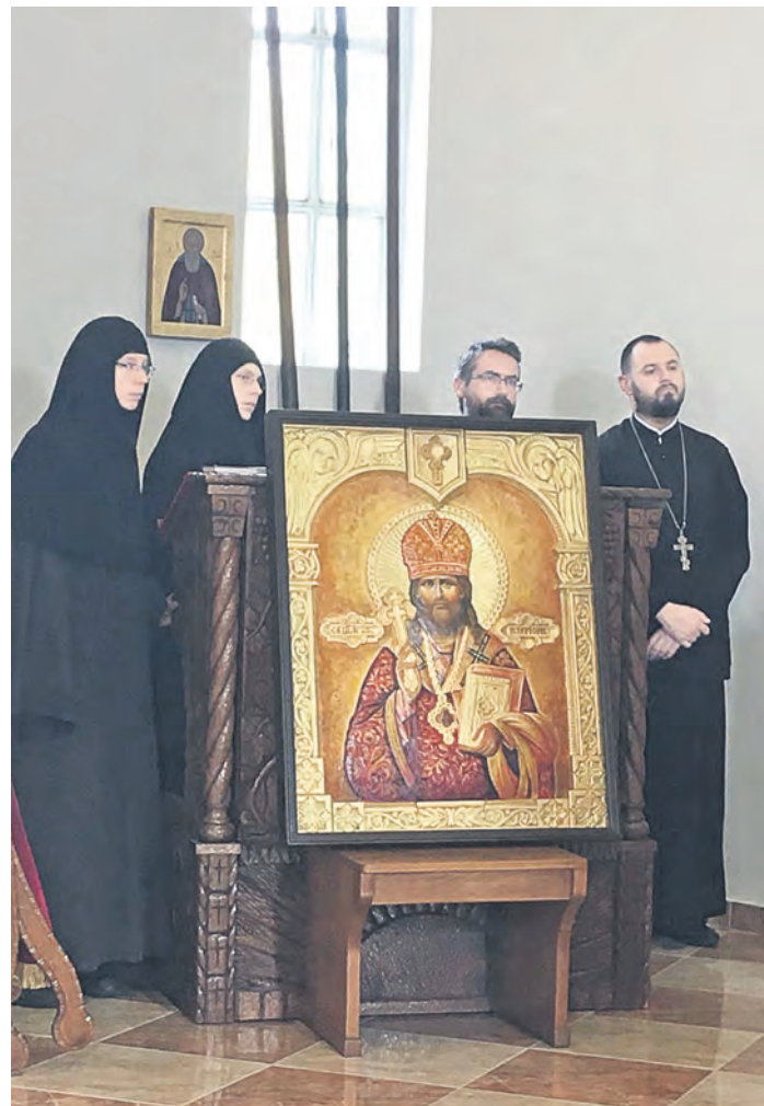
Икона священномученика Илариона, подарок орчан монахам Ясеноваца

Мария Александрова