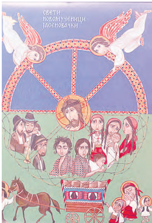
Картины монахинь, наших современниц