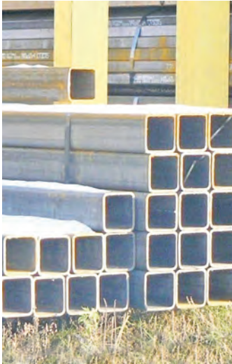
В этот раз под удар попали трубы

Теперь американцы повышают пошлины на корейские трубы, которые изготавливаются из толстолистовой стали Posco. Именно на этом основании были ранее введены тарифы в размере от 18,77 до 47,62 процента на нефтегазопро-