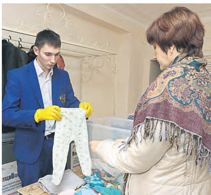
Пожертвованная одежда получит вторую жизнь

– Главное требование – чтобы вещи были чистыми, упакованными в пакеты. Принимаем все, кроме нижнего и постельного белья, колготок, носков. Регулярно проводим выемку из контейнеров, так что ассортимент благотворительного магазина пополняется постоянно.