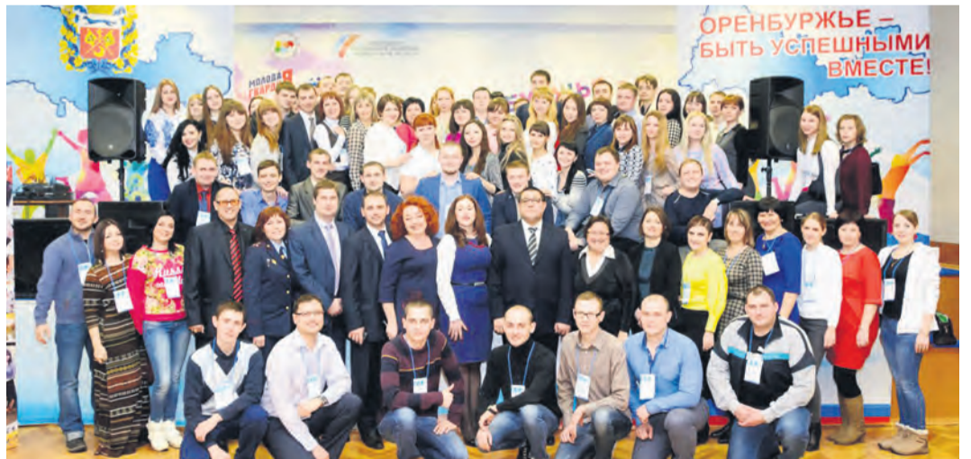
Ежегодный форум «Рифей» – отличная стартовая площадка для талантливой и целеустремленной молодежи

Традиционно на «Рифее» прошел «конвейер молодежных