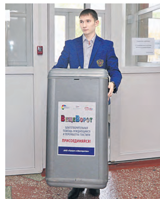
Организаторы устанавливают контейнер в НПК

Мария Александрова