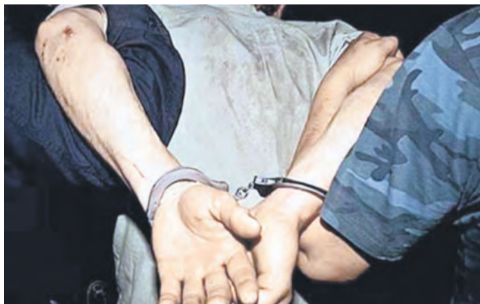
Давление на свидетелей не спасло убийцу от задержания

Подсудимый со своей сожительницей, ее братом, а также еще одной девушкой устроили поход по питейным заведениям города, в которых активно употребляли алкоголь. Ближе к вечеру компания решила переехать в квартиру, где проживал обвиняемый, и продолжить банкет там. Трагическая