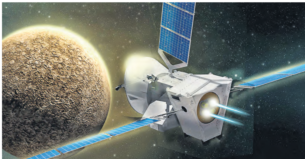
Корректировать полет корабля будут с помощью ионных двигателей последнего поколения

Еще одна цель для наблюдений – неглубокие пустоты на поверхности планеты. Пока что ученым неясно их происхождение, приблизиться к загадке и помогут инструменты МРО: аппарат сможет провести детальный химический