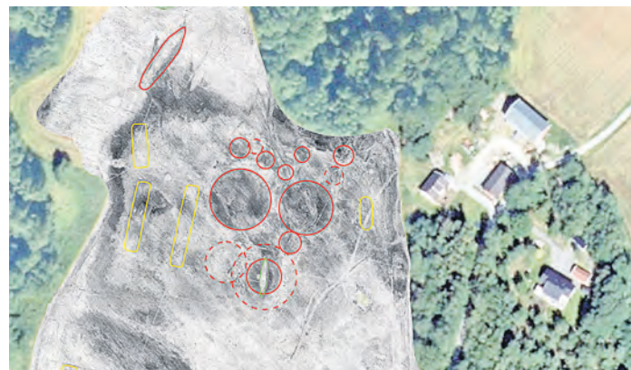
Корабль обнаружили всего в нескольких десятках метров от жилого дома