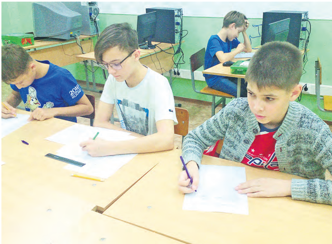
На теоретическом этапе школьники сделали первый шаг на пути к победе в олимпиаде

Детско-юношеская школа радиоэлектронного конструирования станции юных техников провела первый этап технической олимпиады «ЭЛЕКТРОНИК +».