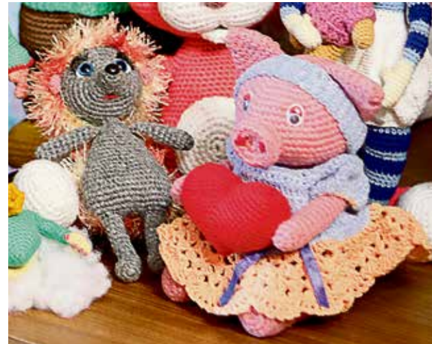
▶ С этой Свинки всё и началось