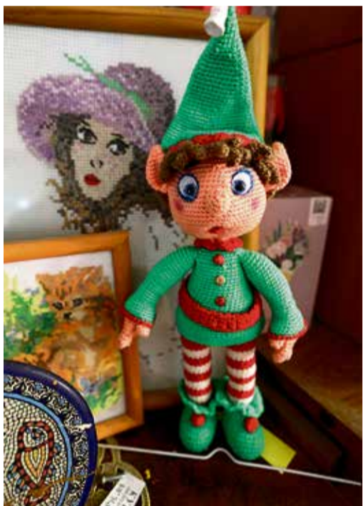
▲ Для устойчивости стопы у куклы из пластмассы