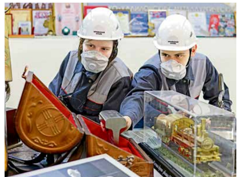
▲ Заглянуть за страницы учебника, увидеть реальное производство и ещё раз подумать о выборе профессии позволяют экскурсии. Уральская Сталь всегда открыта для молодёжи