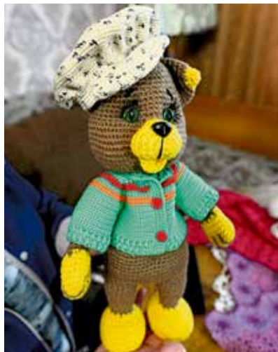
◀ У каждого персонажа Ларисы свой характер. Кепочка набок выдаёт игривый нрав мишки