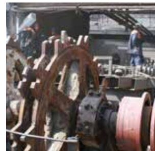
▲ Усилие, которое передаётся через эту звёздочку, позволяет привести в движение несколько десятков тонн стальной ленты конвейера

Вслед за доменным крупные ремонты пройдут в агломерационном цехе. Здесь обновят четвёртую агломашину и капитально отремонтируют седьмой участок с заменой циклонов-540.