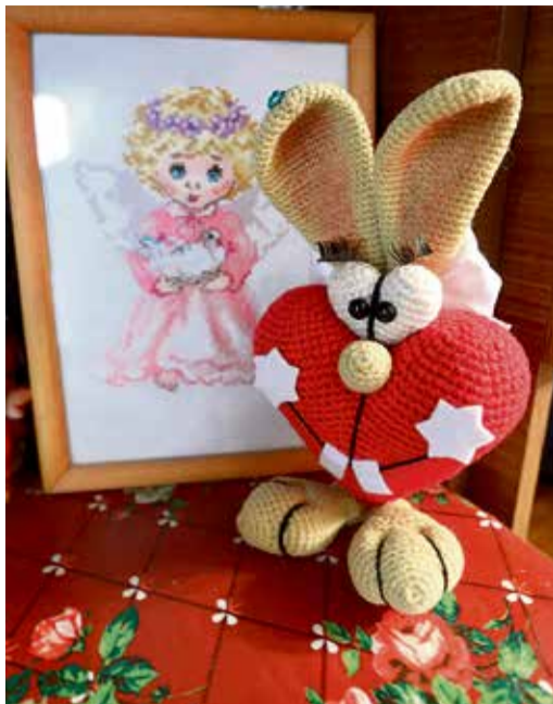
◀ Такое сердечко ко Дню всех влюблённых понравится любой девушке