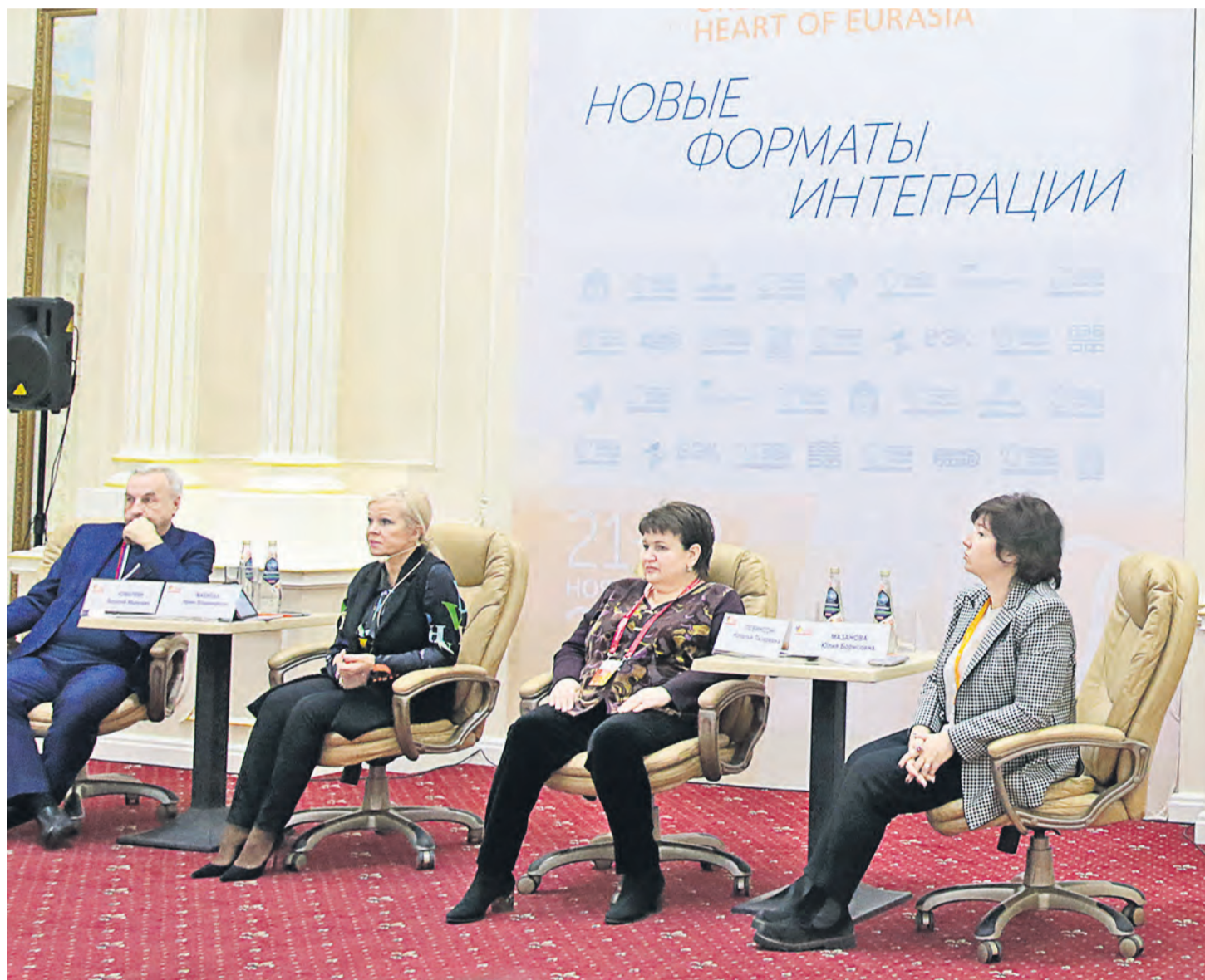
▲ Благодаря Металлоинвесту Новотроицком накоплен уникальный опыт диверсификации экономики моногорода и развития комфортной среды