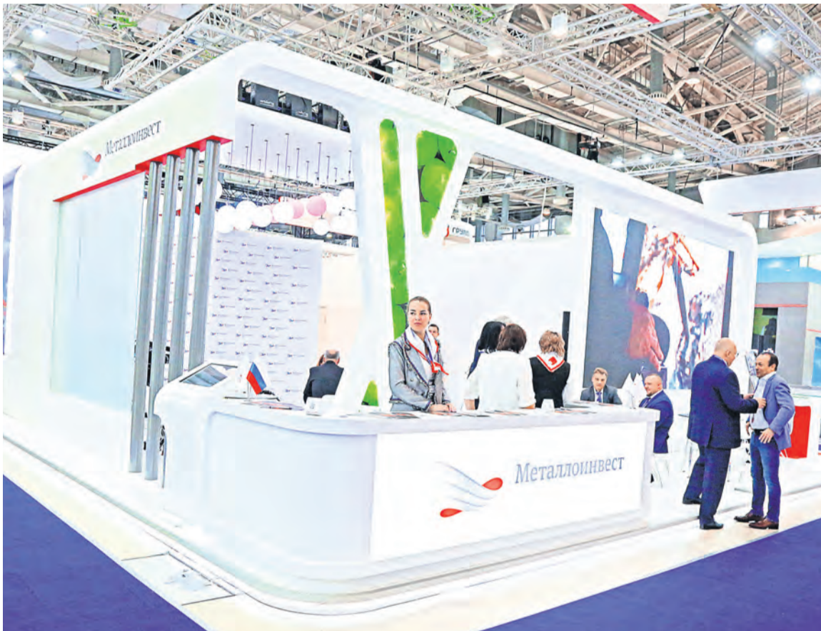
▲ Metalloinvest — один из ключевых участников выставки, а стенд компании — в числе лучших

Компании из 34 стран мира представили многообразие продукции чёрной и цветной металлургии, современного оборудования и технологий для инновационного развития на 25-й Международной промышленной выставке «Металл-Экспо'2019» в Москве. В их числе и Metalloinvest.