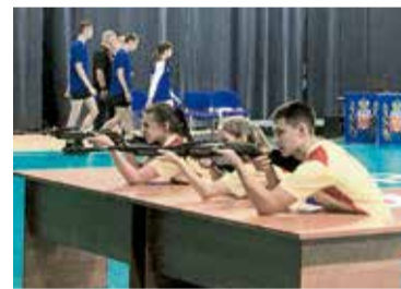
▲ Огневой рубеж стал самым трудным для команды будущих металлургов из политехнического колледжа

Какой тест был самым трудным? Ребята не сговариваясь отвечают: стрельба. И это вполне объяснимо.