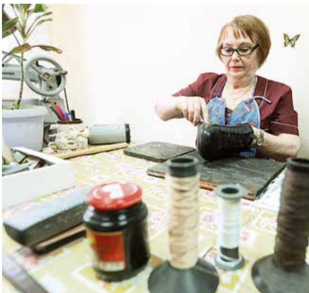
▲ Подстричься или отремонтировать обувь в «Заботе» по ценам значительно ниже рыночных

В планах — создать на базе центра площадку для пенсионеров, куда можно будет просто прийти, позаниматься рукоделием, поиграть в настольные игры, обсудить литературу и последние новости. Помещение у «Заботы» есть, осталось найти средства на мебель и открытие штатной единицы администратора клуба.