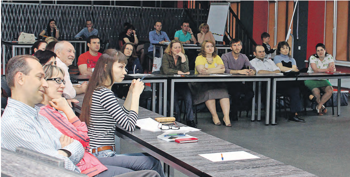
Школа предпринимательства – территория свободного общения бизнесменов и новичков