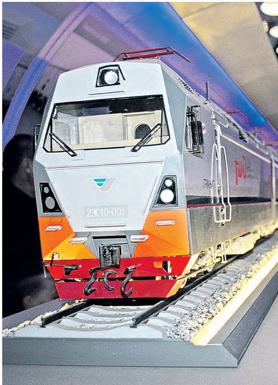
Макет современного электровоза можно не только разглядывать, но и трогать