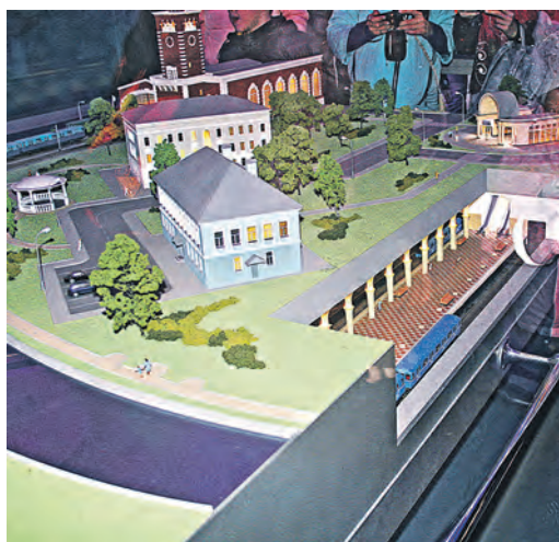
Точная копия железнодорожного вокзала Адлера