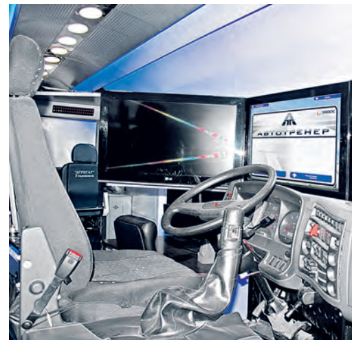
Аналог кабины машиниста современного локомотива, где тренируются будущие машинисты