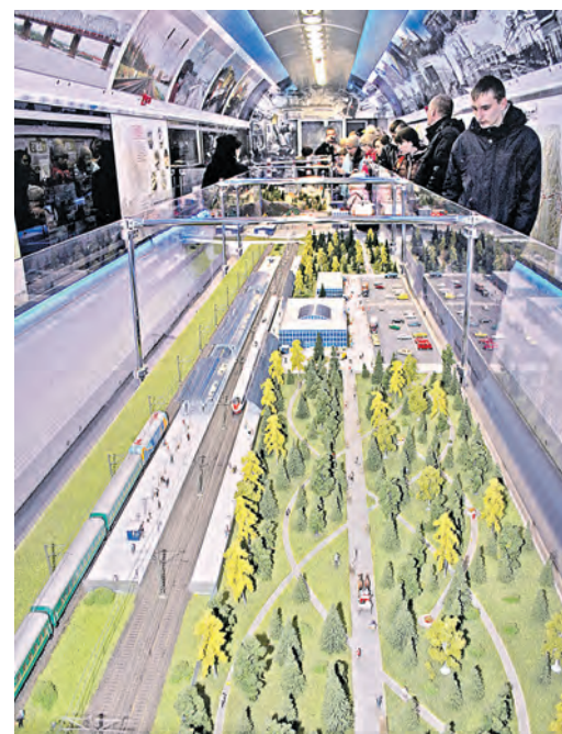
Мечта мальчишки – маленькая железная дорога

Состав из 12 новеньких вагонов расположился на первом пути станции «Орск». Этот необычный поезд-музей на колесах останавливался и принимал посетителей на шести станциях Южно-Уральской железной дороги. Экспозицию увидели жители Оренбурга, Бузулука и городов Курганской области. А сразу после Орска передвижная экспозиция направилась на Северный Кавказ.