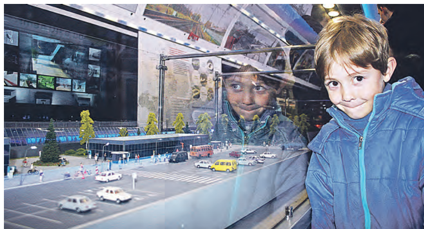
От копий современных локомотивов, что ездят по рельсам, в восторге и взрослые, и дети