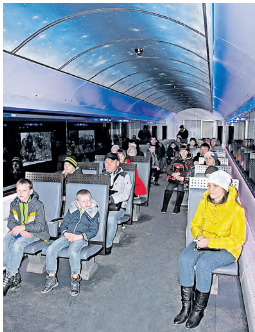
Осмотр выставки для посетителей начался с лекции о современных тенденциях в развитии РЖД

Два дня на вокзале в Орске гостила экспозиция, которая разместилась в передвижном выставочно-лекционном комплексе ОАО «РЖД». Посетители смогли ознакомиться с интересной выставкой, повествующей об истории развития российских железных дорог и о том, чем они живут сегодня.