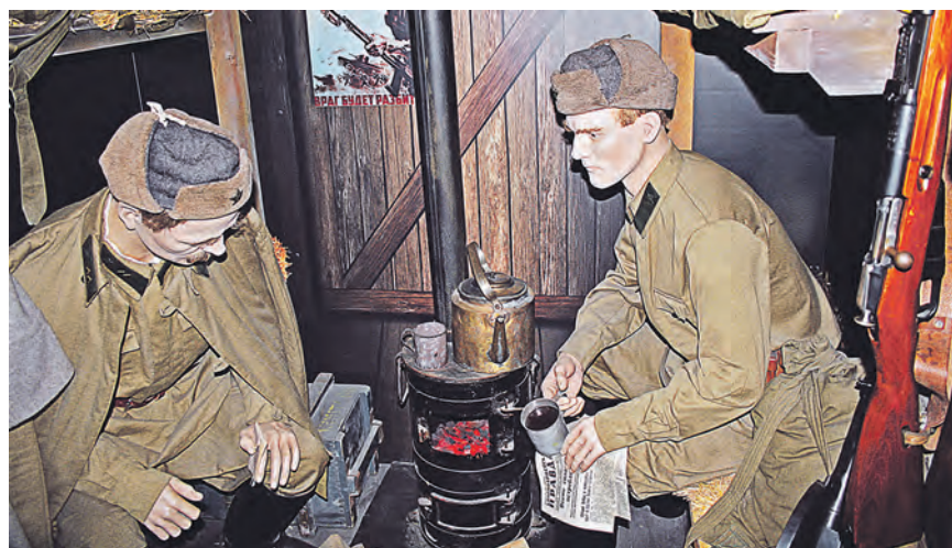
В одном из вагонов макет теплушки времен Великой Отечественной войны