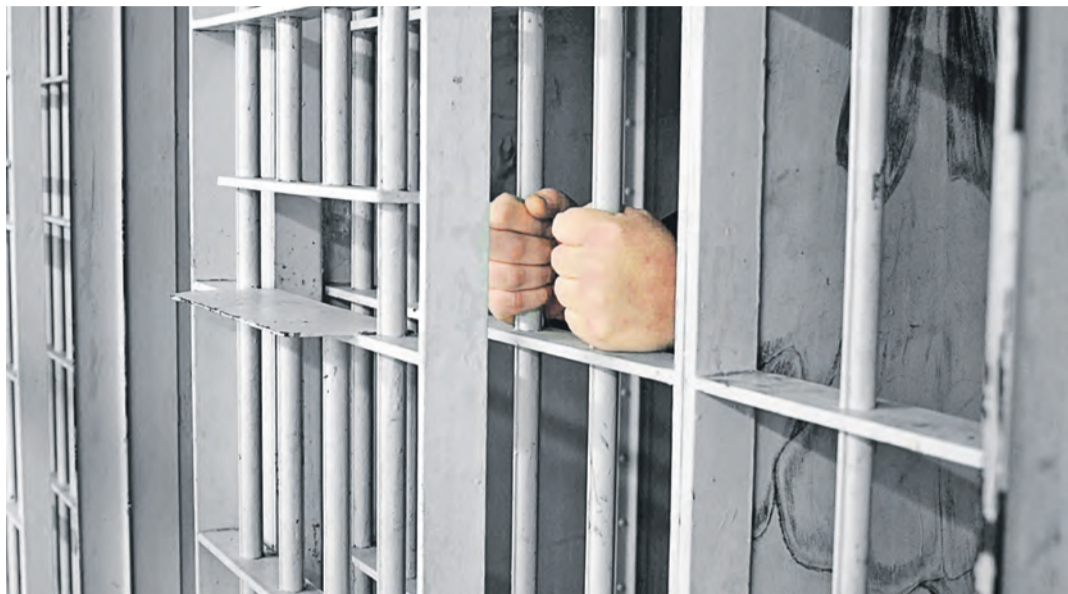
Ограничение свободы человека не должно вести к тому, что его можно безнаказанно унижить или даже убить, уверены правозащитники