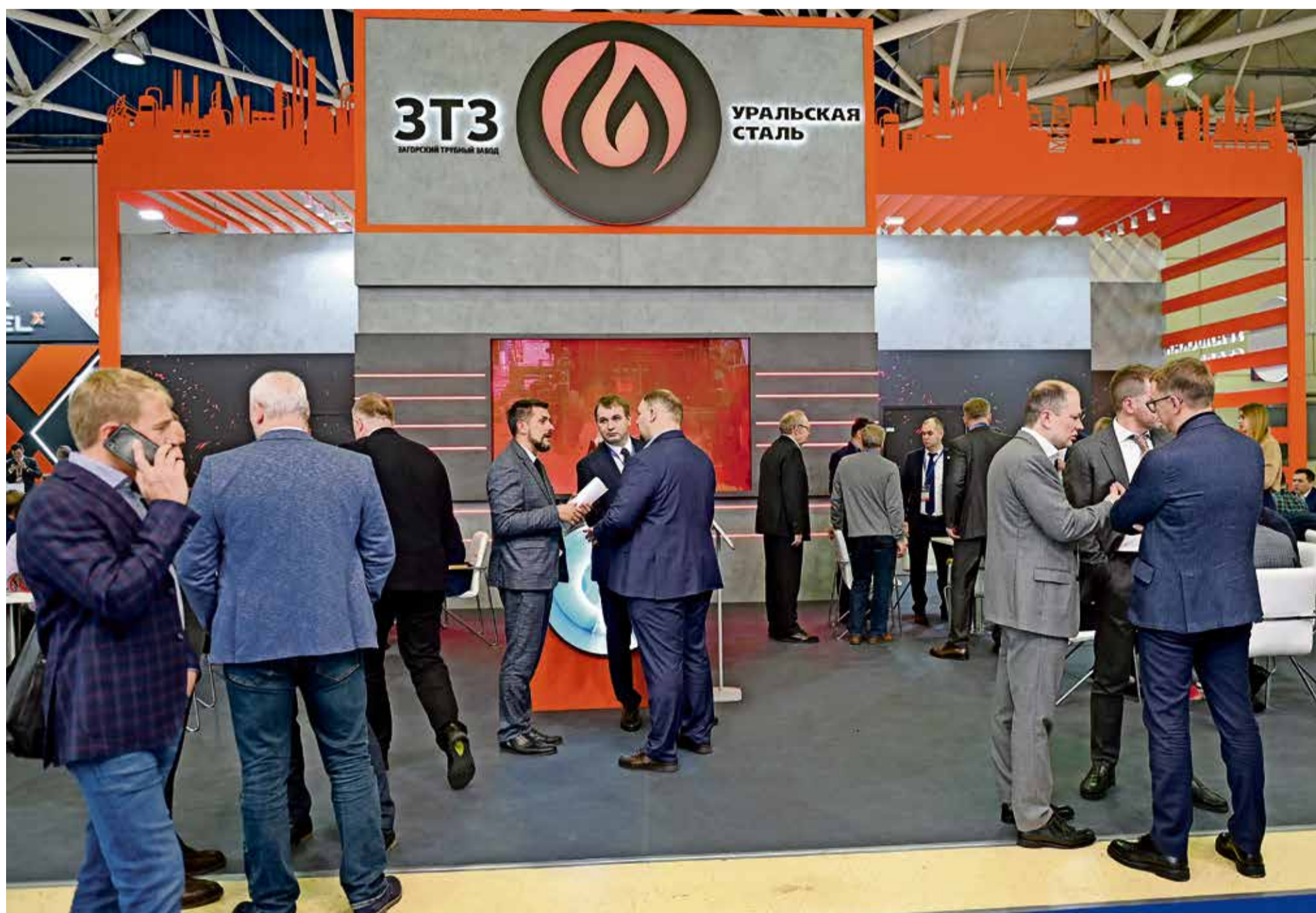
▲ Стенд УК «Уральская Сталь» привлекал профессионалов возможностью обсудить с первыми лицами компании перспективы и технологии производства биметаллических труб и холодостойкого проката