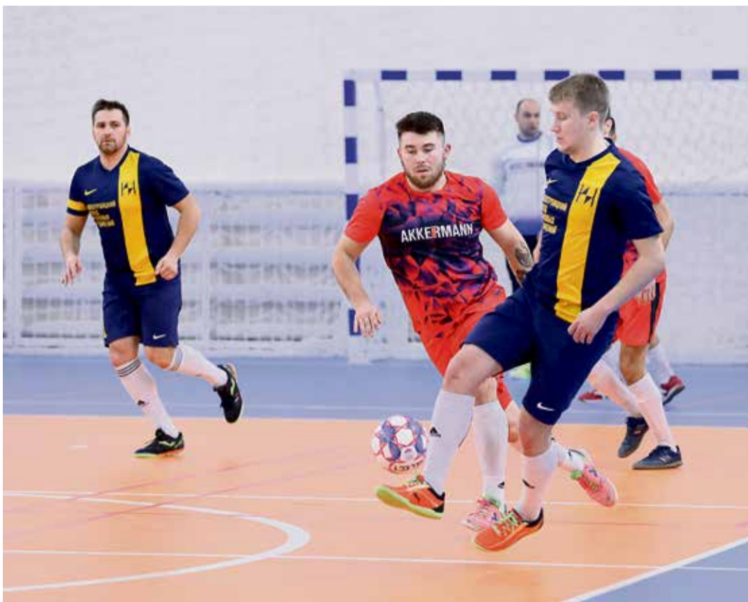
▲ Команда химзавода играла элегантно: выверенные передачи, деликатная обработка и заслуженное серебро «Уральской инициативы»

И организаторы, и болельщики отмечают: перезагрузка «Уральской инициативы» прошла успешно. Здесь было всё, за что мы любим спорт: накал эмоций, желание играть до последнего и эйфория побед. Не было одного — проигравших.