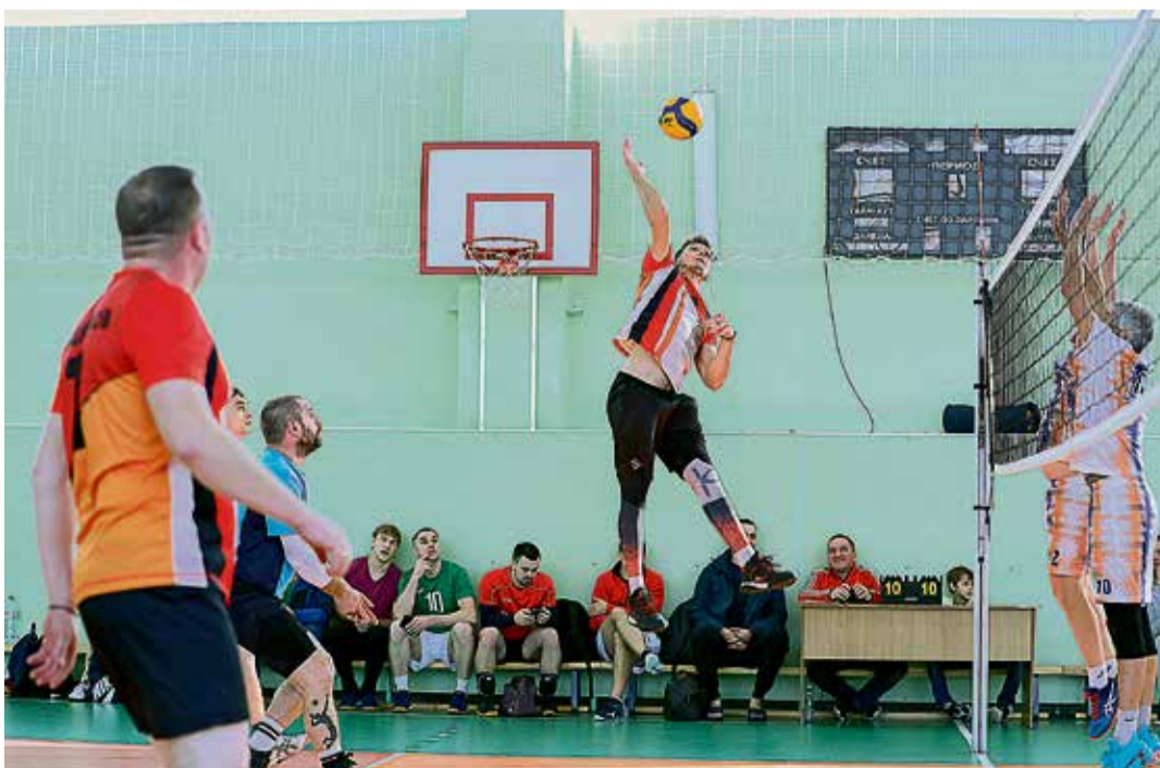
▲ Противоядие против размашистых атак «Боевого братства» в этот раз нашла только команда орчан, которая и забрала золото турнира