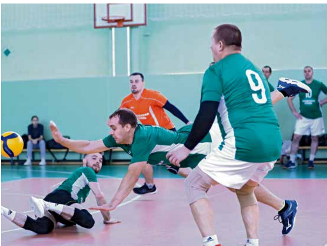
▲ В «бронзовом» матче против «АККЕРМАНН ЦЕМЕНТА» волейболисты Уральской Стали не раз спасали, казалось бы, безнадёжную ситуацию