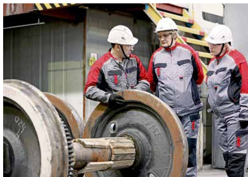
◀ Педагоги НПК не только учат, но и учатся: Уральская Сталь устраивает для них практикумы прямо в структурных подразделениях

Областное министерство образования подготовило рекомендации, которые помогут педагогам