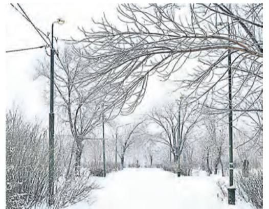
Идешь по такой аллее, и кажется, что должно произойти какое-нибудь чудо...