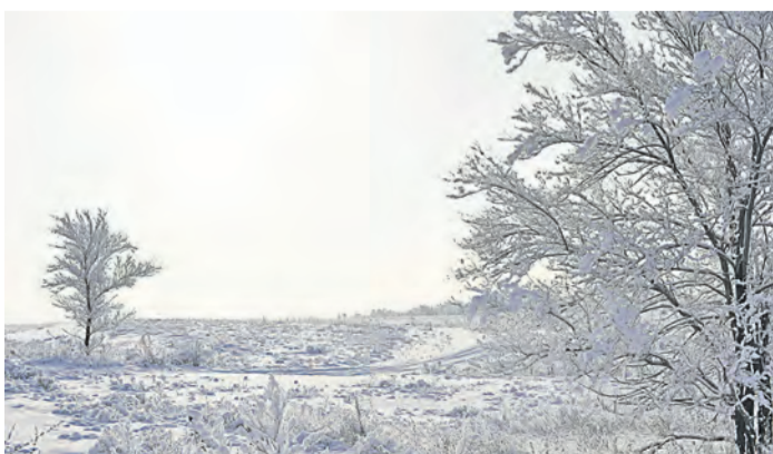
Через объектив фотограф видит нечто прекрасное – то, что не заметно другим