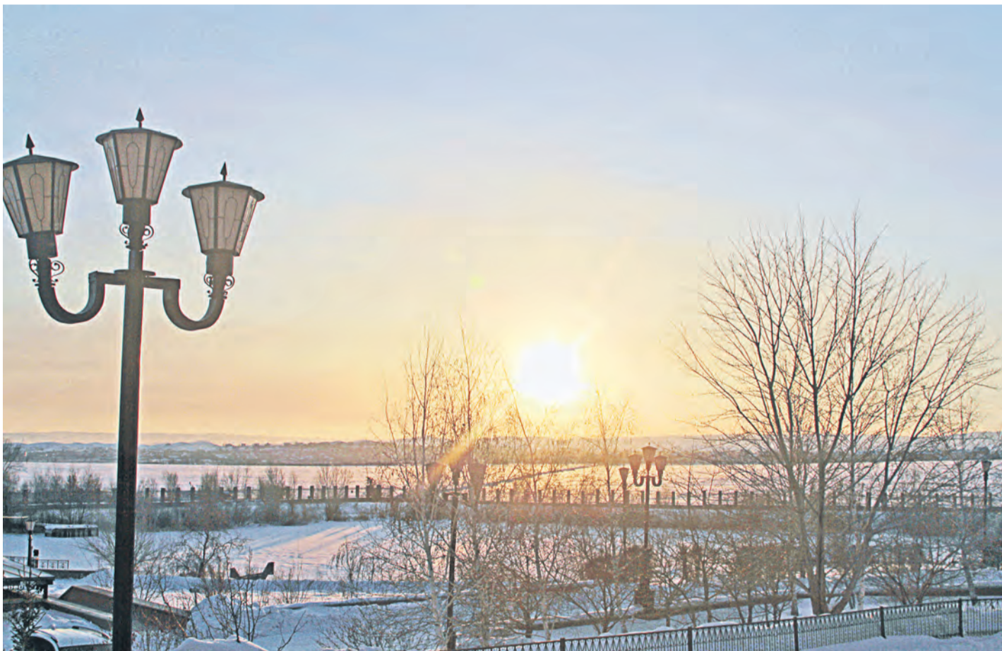
Зимний закат задумчив. Он так и манит разгадать его тайны