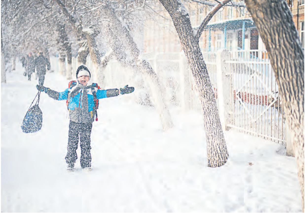
Пока взрослые жалуются на холод, дети получают от зимы настоящее удовольствие, и чем больше снега – тем лучше! Главное – варежки не потерять и... не заболеть

Ксения Есикова