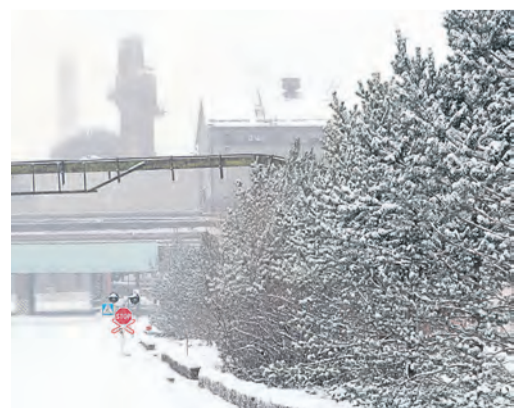
Облаченный в белое, комбинат прекрасен как никогда