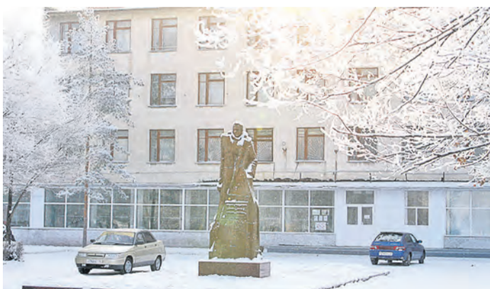
Когда светит солнце, то иней на ветках сверкает, словно он усыпан бриллиантовой крошкой