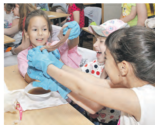
Выжмем из пищи все питательные вещества!