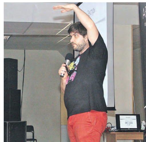
Братья Захаровы умеют удивить интересными фактами и парадоксальными суждениями

Данил Илюшкин Татьяна Комендантова Полина Шмелева