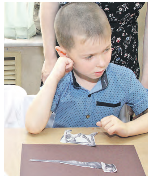
Ноги выбраны. Как их с туловищем-то состыковать?