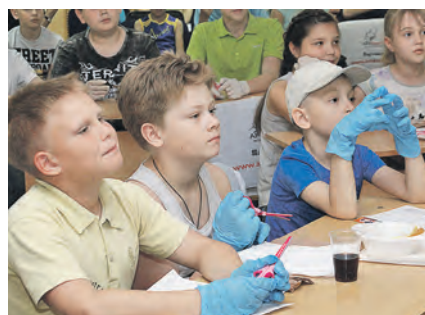
Наши опыты требуют специальной экипировки. Надеваем перчатки!