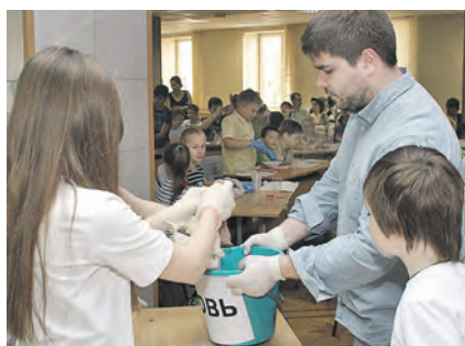
А кровью, которая забирает питательные вещества, послужила газировка