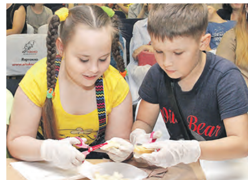
Для моделирования пищевого комка в ход пошли натуральные хлеб и сыр