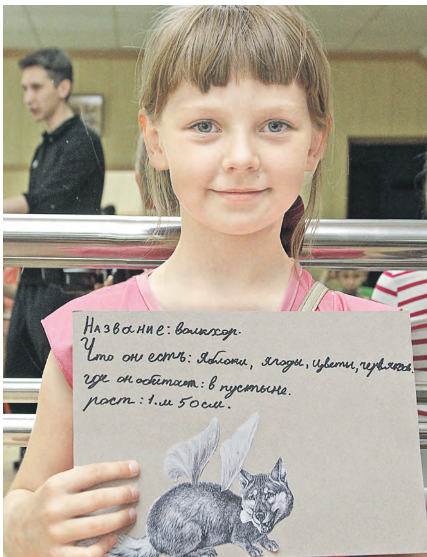
Знакомьтесь: мое животное. Что-то у него от волка, что-то – от хорька

Ранее подобные мероприятия с большим успехом прошли в Белгородской и Курской областях. Партнерами проекта по традиции выступают музей современного искусства «Гараж» и фестиваль актуального научного кино «ФАНК». Прибавьте сюда таких известных телевизионных популяризаторов науки, как братья Захаровы!