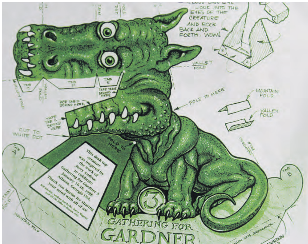
Трехмерность модели дракончика, сделанного из этой заготовки, усиливается под определенным углом света. В этом юные новотроицкие экспериментаторы убедились на собственном опыте