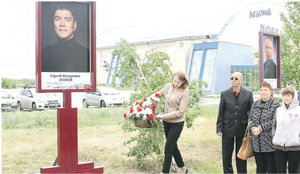
Теперь у подножия твоей стелы всегда живые цветы