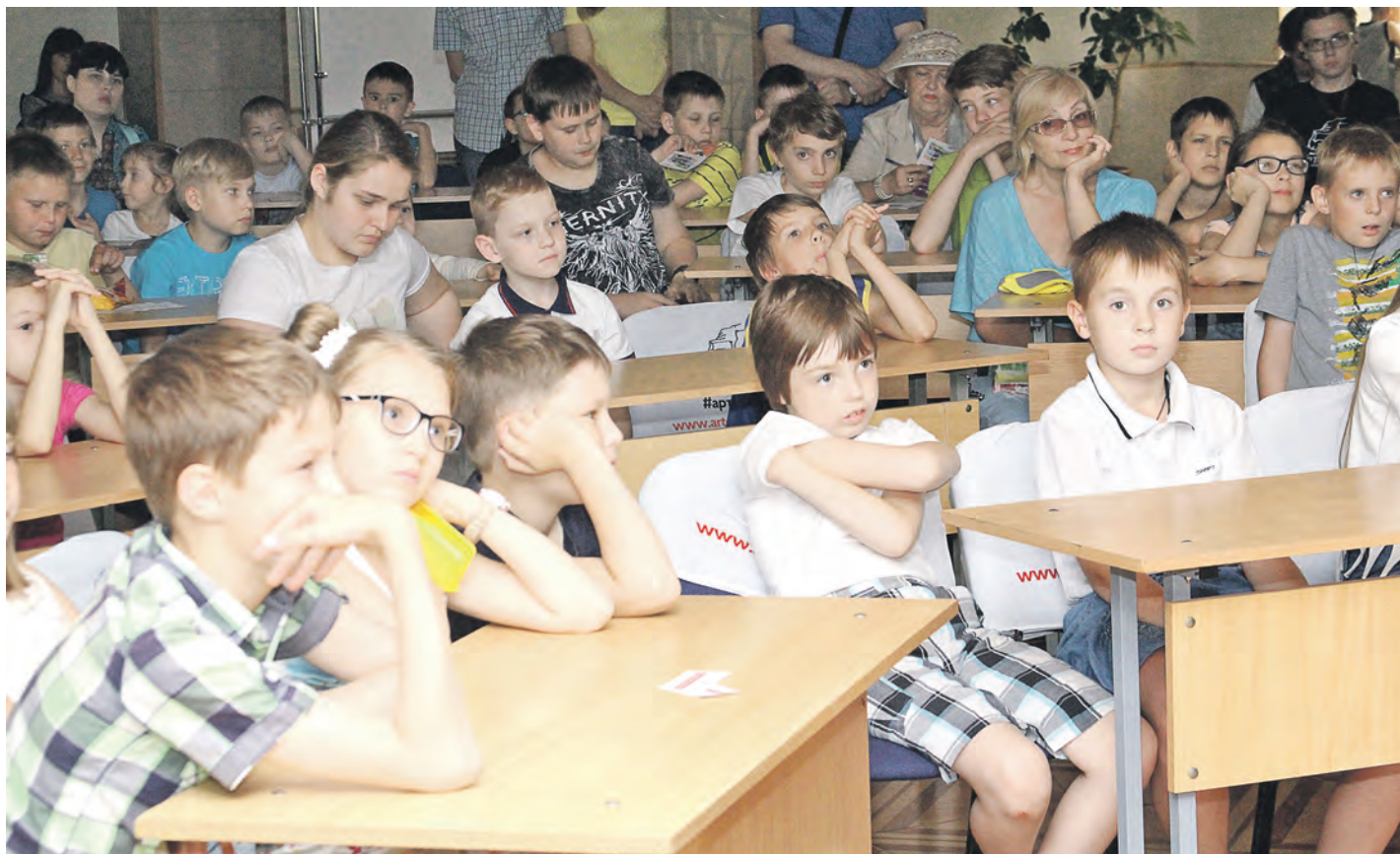
Едва ведущий умолкал, как юные новотроицкие почемучки забрасывали его вопросами