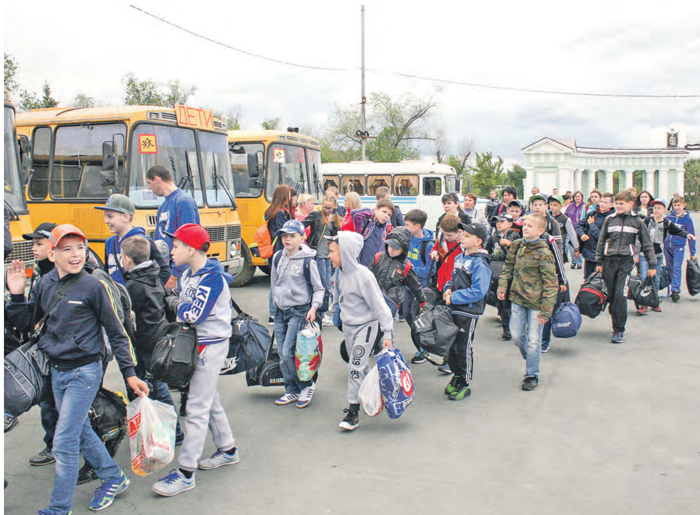
Ура! Школьные задания и наставления родителей позади. Впереди отдых с друзьями на природе.

В понедельник стартовала первая смена в лагере отдыха для детей и подростков «Родник». В его корпусах и на спортплощадках уже раздаётся веселый смех детворы.