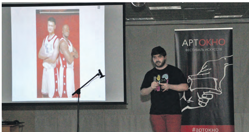
С иллюстрациями лекция понятнее