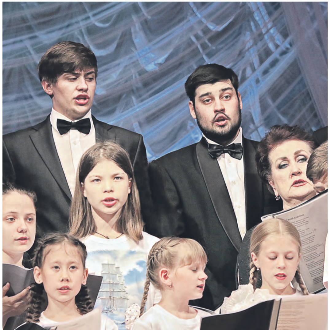
Сводный хор объединил всех: мужчин и женщин, пионеров и пенсионеров

Александр Проскуровский