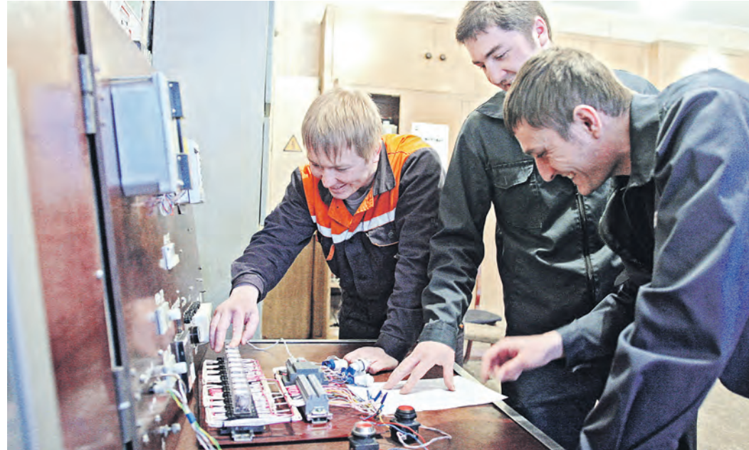
Конкурс рацпредложений по энергоэффективности собирает самых креативных сотрудников Металлоинвеста

Одной из задач конкурса является оптимизация потребления энергоресурсов, что поз-