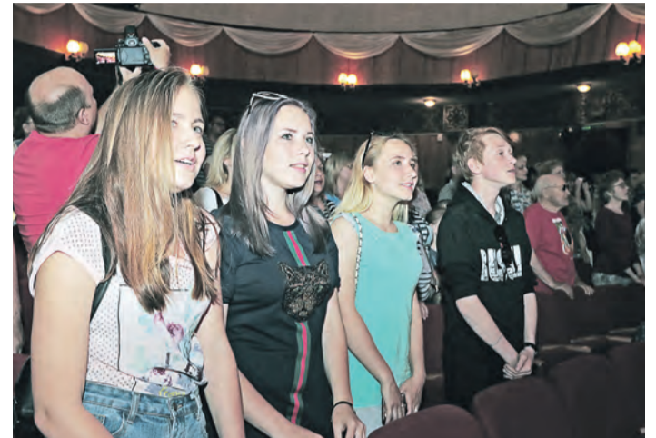
«День Победы» зал пел стоя, все испытали единение

Исаака и Максима Дунаевских. Кстати, никого не смущало, что в нетленных шлягерах «Я люблю тебя, жизнь!», «Московские окна» или «Городские цветы» стихи идут от единственного числа, а поются всеми вместе. Потому что чувства лирического героя мы полностью разделяем.