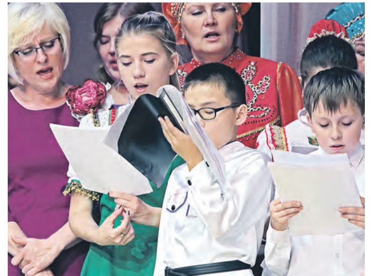
День славянской письменности дает уникальную возможность выступить вместе хористам разных учреждений