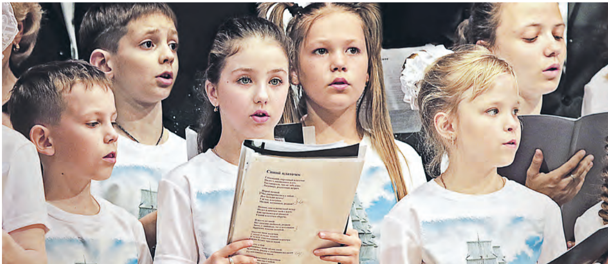
Самым массовым получилось участие ДШИ, где два хора: учащихся и педагогов