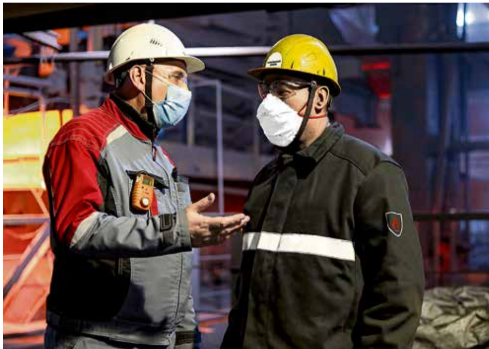
▲ Аглофабрика традиционно была одним из самых пыльных производств комбината. Новая система фильтрации вскоре снимет этот вопрос с повестки