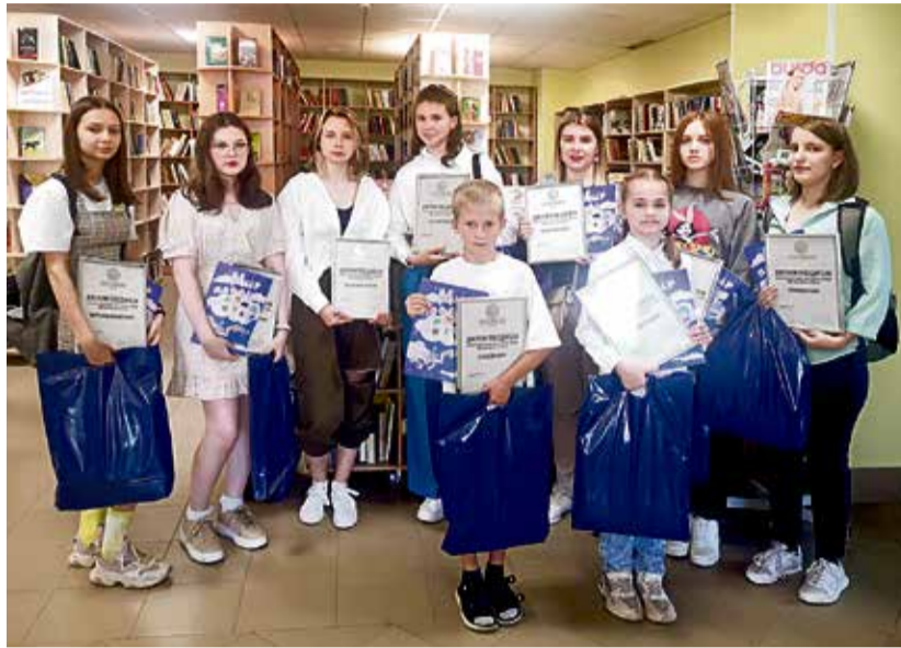
Юным участникам проекта в день презентации сборника вручили грамоты и памятные призы

Ранее компания «АККЕРМАНН ЦЕМЕНТ» объявляла открытый конкурс, предлагая детям книгу. Встреча писательницы с читателями и юными художниками состоялась 7 июля в Библиотеке семейного чтения.