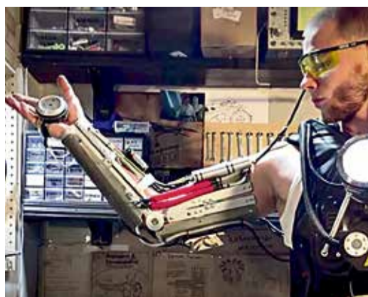
▲ Экзоскелет за столетие эволюционировал от женских корсетов из китового уса до гидромеханических устройств с электронными нейронами