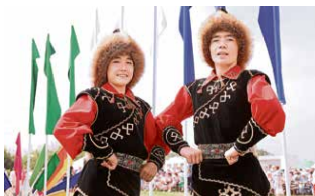
▲ Башкирский богатырь — батыр (он же алпамыша) всей своей позой должен демонстрировать силу и независимость