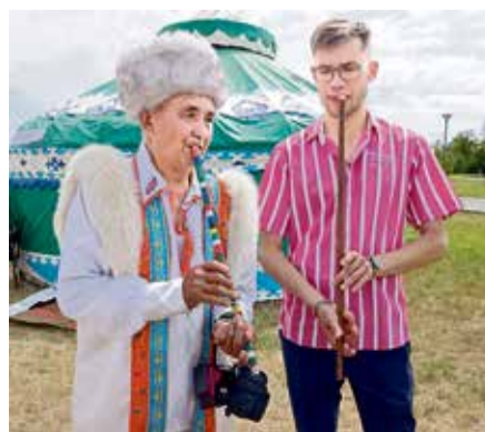
▲ Лучшим материалом для изготовления курая башкиры считают ствол реброплодника уральского — растения из семейства зонтичных

смысл, — рассказывает мастерица. — Например, в башкирских есть ромбы — символ урожая, а обилие красного цвета — это женское начало и сама жизнь. Множество монет на одежде не только символизирует достаток, когда-то эта деталь костюма имела и вполне утилитарную функцию: в старину женщины рассчитывались этими деньгами, срезая их со своих нагрудников.