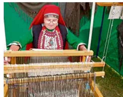
▲ Ткацкие станки в некоторых семьях до сих пор хранят как реликвию, а чуть больше ста лет назад они были настоящим средством производства

По давней тюркской традиции сабантуй (буквально — «праздник плуга») проходит после окончания весенних полевых работ. Первое упоминание о нём встречается в хронике путешественника Ибн Фадлана в 921 году нашей эры, но сам праздник гораздо древнее. Танцы и песни, щедрые угощения, развлечения для взрослых и детей — вот что такое сабантуй сегодня.