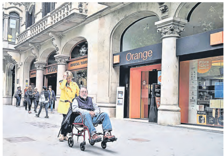
▲ Человек в инвалидном кресле на улицах города ни у кого не вызывает удивления

Городская операционная система (City OS) – аппаратно-программная платформа, совместно используемая всеми ветвями городской власти и позволяющая наращивать свой функционал с помощью различных приложений.