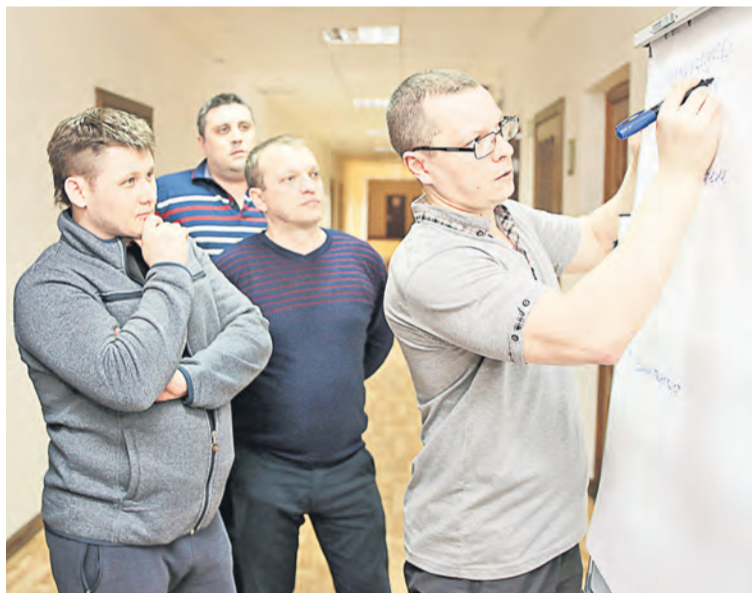
▲ Прежде чем идти на производство, навигаторы учились владению инструментами Бизнес-Системы на специальных курсах

ное обучение, и практически сразу – в бой. Первоочередная задача наших штабов – реализация одного из инструментов Бизнес-Системы – «Диагностика производства», который подразумевает анализ загруженности оборудования, рабочего времени, движения материальных потоков, бюджета. Наш штаб анализирует работу ФЛЦ на примере 2018 года. Итогом диагностики станет построение процессно-стоимостной модели, где будут расписаны финансовые потоки по направлениям: товарно-материальные ценности, электроэнергия, газ, фонд оплаты труда, образование отходов. Мы будем видеть, сколько каждый процесс потребляет ресурсов и как влияет на общую картину производства. К примеру, определится процесс, на который уходит много затрат материальных и временных, значит,