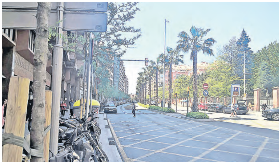
При взгляде вверх глаз не цепляется за провода, все сети убраны в лотки вдоль тротуаров