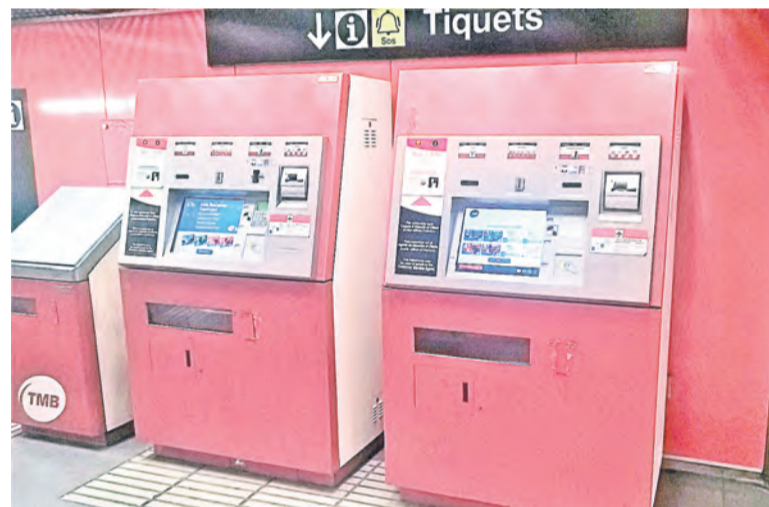
▲ Автоматы по продаже проездных на все виды общественного транспорта оборудованы тактильными плитками и шрифтом Брайля

Муниципальные власти Барселоны постоянно совершенствуют технологии уборки города. Как показывают отчеты, на душу населения приходится по 166 евро из бюджета, предназначенного для уборки и озеленения улиц города. Всего на содержание улиц каталонской столицы требуется 177 миллионов евро в год. Плюс на сбор мусора ежегодно выделяется 90 миллионов евро. В общем на содержание в чистоте полуторамиллионной Барселоны, расходуется 267 миллионов евро (по нынешнему курсу – около 19 млрд рублей). Чтобы понять, дорого это или нет, давайте посмотрим, что делается за эти деньги. Во-первых, по всему городу организован отдельный сбор отходов: пластик, стекло, бумага/картон, органические пищевые фракции – для каждого из них – отдельный контейнер. Сегодня в Барселоне доля перерабатываемого мусора составляет 36 процентов. Поставлена цель увеличить