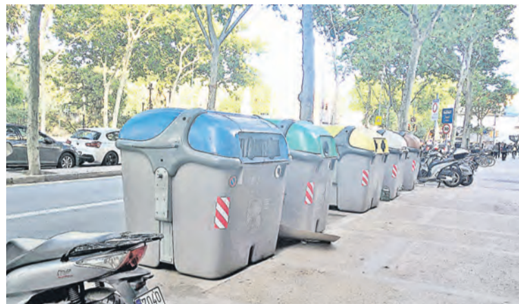
Эти контейнеры сами дадут знать, что наполнились, маршрут мусоровоза автоматически скорректирует электронный диспетчер

Для сбора оброненного мусора используются электромобили: маленькие щеточные машинки бесшумно передвигаются по тротуарам и дорогам, не добавляя городу шума и выхлопов от двигателей внутреннего сгорания.