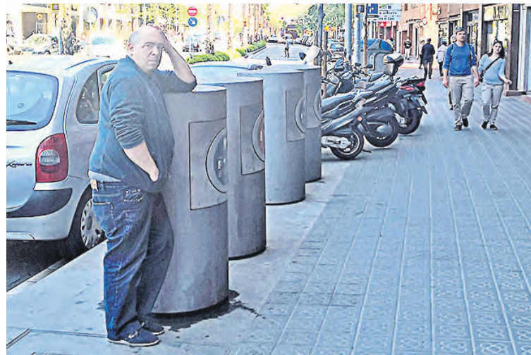
Пневматическая система транспортировки мусора спрятана под городскими тротуарами