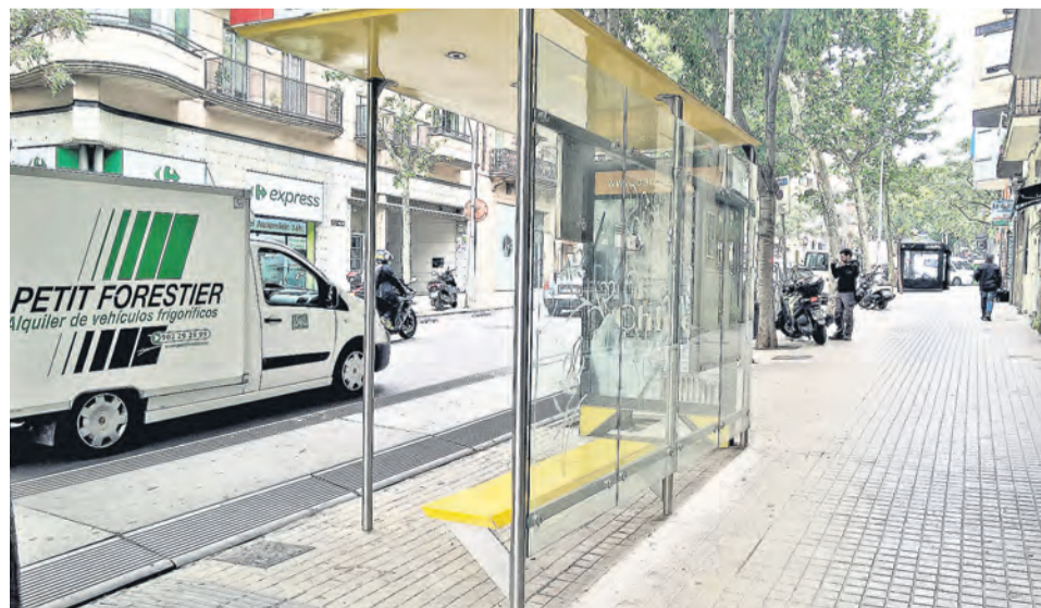
Остановки общественного транспорта не имеют заездных карманов и сочетают в себе минимализм и функциональность