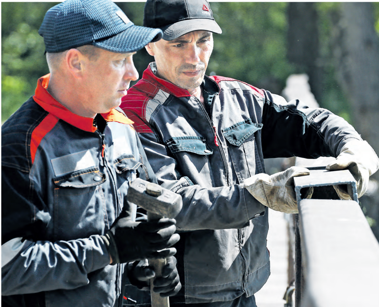
▲ Специалисты ремонтных служб комбината за неделю полностью восстановили целостность ограждений и настила. Теперь мост безопасен для водителей и пешеходов