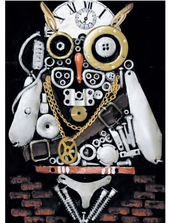
▲ Постапокалиптическая стимпанк-сова от Дарьи Литвиненко — скрытая отсылка к популярным в молодёжной среде компьютерным играм вроде «Сталкера»