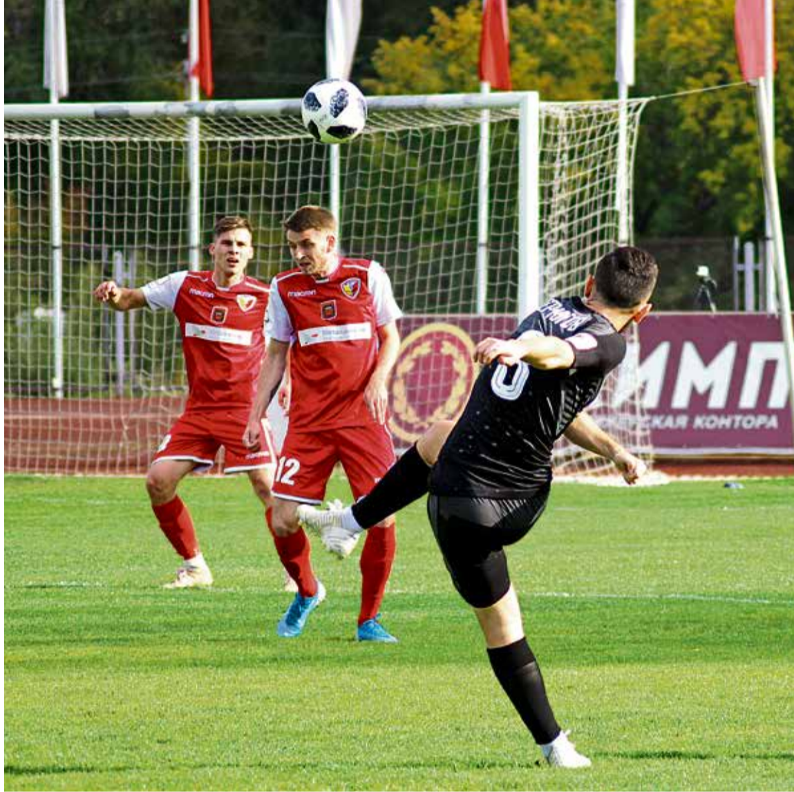
▲ Исход игры с «Акроном» решил длиннющий диагональный пас вратаря гостей