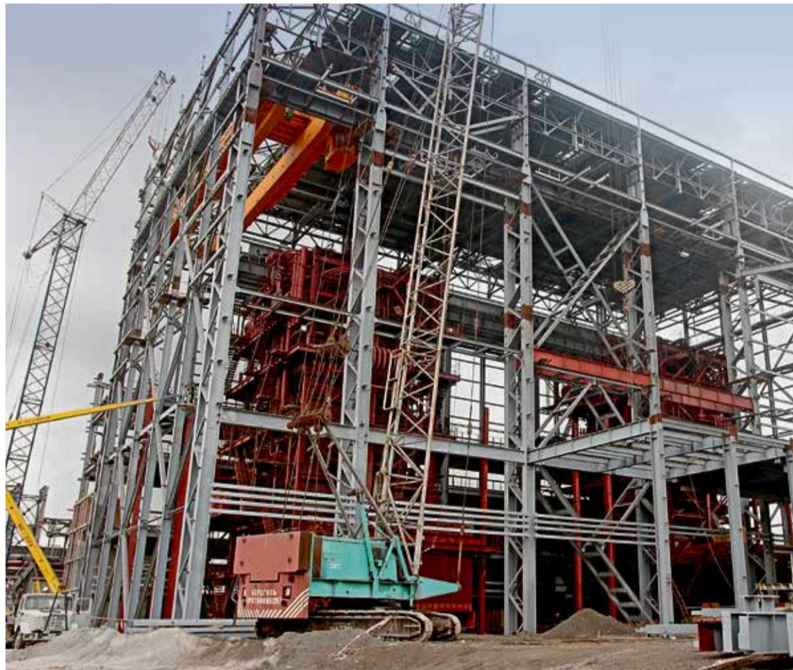
▲ Котлы уже установлены, сегодня вокруг них кипит работа по обвязке коммуникациями

На смену английским пришли отечественные котлы среднего давления модели Е-220. Монтаж агрегатов с серийными номерами 1 и 2 (подобных нет ни на одном предприятии страны), ведётся на Уральской Стали круглые сутки. По словам главного