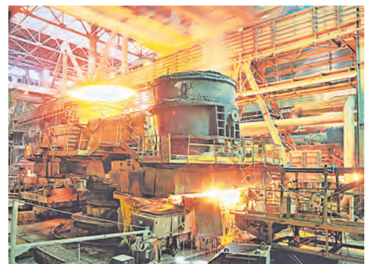
Латиноамериканские металлурги терпят убытки