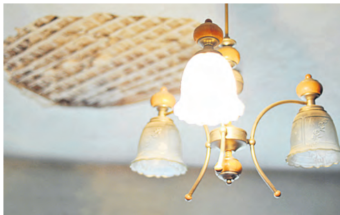
Скрытые продавцом дефекты позволяют законно расторгнуть сделку

Перед тем как ее взор упал на одноэтажный дом Валентины Никифоровой, будущая домовладелица по объявлениям прошла много частных домов, выставленных на продажу. Самым оптимальным вариантом оказался именно последний. Видно было, что Никифорова подготовила дом к продаже заранее, был сделан относительно недорогой, но с вкусом ремонт. С одной стороны это удорожало покупку, но