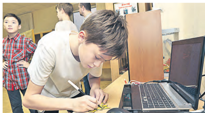
Отзывы на осенних листочках будет хранить «Коробка пожеланий»

Александр Проскуровский