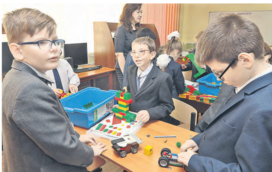
С начала учебного года школьники тренируются на блочном конструкторе