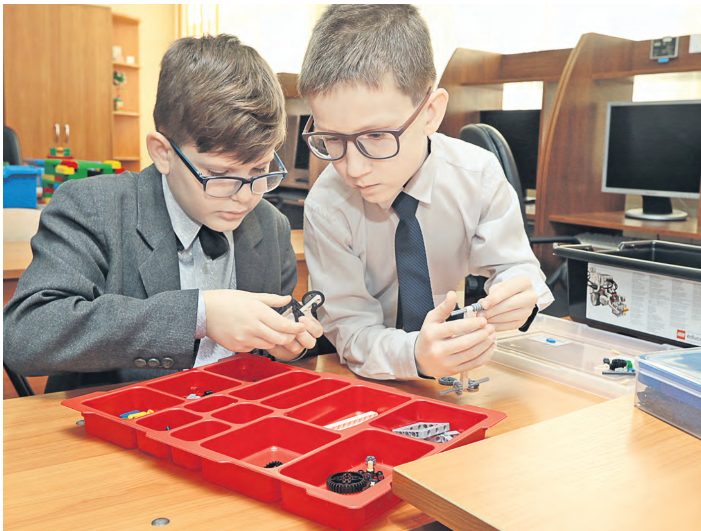
Третьеклассники открывают для себя модульный мир программируемых конструкторов

В новотроицкой специальной (коррекционной) школе-интернате с начала учебного года заработал кружок робототехники, в котором свое возможное призвание ищут ребята с особенностями здоровья.