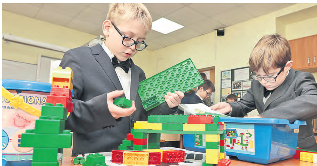
Сложные здания и конструкции – любимая тема мальчишек