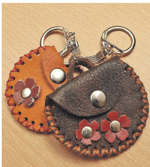
Стильные брелочки ручной работы ждут своих хозяев