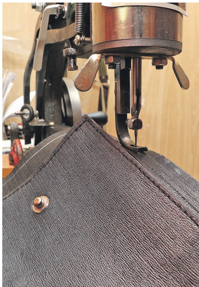
Рождение красоты: стежок за стежком

Марина Валгуснова