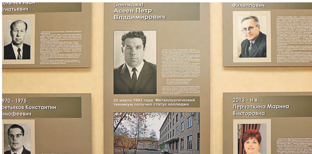
В колледже память о первом и остальных директорах увековечена в музейной экспозиции

В 29 лет брату предложили возглавить открывшийся в