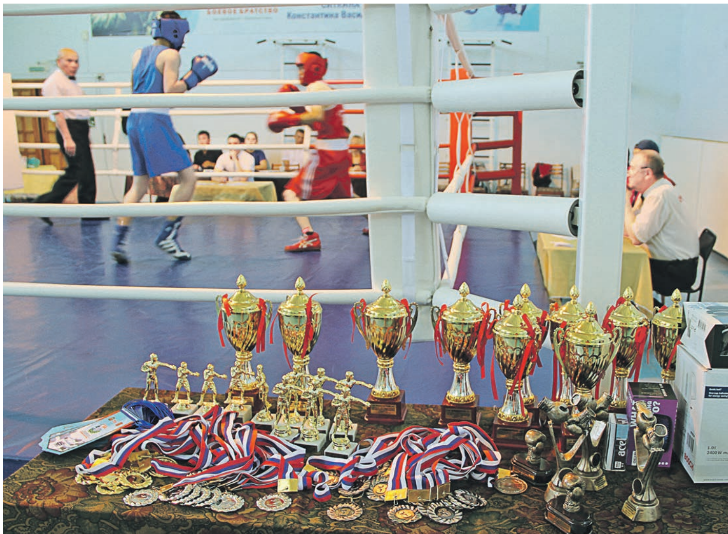
Россыпь наград ожидает своих владельцев, чтобы получить их, мальчишкам пришлось преодолеть усталость и боль