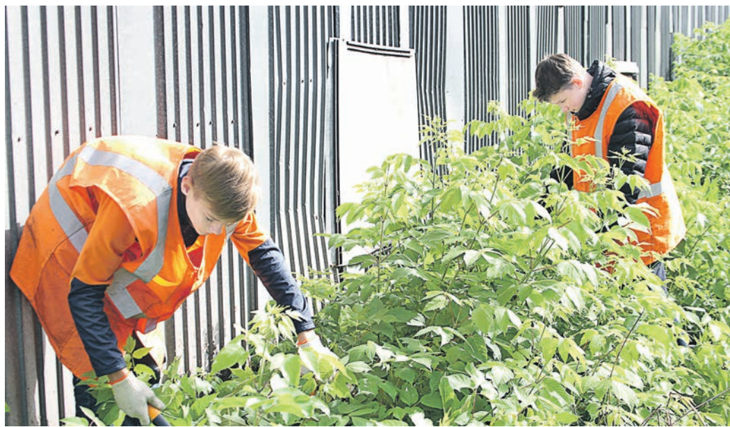
Крупнейшим работодателем для подростков традиционно остается Уральская Сталь

В прошлом году школьники работали в своих учебных за-