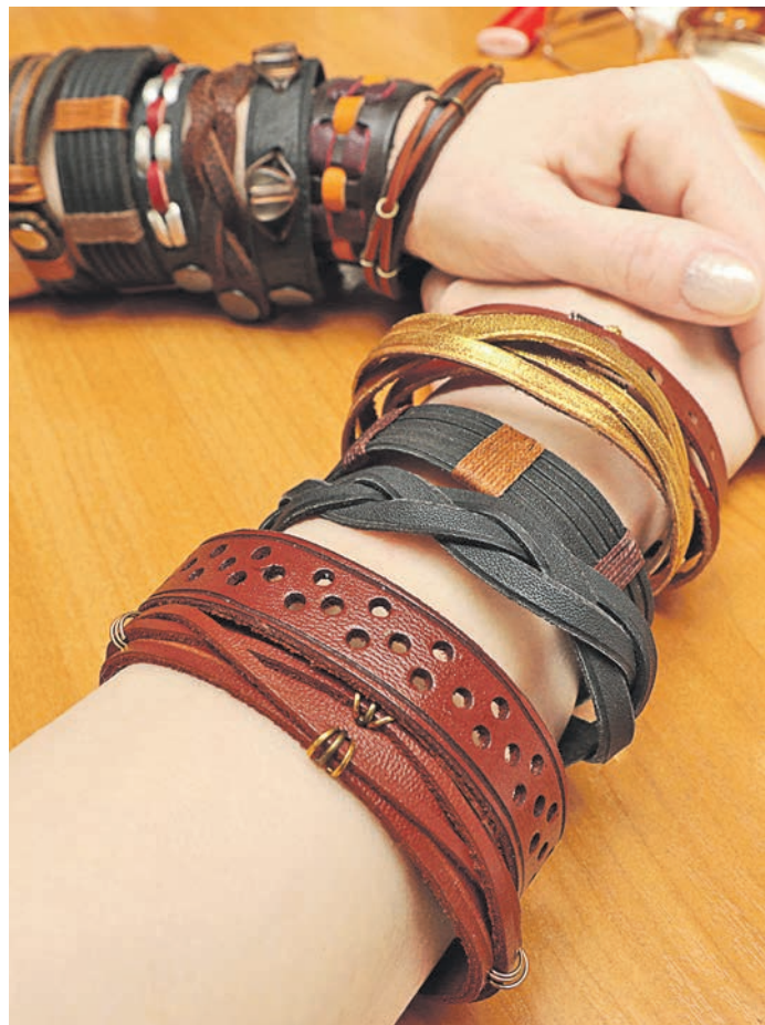
Браслеты пользуются неизменным спросом публики