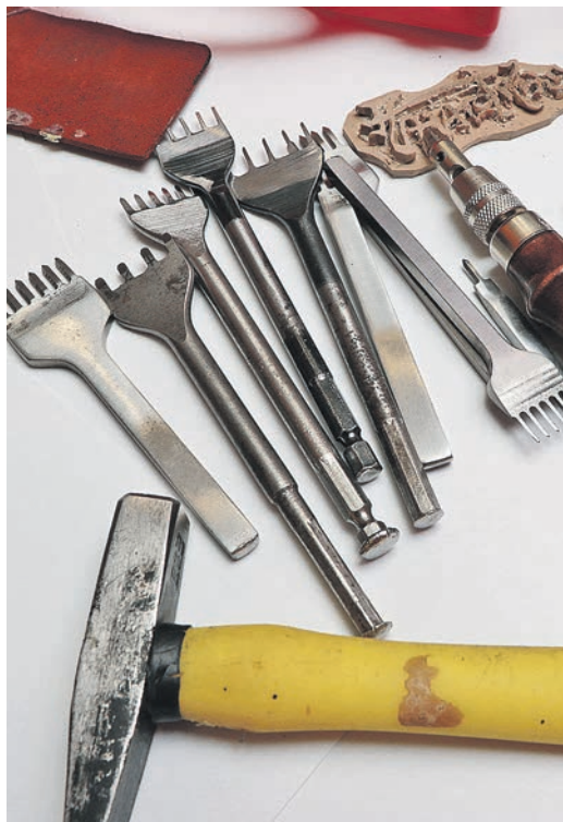
Пробойники – лишь малая часть арсенала мастера