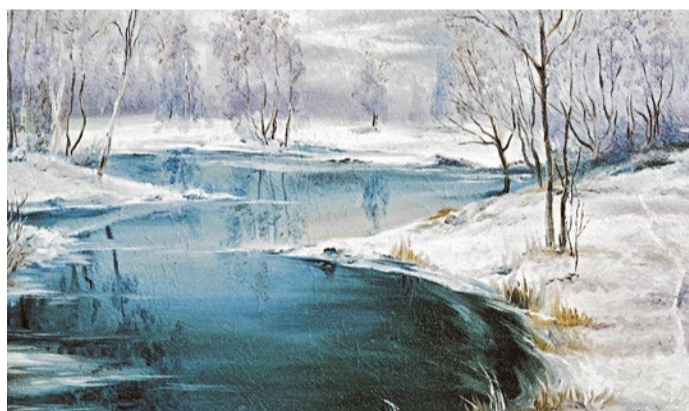
В «Зиме» Людмилы Болотской река не просто отразила небо, а, кажется, впитала в себя всю его синь