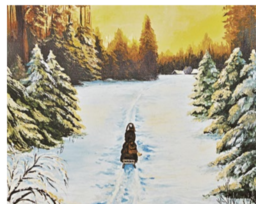
Глядя на пейзаж Мительмана, вспоминаешь Пушкина: «колокольчик однозвучный утомительно гремит»