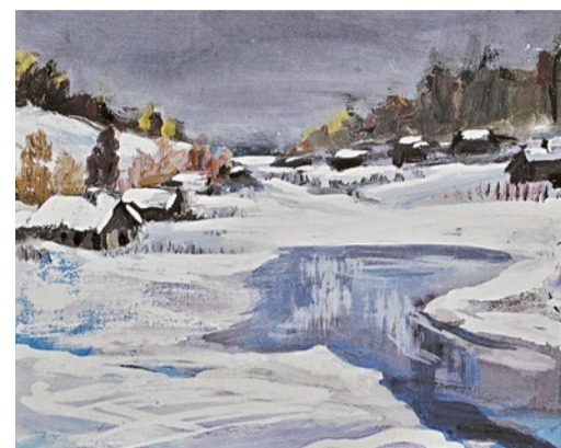
«Первый снег» Петра Сергеева запечатлел момент, когда зима празднично обновляет осеннюю серость