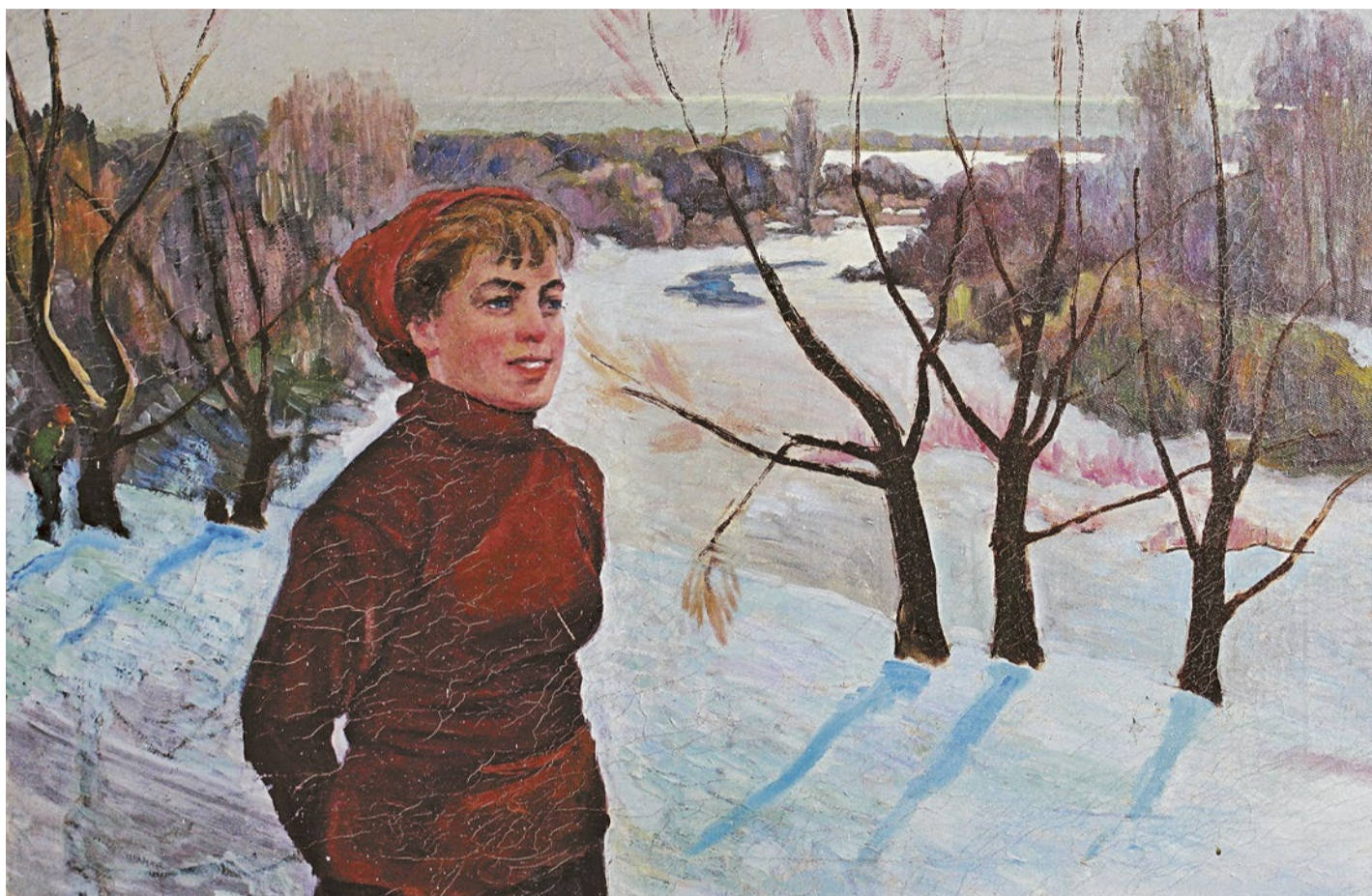
Героиню картины Григория Настича «Аллея зимнего парка» легко понять: бывает, катишься по лыжне и вдруг замрешь от несказанной красоты вокруг!

Музейно-выставочный комплекс встретил 2016 год экспозицией «Зимушка-зима». В нее вошло около 20 произведений, хранящихся в фондохранилищах МВК. Стены музея украсили живописные полотна девяти авторов-земляков.