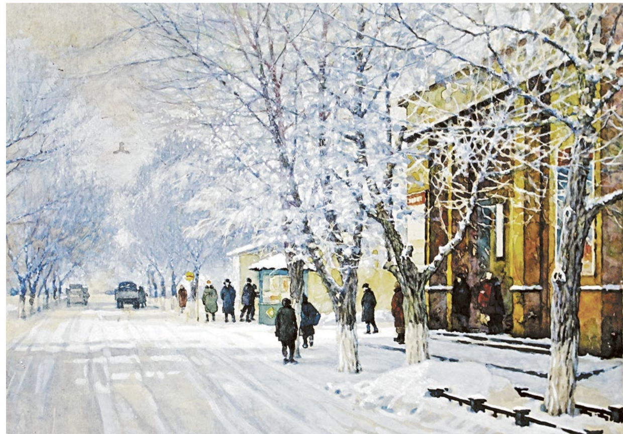
Валентин Плетнёв увековечил для нас один из первых очагов культуры Новотроицка — кинотеатр «Луч», находившийся на улице им. Пушкина. Сегодня в этом здании делают первые шаги в большой спорт юные боксеры ДЮСШ «Спартак»

Татьяна Михеева, заведующая выставочным отделом музея