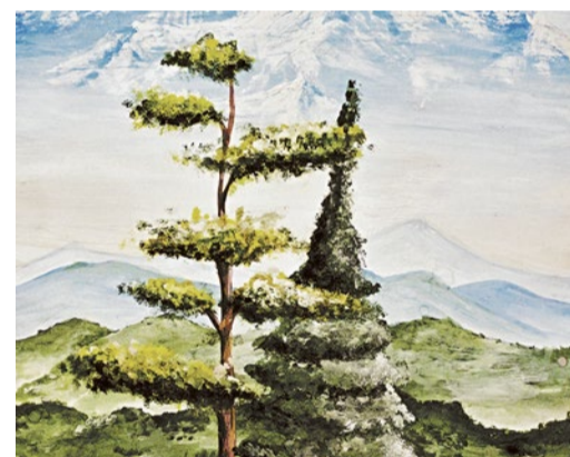
Ну как тут не вспомнить лермонтовскую сосну, которой на севере диком снится прекрасная пальма?