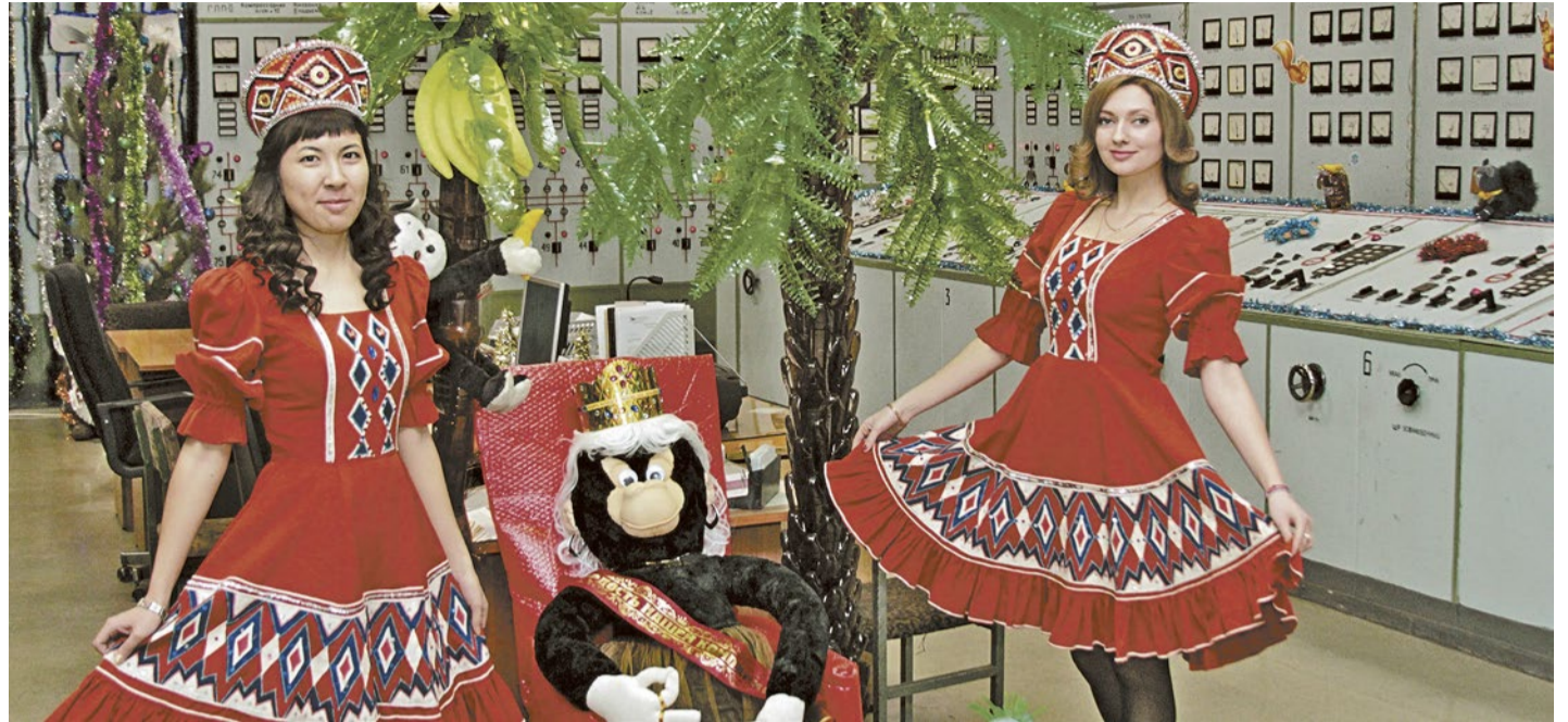
Коллектив ТЭЦ не в первый раз побеждает в смотре-конкурсе новогоднего оформления цехов