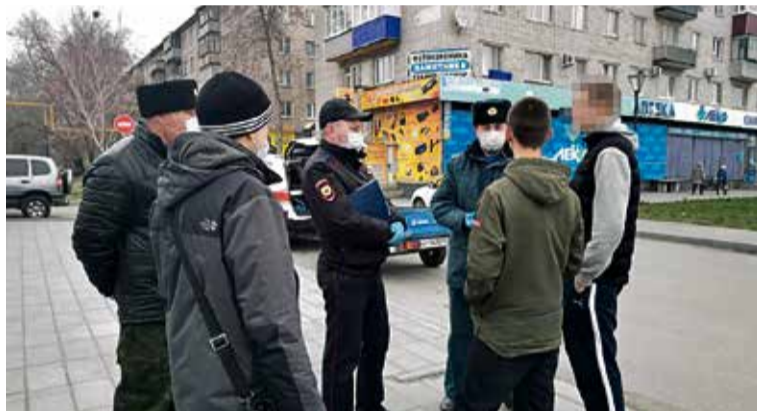
▲ Подростки могут выйти на улицу только в сопровождении взрослых

Только с 15 по 21 апреля 2020 года Новотроичским городским судом рассмотрены 24 дела об административных правонарушениях, предусмотренных ч. 1 ст. 20.6.1 КоАП РФ, — невыполнение правил поведения при введении режима повышенной готовности на территории, на которой существует опасность возникновения чрезвычайной ситуации, или в зоне чрезвычайной ситуации.