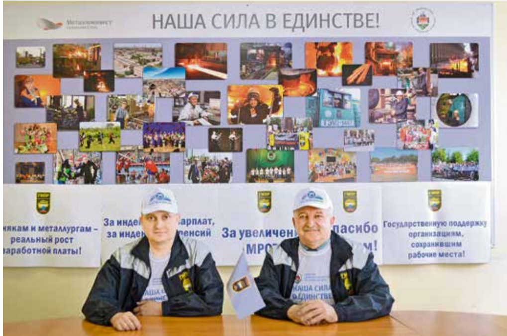
▲ Даже в условиях самоизоляции профсоюзные активисты нашли способ объединиться

Видеообращения к работникам Уральской Стали записали руководители структурных подразделений комбината, дочерних предприятий, Совета ветеранов