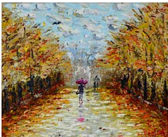
▲ Пейзаж «Красный зонт» своим настроением невольно вызывает в памяти «Осенний день. Сокольники» раннего Левитана