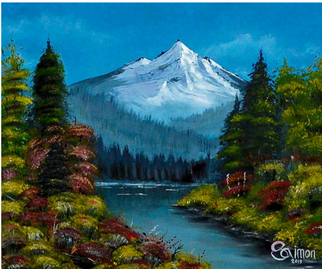
▲ «Альпы». К красоте гор точнее всего подходит эпитет «величественная»