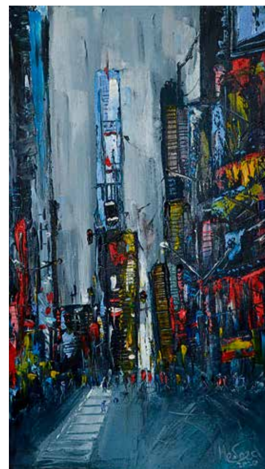
▲ Таким молодому новотроицкому автору представляется Токио