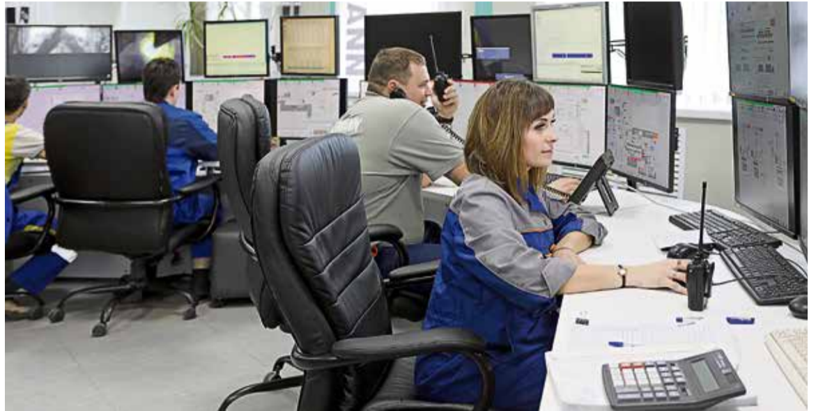
▲ Весь процесс производства цемента контролируют четыре инженера

Химия, физика, механика — вот неполный перечень наук, которыми должен владеть сотрудник ЦПУ. И традиционно профессии, связанные с большим количеством технических процессов, ассоциируются с мужчинами. Но для каждого правила есть исклю-