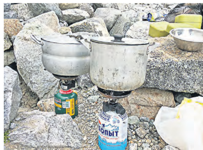
Нехитрый скарб альпинистов для приготовления обеда