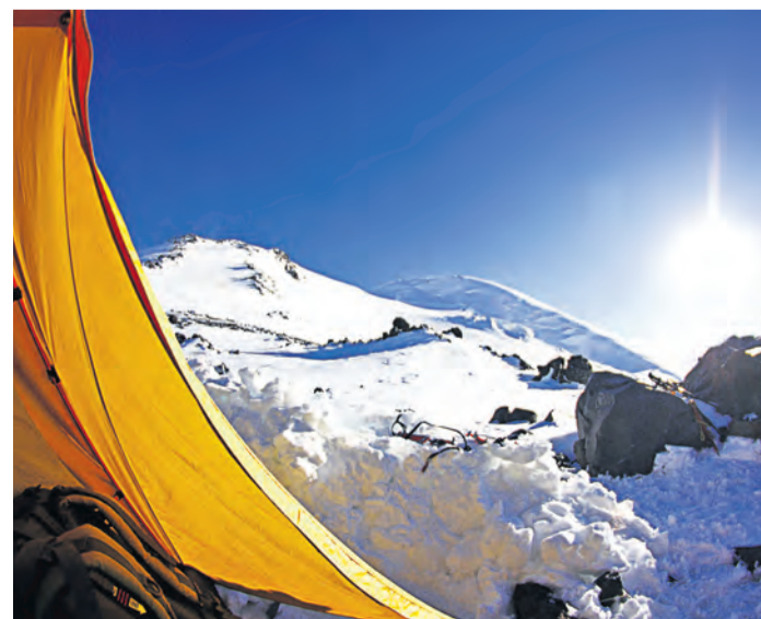
Рассвет – пора собираться в путь