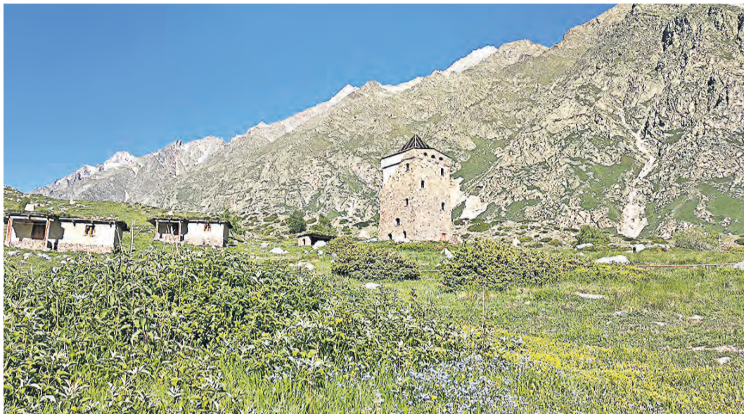
Древние здания в предгорье Эльбруса

М анит Николая Кавказ своими снежными вершинами, это видно, когда он рассказывает о своих походах. Для себя он открыл, что каждая гора имеет свой самобытный характер – подъем на очередную непокоренную вершину воспринимается по-иному.