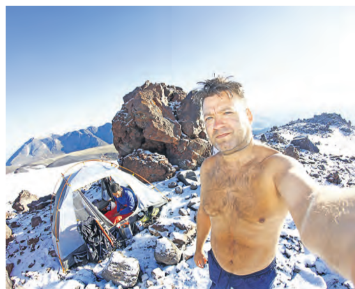
Первый снег на отметке более трех тысяч километров