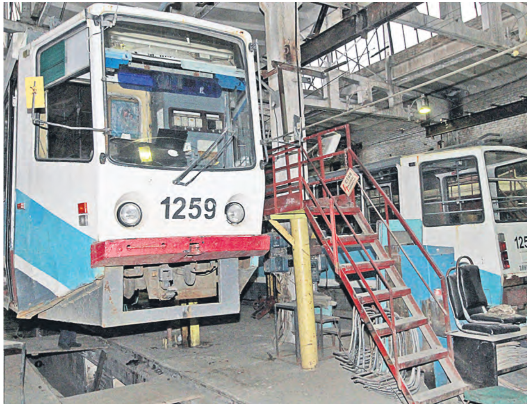
Судьба новотроицкого трамвая пока висит в воздухе

– Проведенная аудиторская проверка показала, что у