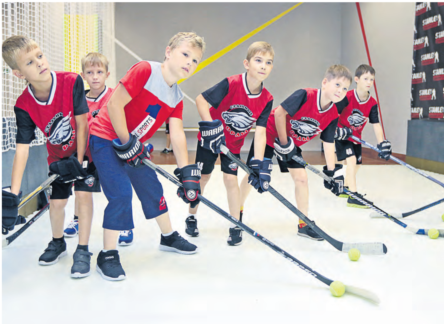
Сразу после торжественного открытия в стенах нового спорткомплекса прошла первая тренировка

В Новотроицке открылся хоккейный центр «Stanley», который станет базовой площадкой для отработки навыков и развития общей физической подготовки юных хоккеистов.