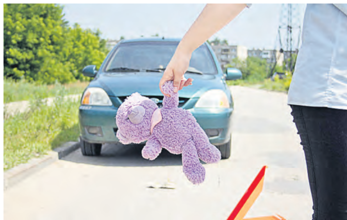
Моральный вред правосудие конвертировало в 100 тысяч рублей

В свою очередь и мама пострадавшей девочки также испытала стресс, переживала за дальнейшую судьбу дочери в связи с полученной ею травмой. Причина происшествия